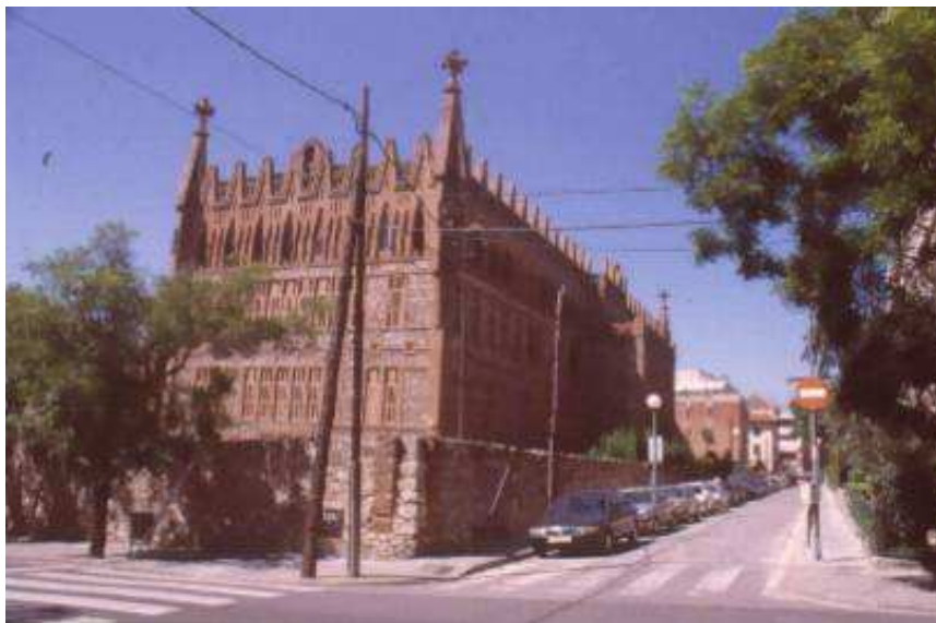
Vista carrer de Ganduxer i d'Alacant en direcció nord