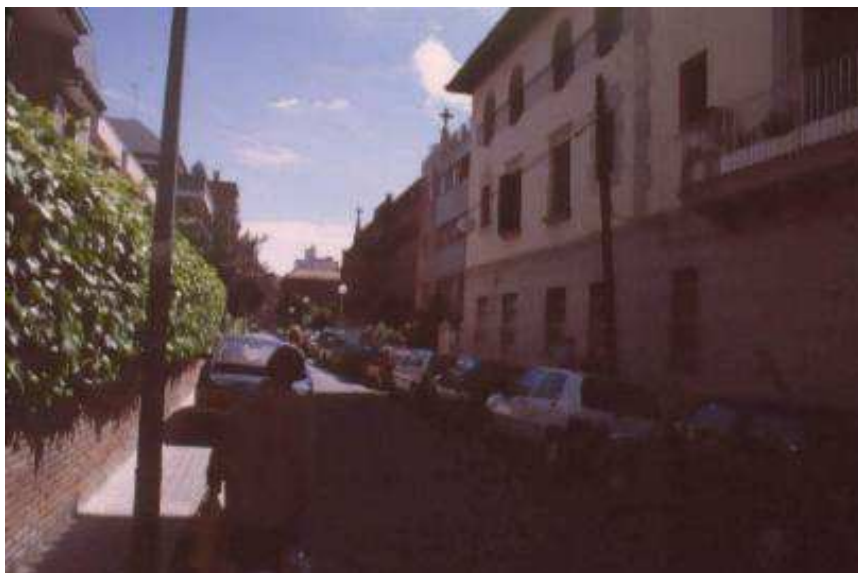
Vista des del carrer d'Alacant en direcció sud-est