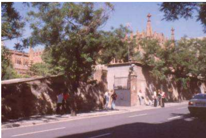
Vista des de la cantonada del carrer de Ganduxer amb Ronda del General Mitre