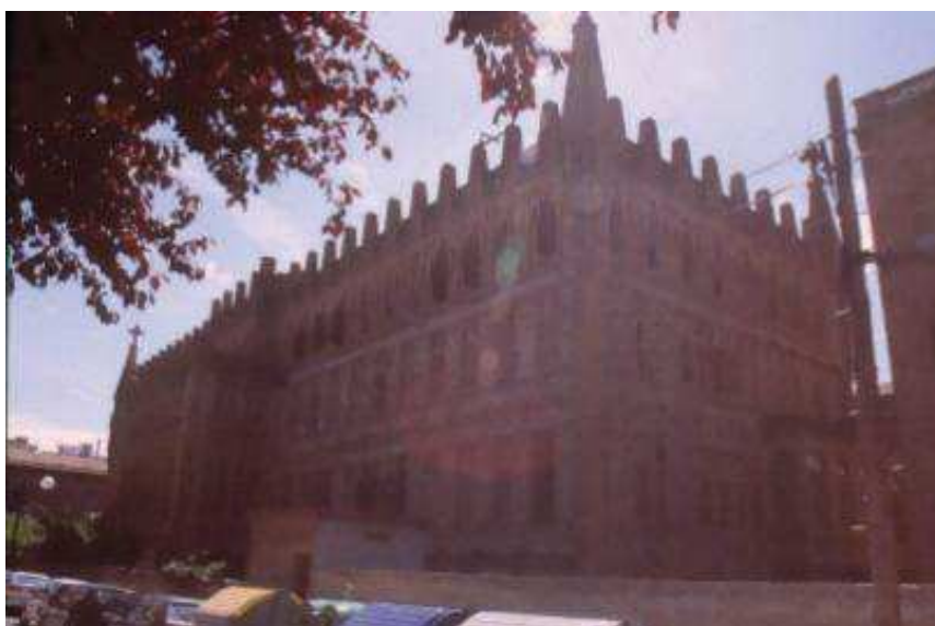
Vista des de cantonada carrer de Ganduxer i d'Alacant en direcció sud