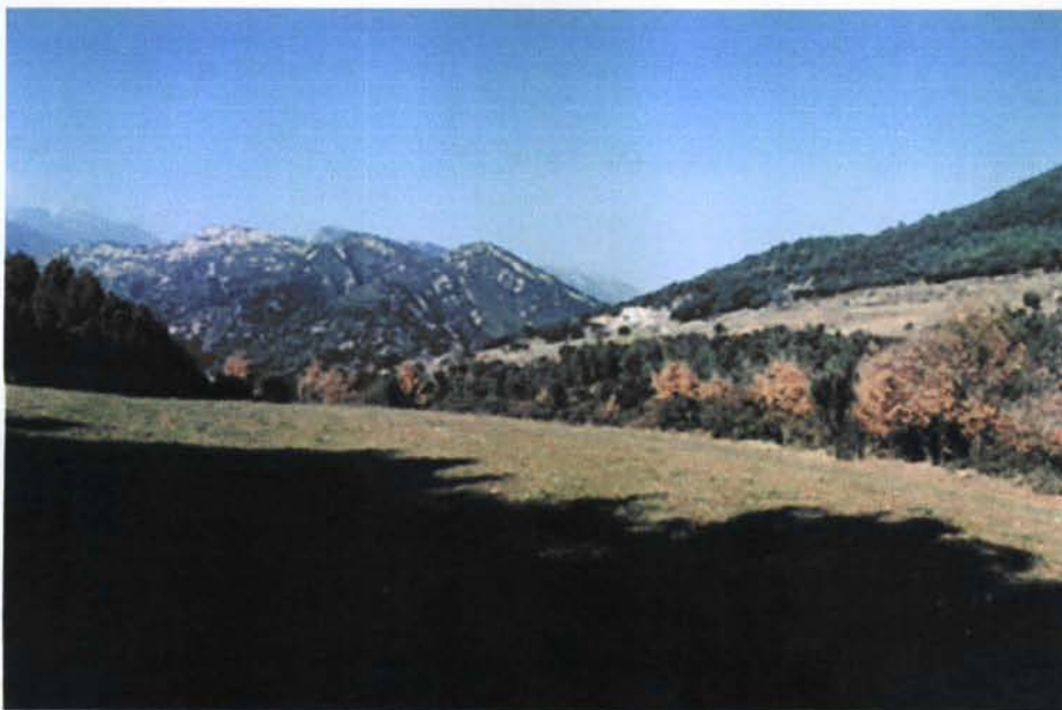
Vista cap a ponent