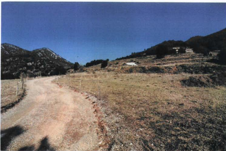
Vista des de l'altra riba del riu