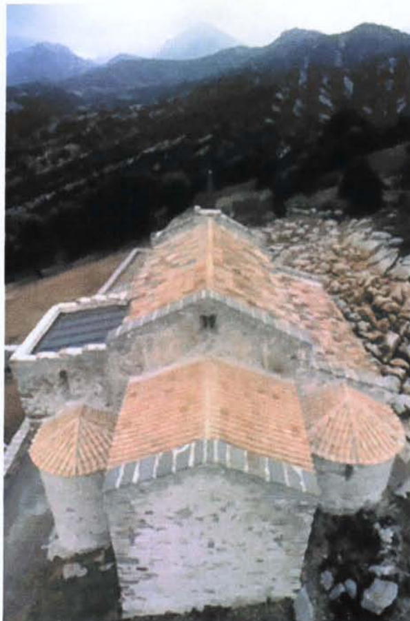
Vista del conjunt de l'església i el mas