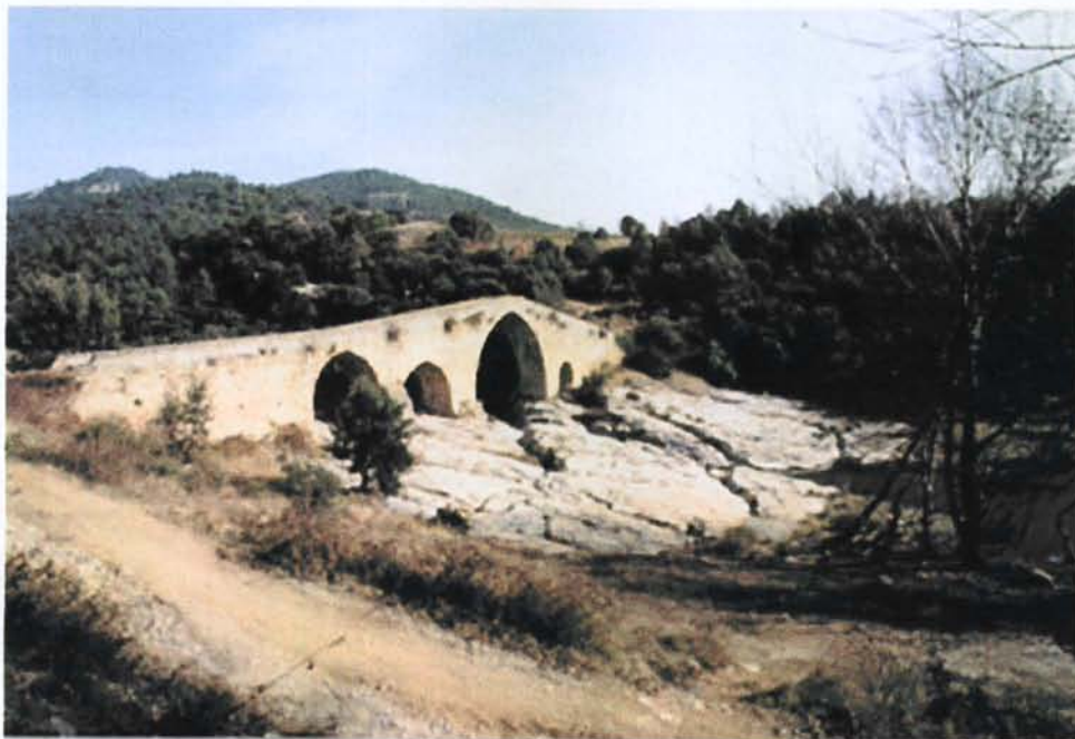
Vista des del pont