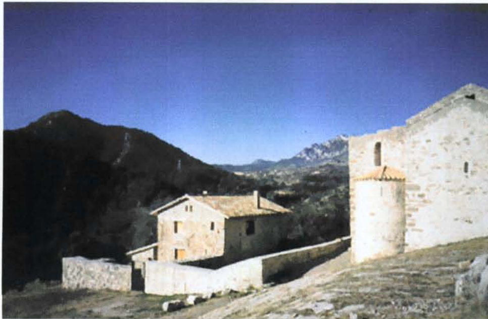
Vista principal de l'església