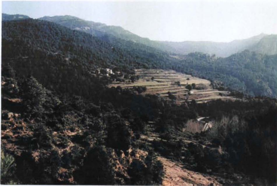
Vista del conjunt de l'església i el mas