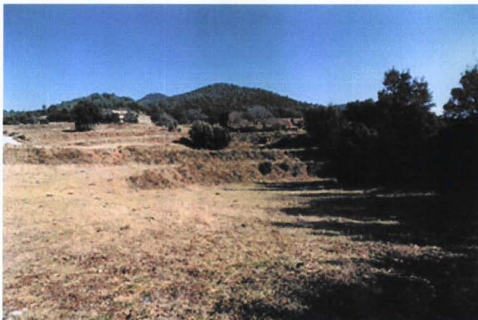
Camps i bosc a la banda sud del conjunt