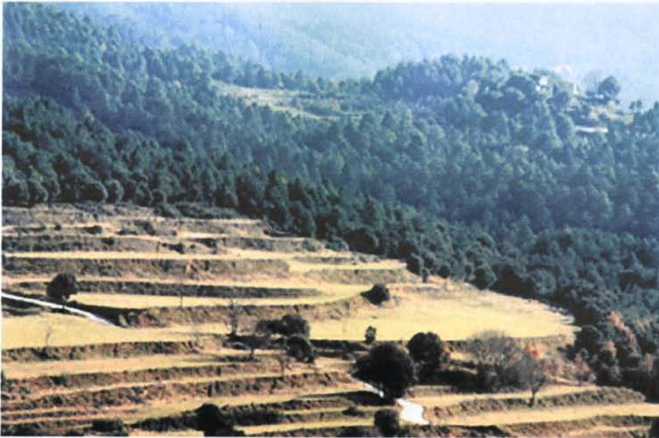
Camí i conjunt de l'església i el mas