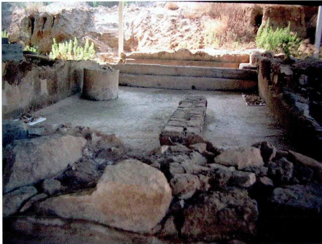
Vista general del "Caldarium" en la fase de neteja dels paviments.