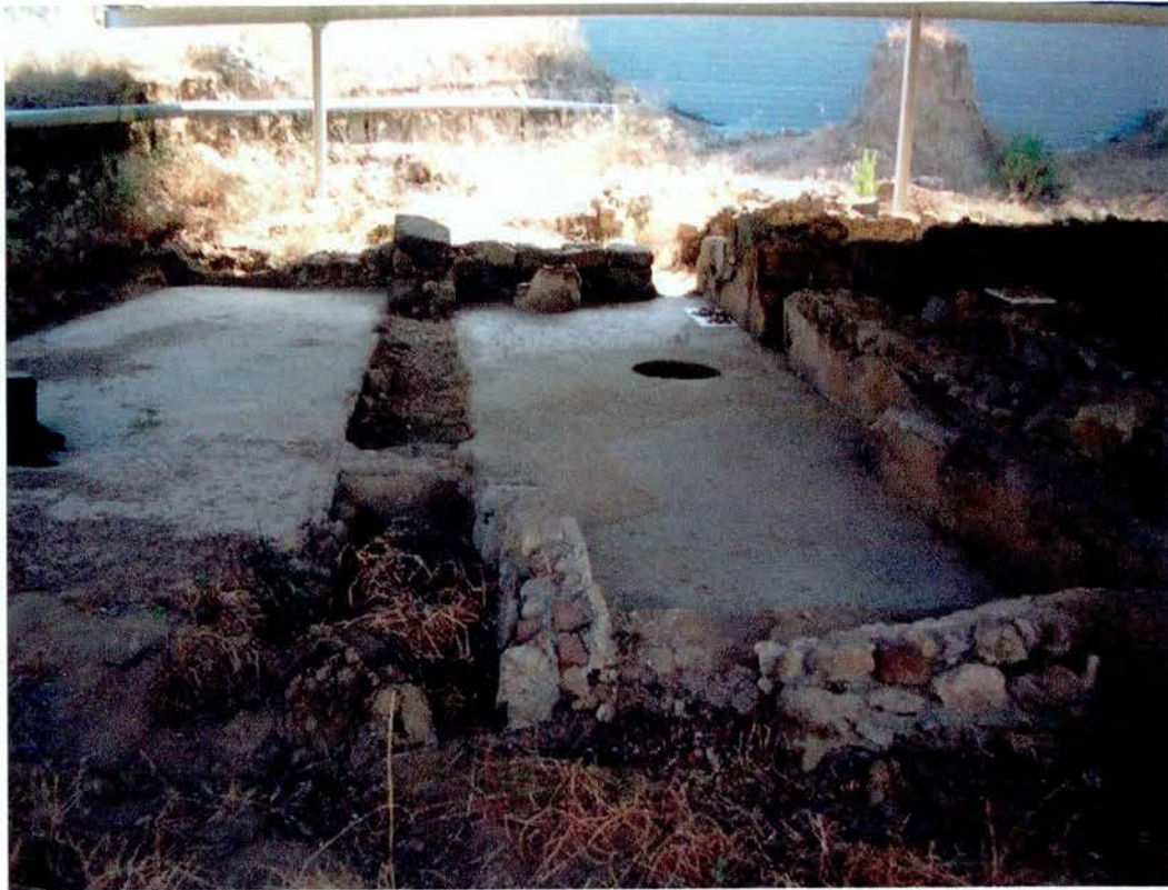
Vista general del "Tepidarium" en la fase de neteja i un cop aplicat el biocida.