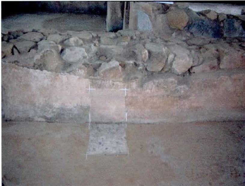
Cales de neteja a paviments i revestiments.