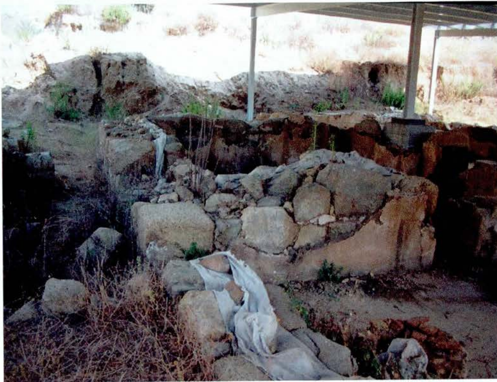
Detall del avançat desenvolupament de l'atac biològic.