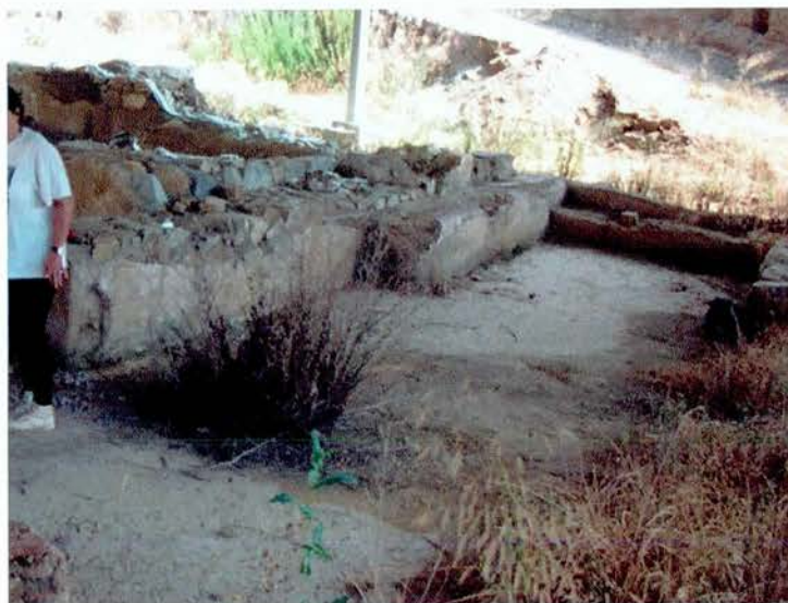
Estat de conservació dels paviments del " Tepidarium "

Els paviments d' opus signinum presenten gran quantitat de fang i brutícia generada per l'entrada d'aigües de pluja dels taluts circumdants a la zona amb coberta.