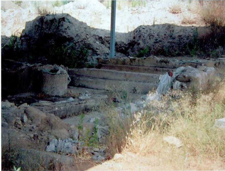
Estat de conservació inicial, vista parcial.

Els revestiments en general es troben en un estat de conservació regular (salvo als punts destruïts per l'home, cops fortuïts o llançament de pedres), amb zones que presenten símptomes de descohesió interna dels materials i petites desplaçacions o separacions dels revestiments del mur, localitzades majoritàriament a les vores de les superfícies conservades en intervencions de conservació anteriors, durant l'excavació arqueològica.