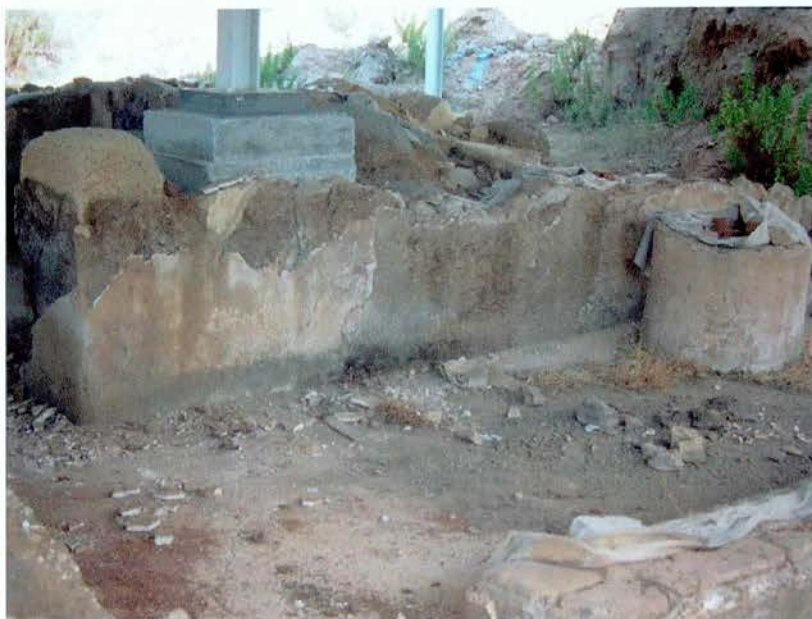
Zona del " Caldarium ", caiguda de revestiments.

Els revestiments en general es troben en un estat de conservació regular (salvo als punts destruïts per l'home, cops fortuïts o llançament de pedres), amb zones que presenten símptomes de descohesió interna dels materials i petites desplaçacions o separacions dels revestiments del mur, localitzades majoritàriament a les vores de les superfícies conservades en intervencions de conservació anteriors, durant l'excavació arqueològica.