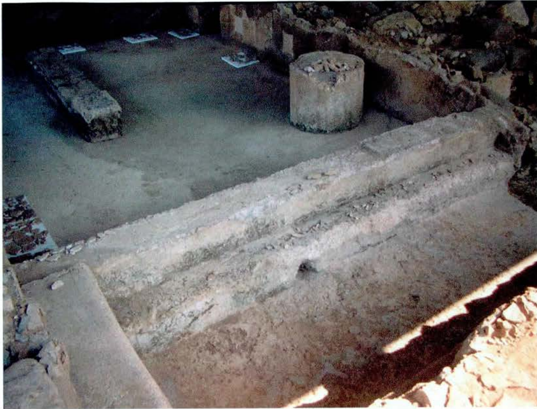
Vista general del "Caldarium" en la fase de consolidació de revestiments.