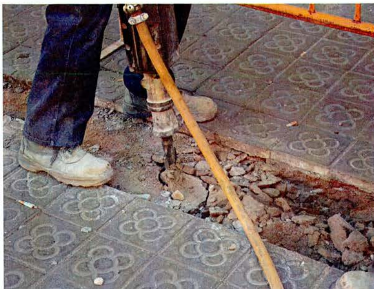
Foto1: Obertura de la rasa amb el martell pneumàtic.