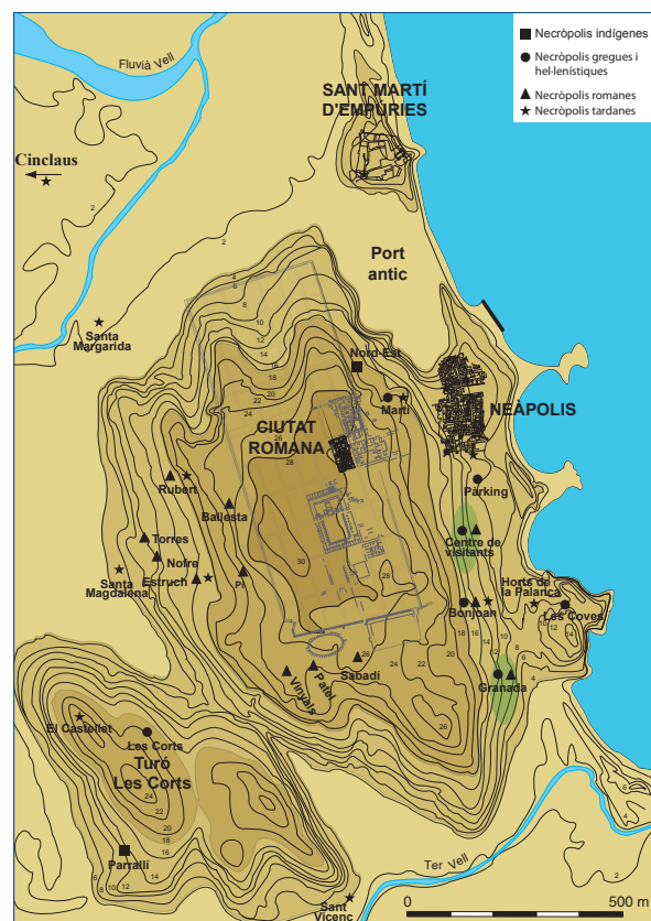
Figura 1. Plànol topogràfic del turó d'Empúries amb la situació de les diverses necròpolis conegudes d'Empúries (MAC-Empúries)

L'abandonament dels espais urbans de l'Empúries romana a partir de final del segle III dC i la concentració del nucli habitat a Sant Martí varen anar seguits per l'extensió de nous espais cementirials sobre les ruïnes de l'antiga ciutat, especialment sobre el sector de la Neàpolis i en el vessant est del turó de la ciutat romana. Altres espais d'enterrament de cronologia tardoantiga es desenvoluparen també en altres indrets de la topografia emporitana, en relació amb edificis religiosos situats a l'entorn rural, com els de Santa Margarida, Santa Magdalena i Sant Vicenç (Fig. 1).