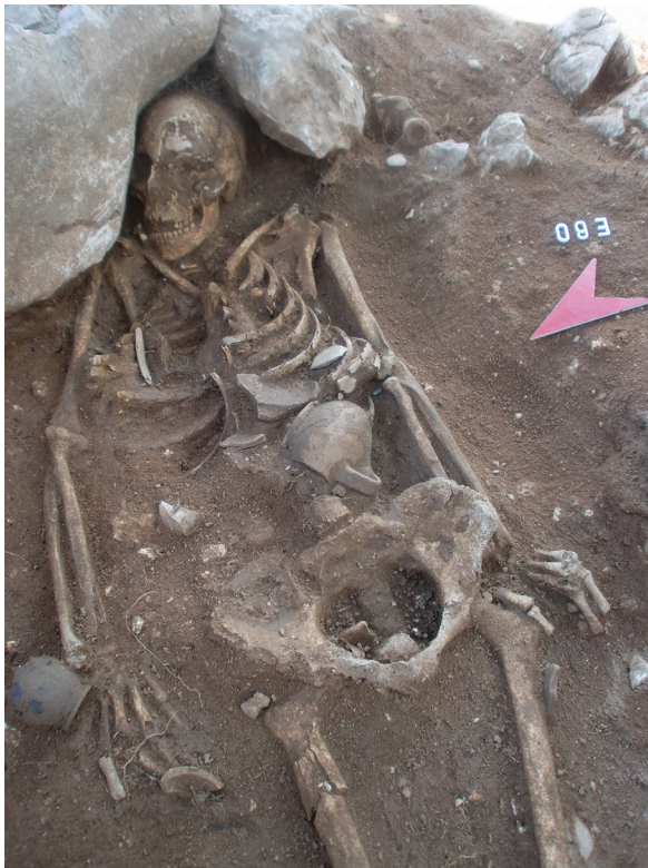
Figura 4. Tomba grega d'inhumació identificada com E-60, amb els elements que formaven part del seu acompanyament funerari (MAC-Empúries)

remenament de les restes. En tot cas, la beina d'espasa correspon al tipus VI de la Tène, coneguda ja amb el conjunt de la Neàpolis, que es data dins el segle II aC (García, 2006, p. 162-164 i 194-195).