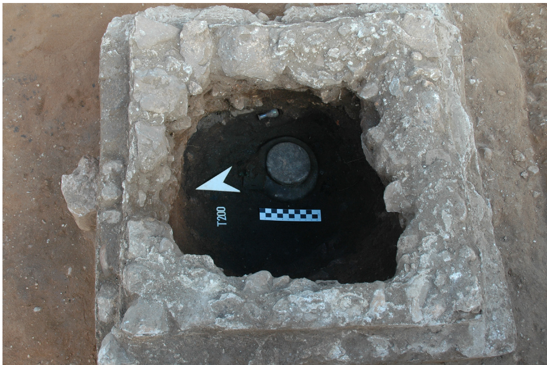
Figura 8. Vista general de l'excavació del monument funeràri d'una tomba d'incineració. Al fons de la imatge inferior s'observa l'urna de plom que contenia les cendres del difunt així com també alguns ungüentaris de vidre de l'acompanyament (MAC-Empúries)