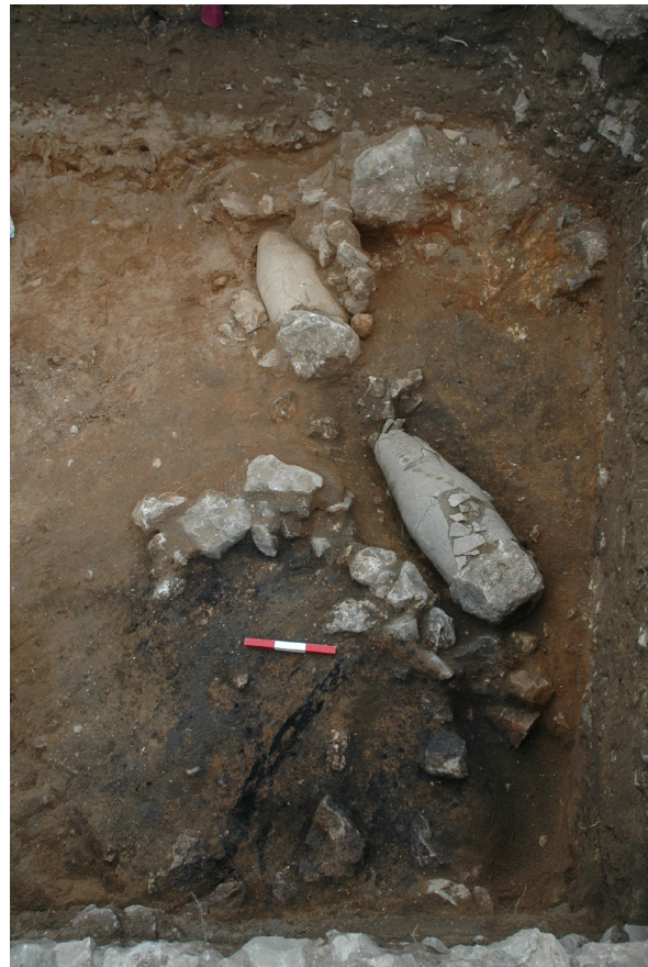
Figura 3. Nivells inferiors de l'excavació del sector 200, amb la presència de dues inhumacions infantils en àmfora. Al costat, podem observar les restes d'una incineració

Una d'aquestes tombes infantils (UE-229) va proporcionar les restes més espectaculars del conjunt, ja que estava acompanyada amb un aixovar de guerrer, format per un soliferreum enrotllat i dipositat al damunt de l'àmfora, dues puntes de llança, una espasa d'un sol tall, de tipus grec ( kopis ), que es va posar sota de l'àmfora, i un petit penjoll o amulet d'os. Al costat, a l'angle est, es va excavar un espai circular ple de cendres, possiblement un bustum , un lloc destinat a incinerar les restes d'un individu adult (UE-234). Aquest espai va aparèixer cobert de pedres, amb gran quantitat de cendres, uns grans troncs carbonitzats in situ , restes d'ossos cremats i fragments d'una urna ceràmica, de manera que tot fa pensar que es tractava d'una pira funerària (Fig. 3).