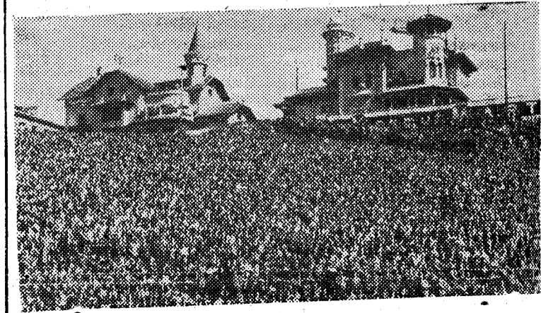
Aspecto que ofrecían las gradas del Estadio Metropolitano de Madrid durante el encuentro internacional España-Irlanda

Londres, 1.—Koenigsberg, antigua capital de Prusia Oriental y que se encuentra en la zona de ocupación soviética en Alemania, se llamará en lo sucesivo Kaliningrado, en memoria del que fué presidente del Presidium del Soviet Supremo de la Unión Soviética, Mikhail Kalinin, fallecido recientemente, según anuncia la radio de Moscú.