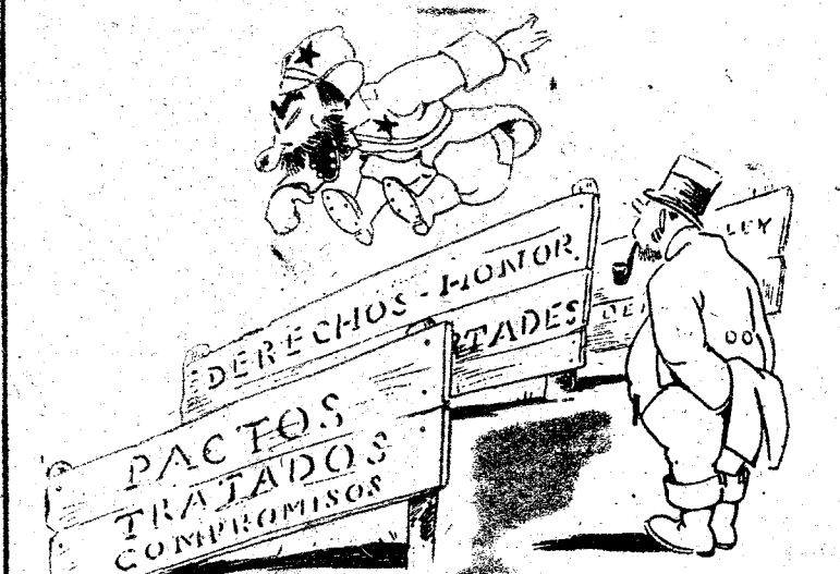
ATLETISMO POLITICO INTERNACIONAL —Este atleta sigue siendo el campeón de cien metros (vallas).