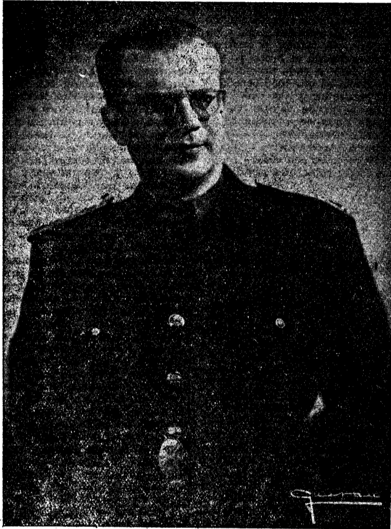
El Excmo. señor Gobernador Civil, que preside la Junta de Ordenación Arrocerá

Imagínese que lo primero que hay que hacer es arrancar todos estos juncos a mano. Los jornales son muy altos y créame que de aquí a dos meses no habrá jornalero disponible y eso que cobran de ocho a diez duros diarios. Después las caballerías se destrozan en