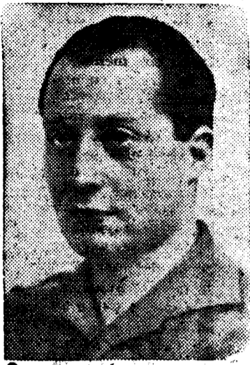
A nuestro inolvidable Fundador JOSÉ ANTONIO rindieron piadoso tributo los Asambleístas en su tumba de El Escorial

Queda exceptuado de esta medida el abono compuesto que facilita la Hermandad provincial de consignación oficial pues dicho abono viene ya controlado por la Jefatura Agronómica.