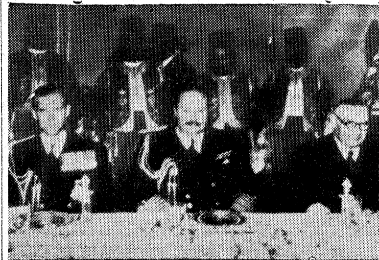
Mr. Bevin, el ministro inglés de Asuntos Exteriores (derecha), a su paso por El Cairo, de regreso de la Conferencia de Colombo, comió con el rey Faruk y con el duque de Edimburgo, con los cuales aparece en la fotografía.