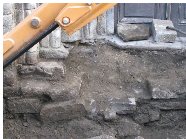
Figura 26. Deuant dera pòrta, s'an redescurbit es antiquas rèstes dera escalinata originau deth temple, causa que mos a permetut ena restauracion, de tornar a recuperar era volumetria originau qu'auie agut en sòn dia aguesta portalada erigida en darrèr quart deth sègle XII.

Es materiaus emplegadi s'agen d'èster de fòrça qualitat (an d'èster resistents ath clima) e respectuosi damb er aspècte finau que volem dar ath monument. Entà arténher aguesti objectius emplegam mortèrs de caudia entàs paraments extèrns (recuperam era madeisha semblança qu'aurien originaument e tanben acomplim era Lei de Patrimòni, que mos exigís