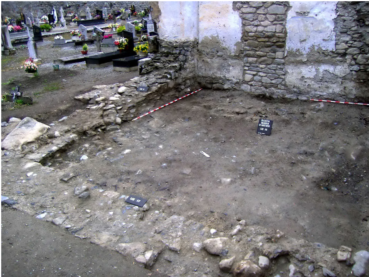
Figura 5. Delimitacion der espaci arqueologic mercat pes limits dera antica sacristia. Ath hons podem observar er antic accès ara madeisha pera pòrta de comunicacion damb era nau.