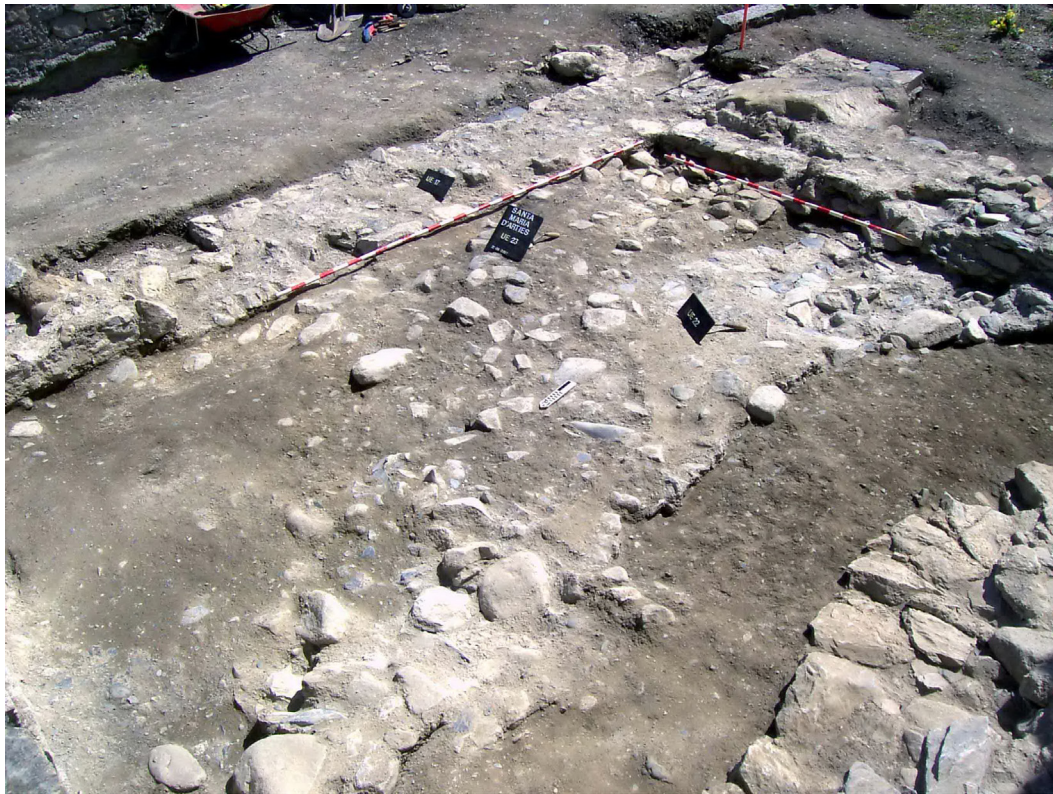
Figura 7. Inici dera aparicion dera cresta superiora dera fundamentacion dera antica glèisa preromanica. Ath hons tanben mos ges era antica paret deth castèth romanic que siguec profitada damb posterioritat pera sacristia coma fundament dera sua paret èst.