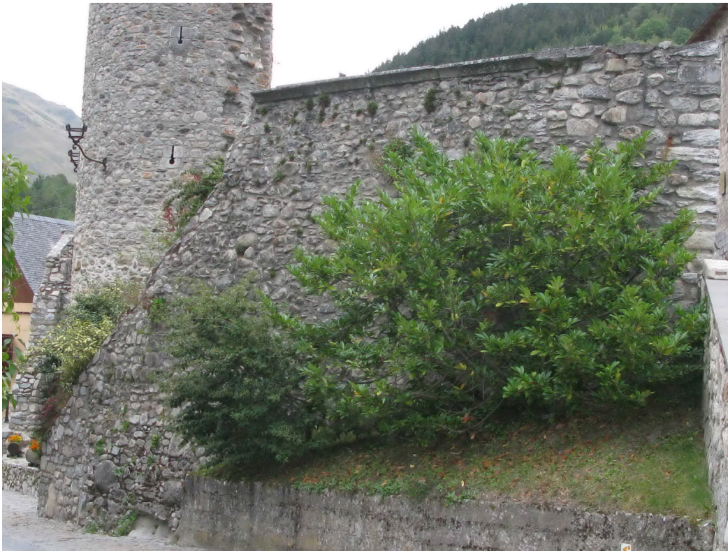
Figura 27. Un viatge uedada tota era plaça e analisada era informacion que mos a facilitat, s'a decidit d'esbaussar tot un seguit d'elements que perjudicauen era interpretacion deth conjunt medievau e que non auien valor patrimoniau en se madeishi.