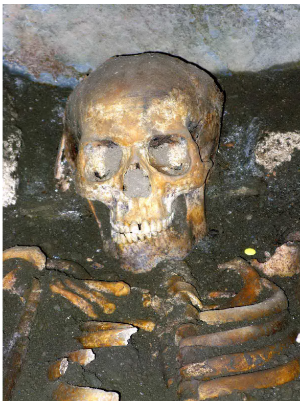
Figura 15. Enterrament de finaus deth sègle XII reaprofitant ua hòssa nautmedievau. Poderie èster eth possible promotor dera glèisa romanica.

Apareishen es labades de cuberta des hòsses vinculades ara necropòli dera nauta Edat Mieja.