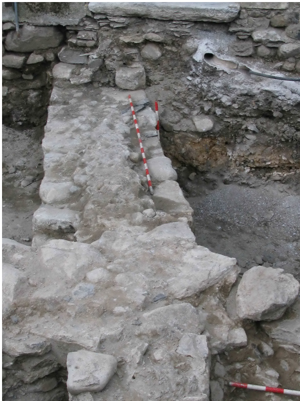
Figura 25. Un viatge arthenhut er extrem oèst dera plaça, localizam eth barrament deth castèth per aguest extrem. Aguest tram de muralha continue per dejós dera actuau casa parroquiau.

Deuant dera possibilitat d'auer ara nòsta disposicion es servicis d'un picapeirèr profesionau, se decidís d'elaborar es pèires damb eth madeish tractament des originaus. Atau, donc, es pèces an estat hètes a man e s'a sajat que totes eres auessen mesures disparières, entà poder-les integrar de manèra corrècta ena naua absida. Entà arténher era integracion maximau der element nau respècte deth vielh, s'a sajat de recuperar era modulacion qu'auèc en sòn dia era absida originau. Açò a estat possible perque encara se sauuaue part dera paret primitiva e tanben gràcies ara hièstra sud. Entà poder conformar era corbatura ara bastissa, es pèires naues s'an trabalhat de manèra corba entà integrar-les de manèra perfècta.