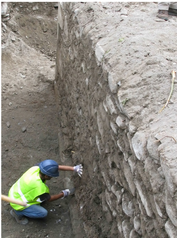
Figura 22. Un viatge delimitada aguesta estructura castrau se procedic ath sòn uedat damb maquina enquiàs nivèus arqueologics. Aguesti corresponien ath moment d'esbaus des muralhes e des estructures militares que non interessaue sauvar en an 1766.

Un viatge uedada tota era plaça e analisada era informacion que mos a facilitat, s'a decidit d'esbaussar tota ua seguida d'elements que perjudicauen era interpretacion deth conjunt medievau e que non auien valor patrimoniau per eri madeishi. Mos referim a dues parts corresponentes ara antica grada, que ja patic un esbaus accidentau en 2002 quan se trabalhau enes òbres deth carrèr plaçat per dejós e ath nòrd deth temple. Quan queigues aguesta porcion deth paredau, demorèc ath descubèrt era