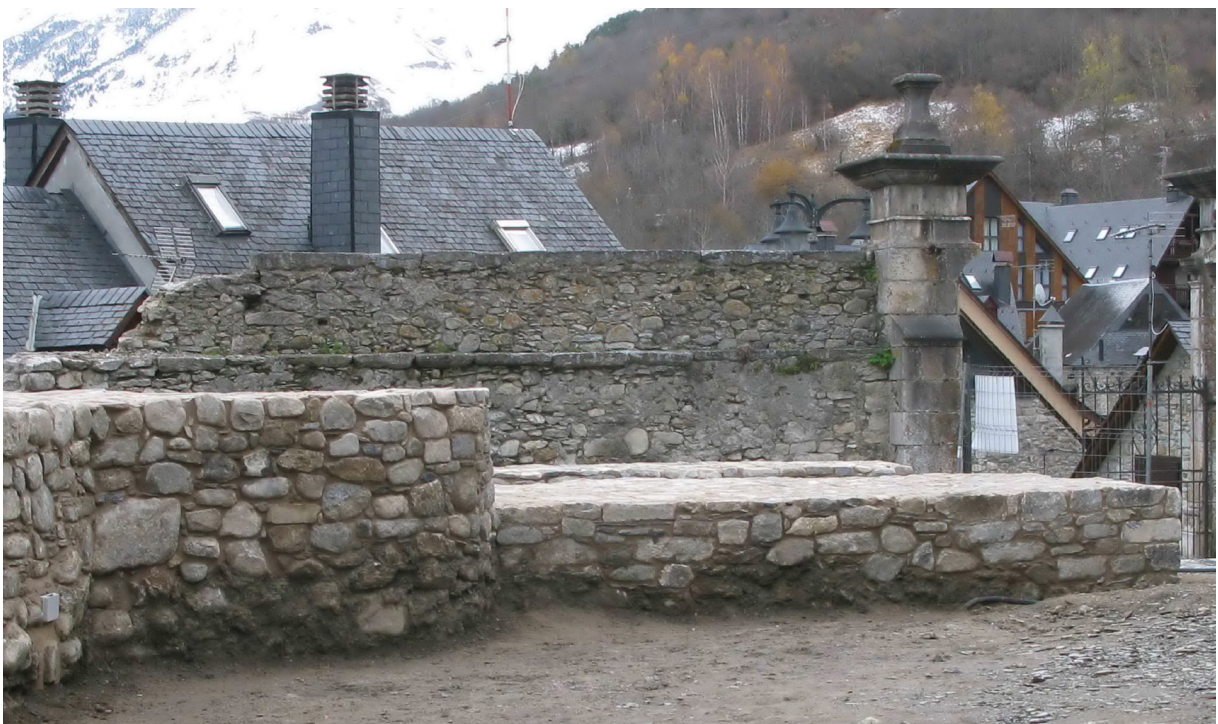
Figura 35, 36, 37, 38, 39. Estat final de la consolidació de les estructures castrals