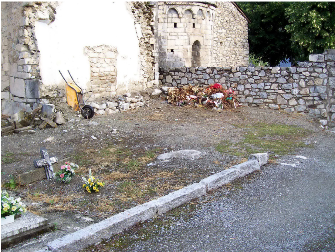
Figura 2. Antica sacristia bastida en sègle XVIII ( 1780 ). Estat der espaci arqueologic ar inici dera actuacion.