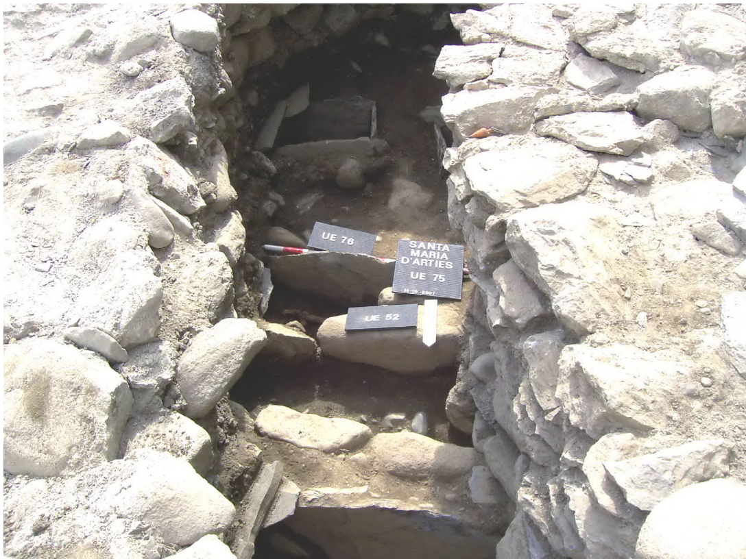
Figura 12. Espaci entre absides un viatge uedades es hòsses