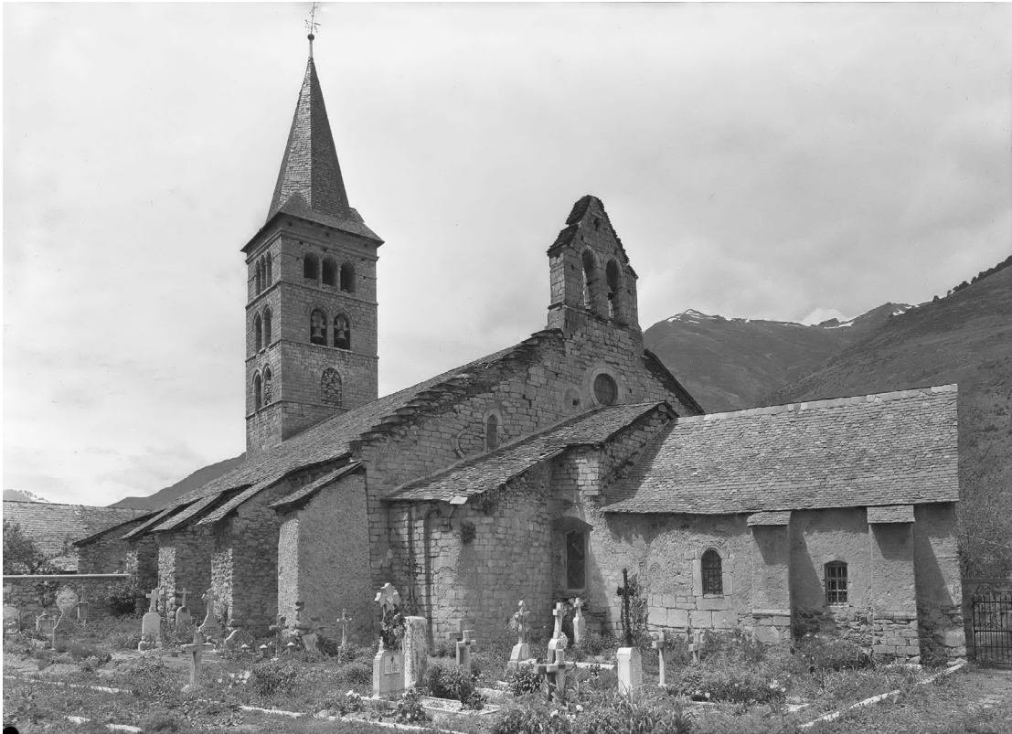
Figura 1. Aspècte deth monument a principis deth sègle XX