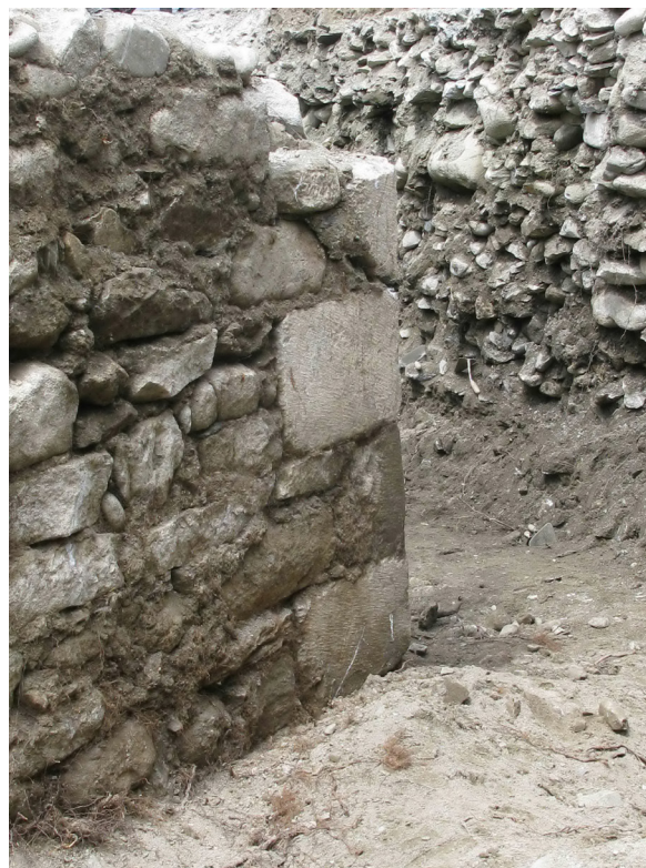
Figura 21. Era sua cantoada Nòrd-èst ei compausada per pèires picades de marme, atau coma era pòrta localizada ath sud.

posterior vedem com aguesta ère paredada, segurament damb posterioritat a 1649, e sonque foncionarie era gessuda oèst (non localizada en aguesta campanha). Per dejós dera tor, e peth sòn costat oèst, i trapam vielhes estructures restacades as disposicions nautmedievaus.