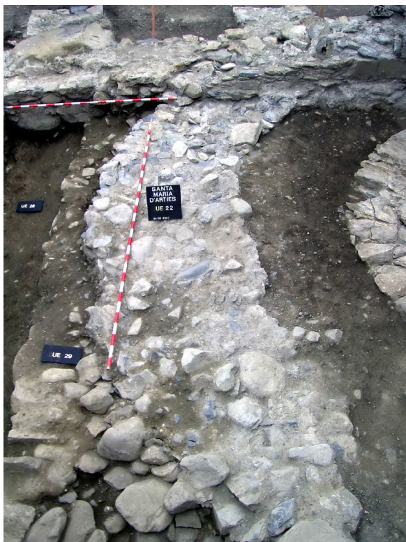
Figura 8. Fundamentacion dera antica glèisa preromanica. Ath hons podem observar coma era sacristia s'i superpause.