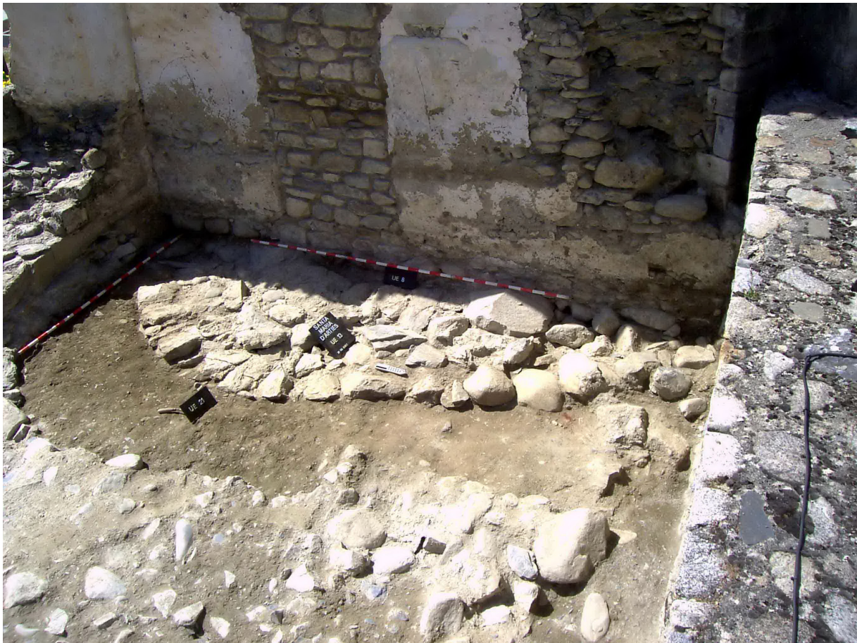
Figura 6. Localizacion dera fundamentacion dera absida romanica. Podem observar coma eth barrament dera antica sacristia se superpausa ara madeisha

espacis presbiteraus de murs convergents. Era vòuta dera nau centrau naute fòrça mès qu'era absida que li correspon e se relacione damb un mur en arc trionfau.