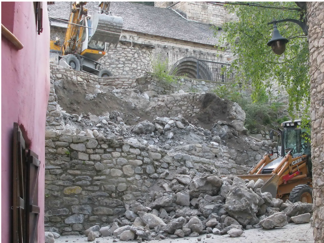
Figura 28. Procès d'esbaus deth tram èst dera grada.