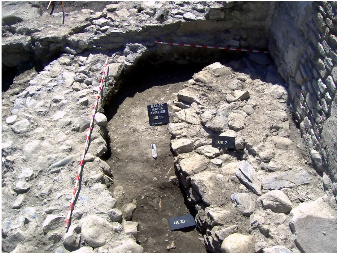
Figura 11. Vedença der espaci entre es dues absides, era romanica ( sègle XII ) e era preromanica. Vedem coma damb era bastenda dera naua glèisa se talhe era fundamentacion dera anteriora. Vedem tanben coma era sacristia les profite as dues coma fundamentacion.