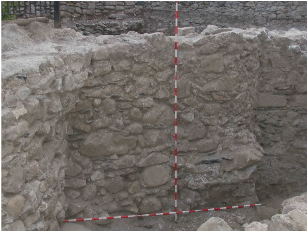
Figura 23. Un viatge localizadas totes es estructures deth sector nòrd-èst, s'inicien es trabalhs ena cara nòrd, perfilant e demilitant pera sua part interiora era muralha que barraue per aguesta banda era fortificacion.