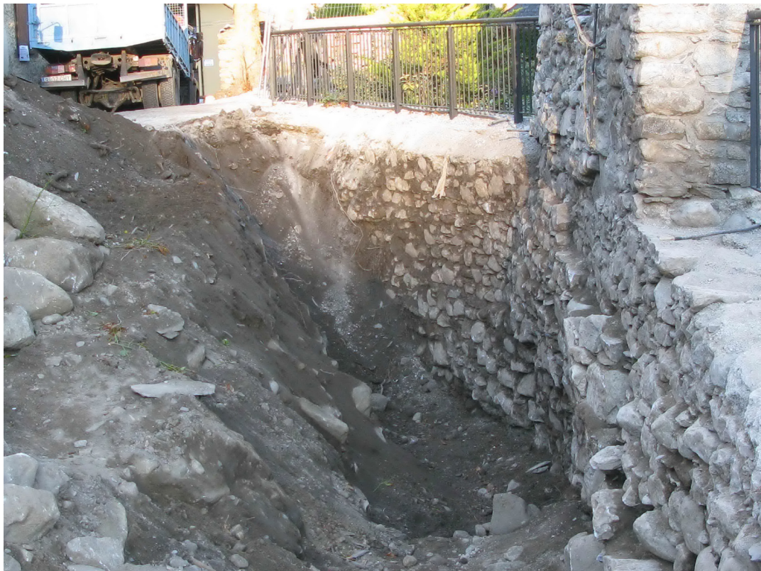
Figura 24. Ath dessus d'aguesta muralha i trapam fundamentada era bestor nòrd deth castèth.