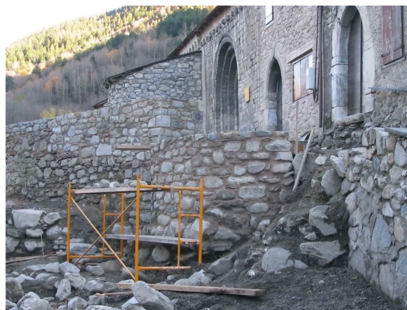
Figura 33. Fin finau s'a consolidat era bestor apareishuda ena cantoada nòrd-oèst dera fortalesa. Aguesta s'a lheuath mès d'un mètre en sòn extrem oèst.

Un viatge aumplit e compactat aguest espaci, se i a plaçat 60 cm de tèrra, que tanben s'a compactat damb posterioritat. Aguesta basa mos a servit entà deishar prèsta era zòna verda estacada ara superficia absidau deth temple, que tanben englobè es trobalhes der an 2007, consistentes en plan dera antica glèisa preromanica e en estructures deth castèth baishmedievau (muralha èst).