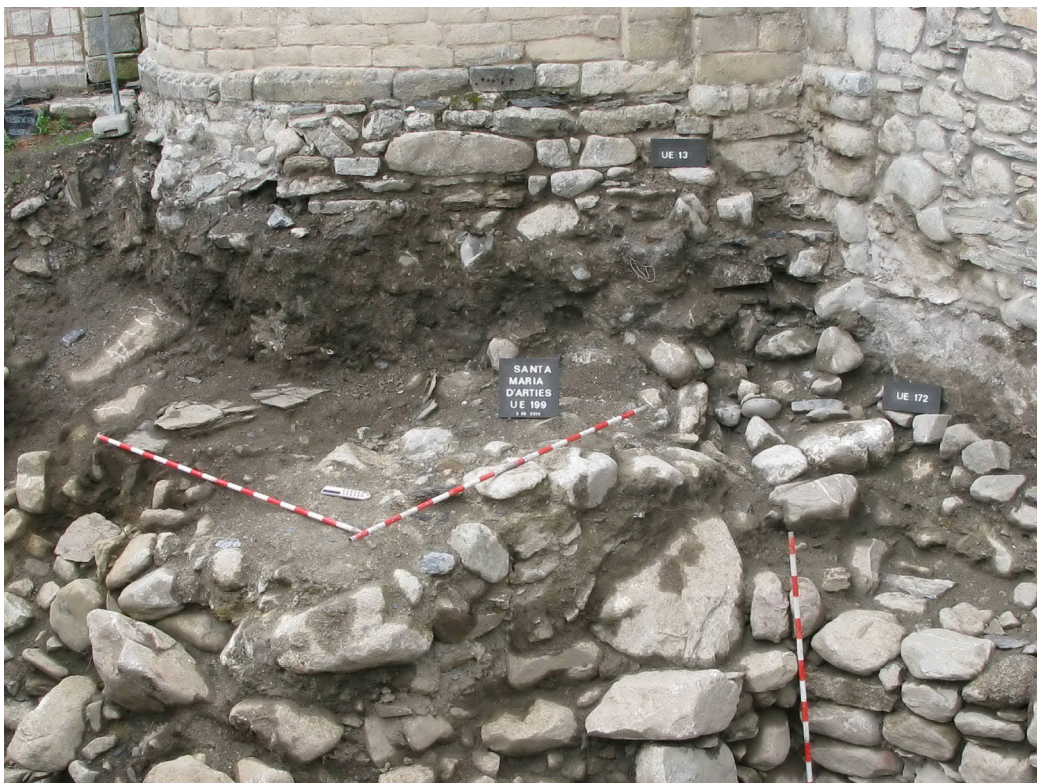
Figura 19. Vedença dera relacion estratigrafica entre es estructures nautmedievaus e era necropòli (s'òbsèrve era hòssa que les talhe ena part esquèrra dera imatge). Atau madeish se ve damb claredat coma era absida romanica talhe er enterrament.