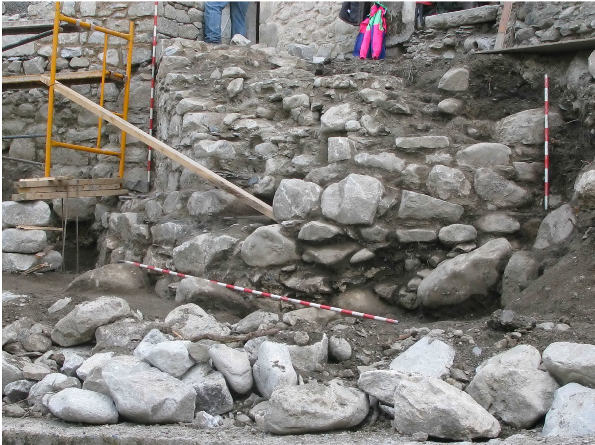
Figura 29. Un viatge esbaussades es estructures modernes dera banda oèst dera plaça, podérem veir per sua banda exteriora era bestor plaçada ena cantoada nòrd-oèst dera antica fortaleza.

diferenciar çò qu'ei originau de çò qu'ei modern). Açò ac artemhem damb era coloracion que mos da aguest mortèr, qu'ei un shinhau mèns marronenc qu'er originau, qu'ei blanc. D'aguesta manèra acomplim damb era lei, recuperam er aspècte qu'aurie agut originau e protegim es estructures originaus. Es farciments intèrns des estructures se hèn damb hormigon convencionau.