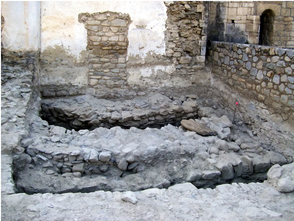
Figura 13. Aspecte finau campanha ena part exteriora

Un viatge artenhudi aguesti objectius ena prumèra etapa amiada a tèrme en ostiu (mesi d'agost e seteme deth 2007) e deuant des excellenti resultats obtengudi, se vedec obligat un segon periòde d'intervencions ena part interiora dera glèisa (absida centrau e presbitèri) pr'amor d'acabar de confirmar es donades extrètes en costat exterior (mesi de noveme e deseme). Eth plantejament des trabalhs ena porcion intèrna deth temple aueren coma objectiu era eliminacion des nivèus de taula de husta dera zòna presbiterau a conseqüència deth sòn mau estat de conservacion. Un viatge desmontat eth solèr de husta calie mòir es autars, tant eth centrau coma es des absidiòles lateraus (actuacion fòrça de mau hèr peth sòn pes). Damb era ajuda dera brigada deth Conselh Generau s'artenhec er objectiu de mòirles. Damb un tractel s'artenhec a botjar-les.