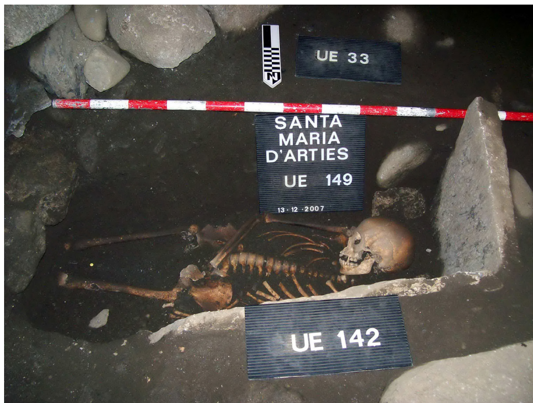
Figura 16. Hòssa talhada pera fundamentacion dera naua absida romanica bastida ath dessús dera necropòli

A començaments der an 2008 é'inièc eth seguiment arqueologic des esbaussi e recuperacion d'elements originaus ena part dera cabeçada deth temple. Aciu hérem ua analisi en verticau dera estratigrafia des paraments e elements que la conformauen tà desnishar quini èren medievau e quini èren posteriors. Ja vedérem com aguesta absida auie patit quauqua remodelacion en periòde comprenut entre es sègles XIV e XV. Ua hièstra bastida ath dejós der arc presbiterau podec èster era colpabla de debilitar era estructura e provocar quauqua patologia ena estructura originau. Ath long d'aguesti trabalhs apareishec un element fundamentau entà poder restaurar era absida corrèctament, com ère era hièstra originau romanica dera part meridionau d'aguesta. Un viatge acabadi es trabalhs arqueologics e dempús d'avalorar era importància des elements arqueologics qu'an apareishut, s'an consolidat e s'an reintegrat en entorn der espaci que s'ur-