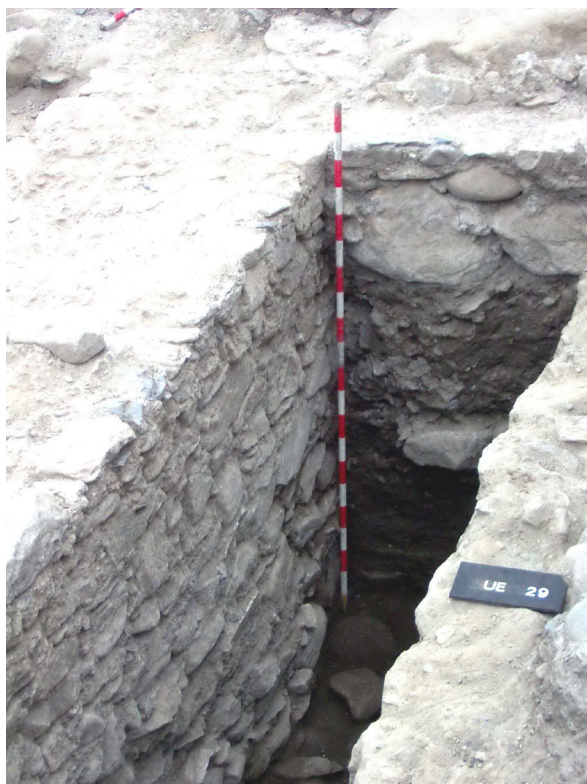
Figura 10. Paret deth castèth modern (sègle XIV) a on podem veir era potèncià deth mur.

cauçament qu'afectauen era zòna d'actuacion. Aguesti trabalhs s'an hèt mejançant ua maquina retrocatadora mixta provedida de pala de neteja e pala cargadora.