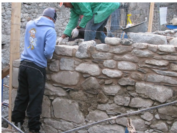
Figura 31. Un viatge consolidada era muralha èst, es trabalhs se centren ena recuperacion dera tor quarrada plaçada ena cantoada nòrd-èst dera fortificacion.

Dempús de consolidar era tor comencen es trabalhs ena muralha nòrd. Aguesta recupèrè ath torn de 50 cm de mejana ena sua altitud, excèpte en sòn tèrme oèst, a on puge 95 cm. Cau precisar qu'enes dus trams d'aguest parament s'an deishat dus punts de lum entà poder illuminar eth carrèr e eth monument. Era installacion s'a hèt per laguens dera estructura.