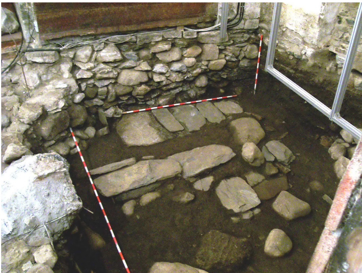
Figura 14. Vedença der encastre presbiteriau un viatge dubèrt en extension.

que localizam en un lòc tant especiau coma ei eth presbitèri deth nau temple d'Arties, pòt correspóner ad aguest personatge. Tot açò ei restacat damb era bastenda d'aguesta glèisa que, segontes es especialistes en istòria der art, correspon ath darrèr quart deth sègle XII, e aquerò concòrde damb era cronologia d'aqueri hèts. E ja entà acabar era seqüència der interior deth temple, localizam per dejós dera absidiòla nòrd e part deth presbitèri, rèstes der antic castèth nautmedievau (possibles rèstes d'ua tor que podie auer agut 6,85 mètres de diamètre, mès que deuant des nivèus d'enrasament generadi enes actuacions der an 1972 non s'a podut confirmar, ja qu'a desapareishut grana part dera sua planta). A mès, se hèn lheuaments planimetrics detalhadi de tot eth sector presbiteriau e dera façada èst.