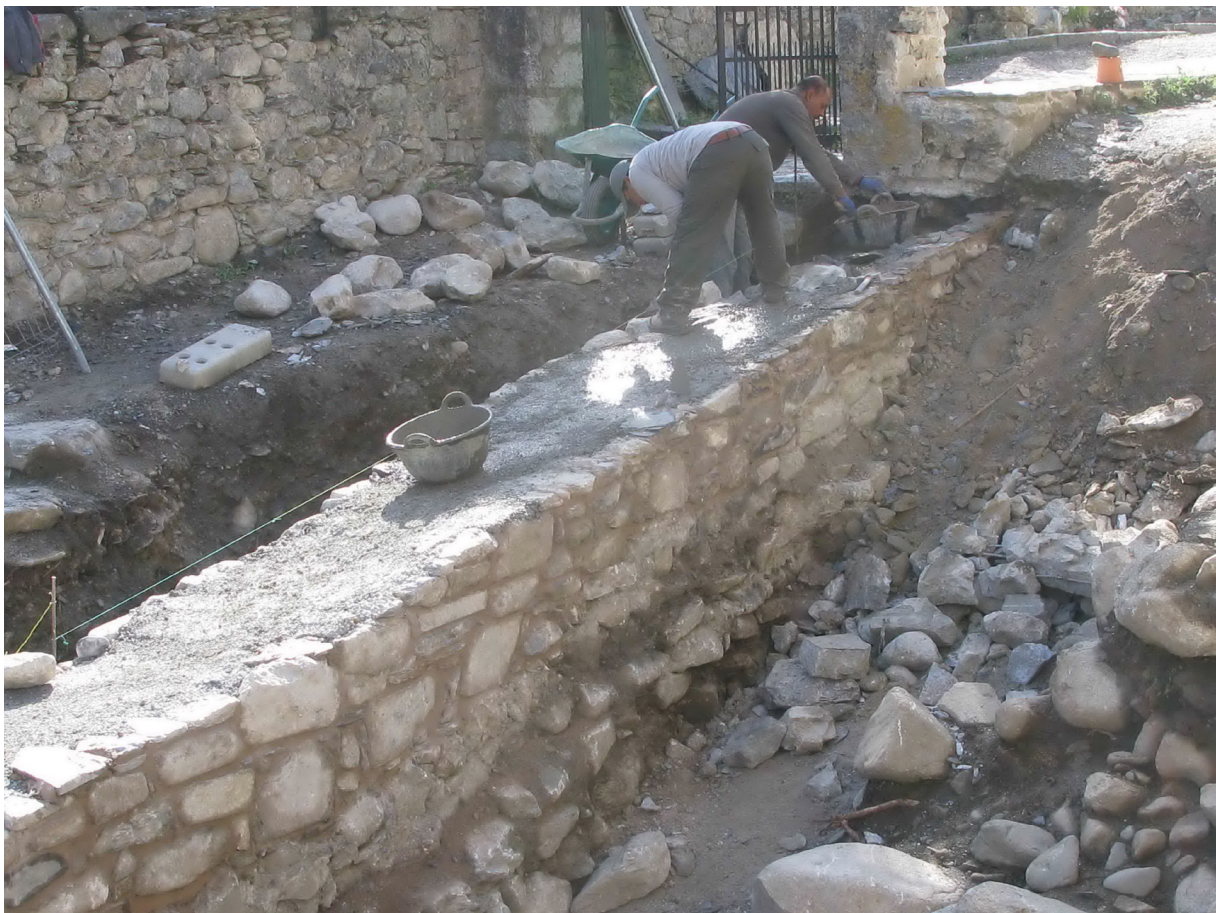
Figura 30. Es prumèri trabalhs de consolidacion s'inicièren pera muralha que barraue per èst era fortificacion. Aguesta s'a repujat ath torn de 50 cm., encara qu'era sua còta definitiva vierà mercada pes nivèus finaus deth paviment de labades que se plaçarà ena plaça.

Un viatge consolidada era muralha èst, es trabalhs se centren ena recuperacion dera torquarrada situada ena cantoadada nòrd-èst dera fortificacion. Eth critèri de restauracion volumetrica d'aguesta estructura a estat determinada pera còta superiora d'aguest element en sòn extrem nòrd-oèst. S'a nivelat tota era cresta dera configuracion respècte ad aguesta nauada. Eth punt a on se consolide mès elevacion, recupèrè 95 cm.