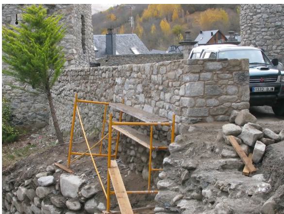
Figura 32. Dempús de consolidar era tor s'inicien es trabalhs ena muralha nòrd. Aguesta recupèrè ath torn de 50 cm. de mejana ena sua nautada, excèpte en sòn extrem oèst, a on puge 95 cm.

Fin finau s'a consolidat era bestor apareishuda ena cantoada nòrd-oèst dera fortalesa. Aguesta s'a lheuath mès d'un mètre en sòn extrem oèst.