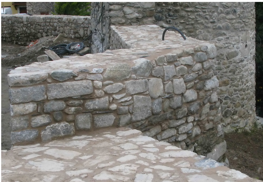
Figura 40 41, 42, 43. Estat final de la consolidació de les estructures castrals