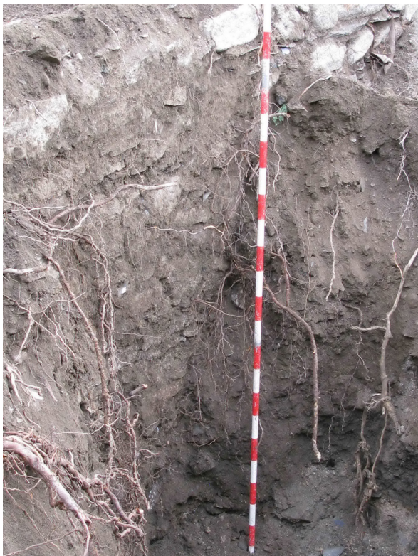
Figura 20. Atau madeish, e seguint delimitant e uedant er espaci plaçat pròp dera cabeçada dera glèisa, s'a localizat ua tor quarrada plaçada ena cantoada Nòrd-èst deth castèth.