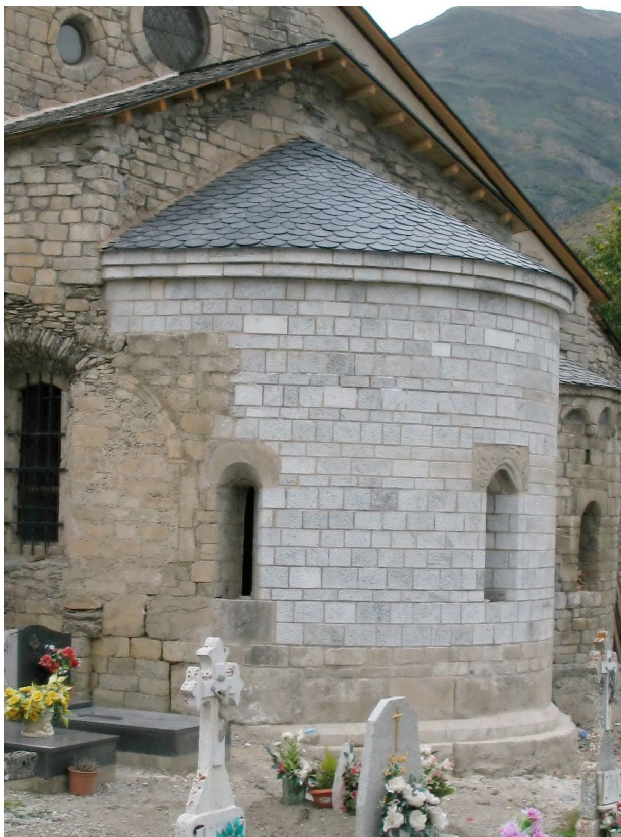
Figura 34. Aspecte finau dera absida un viatge finalizada era sua restauracion