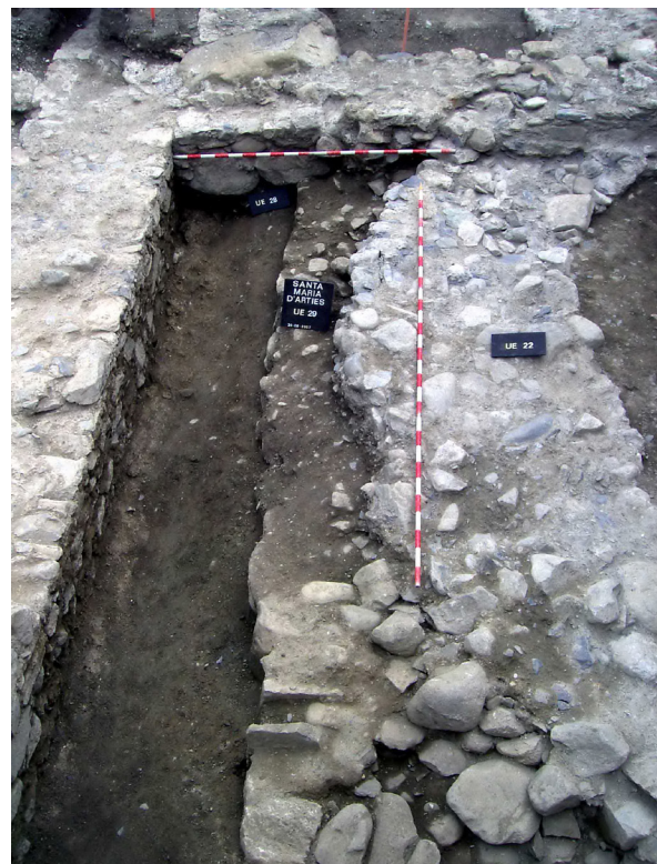
Figura 9. Per dejós dera fundamentacion dera glèisa preromanica mos apareishen es rèstes deth vielh castèth bastit en aguesta zòna ena nauta Edat Mieja.