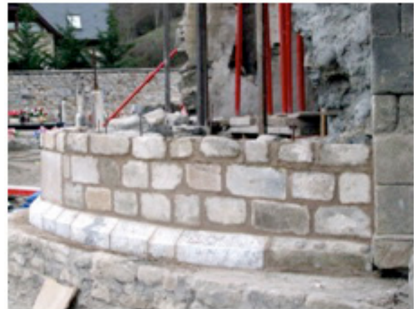
Figura 17. Es materiaus emplegadi an estat eth mortèr de caudia entàs juntes e plaçament des pèires nòbles e mortèr d'ormigon entath farciment interior. Inici dera collocacion des pèires originaus recuperades der esbaus des estructures de 1780

Atau madeish, e seguint delimitant e uedant er espaci plaçat apròp dera cabeçada dera glèi-