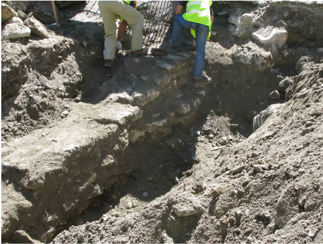
Figura 18. Desmontant parciaument es escales d'accès ara plaça pera sua banda èst, per dejós d'aguestes se confirmèc era aparicion dera muralha èst deth vielh recinte castrau.