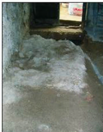
4.- Detall de la planta baixa un cop finalitzats els treballs d'extracció del paviment, amb l'estructura del circ