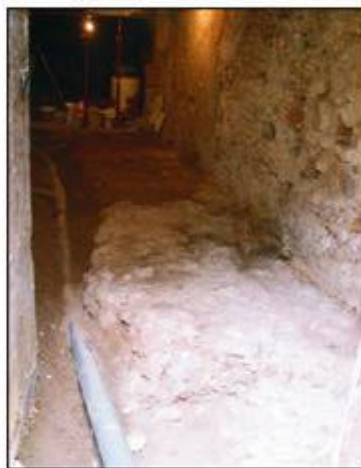
6.- Detall de la planta baixa un cop finalitzats els treballs d'extracció del paviment, amb l'estructura del circ