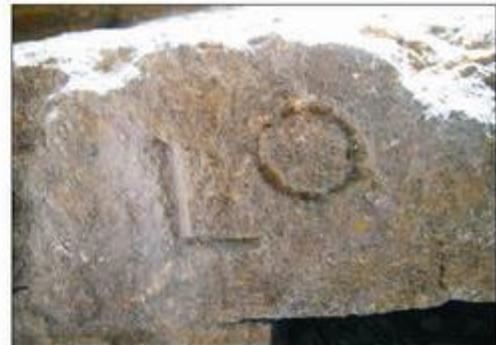
12.- Detall del carreu del podi amb la inscripció i la marca en la part interna