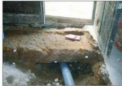
8.- Detall dels carreus del podi del circ documentats durant el seguiment