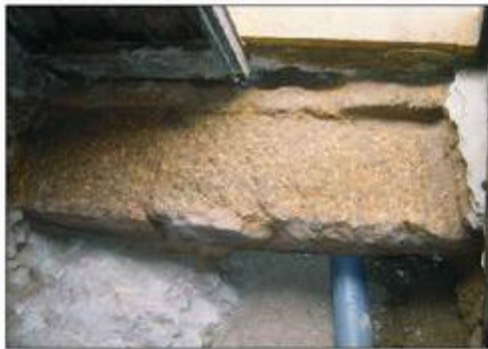
9.- Detall dels carreus del podi del circ documentats durant el seguiment