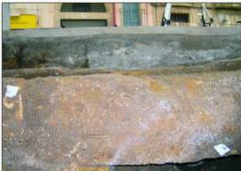
11.- Detall del carreu del podi amb la inscripció i la marca en la part interna