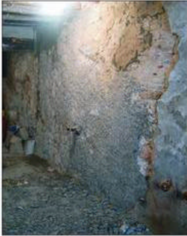
7.- Detall de la paret de l'immoble, un cop repicada per deixar a la vista l'estructura del circ, força refeta