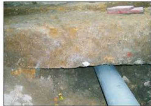
10.- Detall dels carreus del podi del circ documentats durant el seguiment