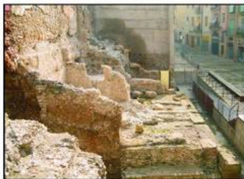
2.- Vista general del tram de podi del circ recuperat en la Pça. dels Sedassos, amb la casa núm. 28 al fons