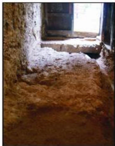
5.- Detall de la planta baixa un cop finalitzats els treballs d'extracció del paviment, amb l'estructura del circ