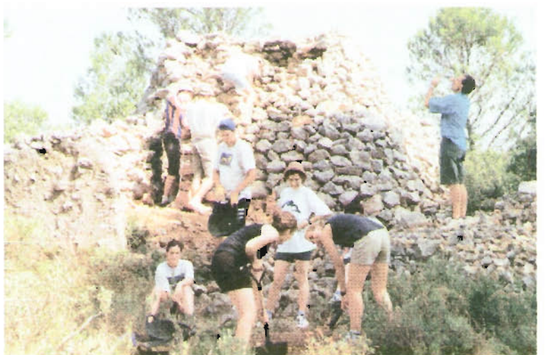
ANNEX 4 Restauració d'elements en perill