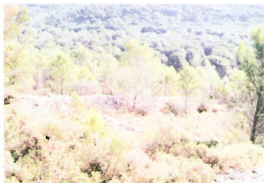
Restes d'antics correus de vinya del segle XIX a la Vall de les Dunes