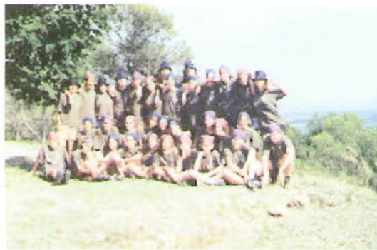
Un dels grups que ens han visitat: l'esplai del Clot de Barcelona

Aquest estiu han passat tres grups de treball de Bellvitge, Barcelona i Sant Vicenç dels Horts respectivament, 90 nois i noies i 12 monitors i monitores.