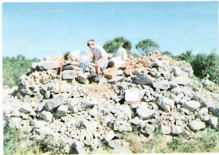
Treballs de consolidació d'una cabana

Un cop fet això, els nois i noies dels camps es dividien en grups de treball i realitzaven les següents tasques: