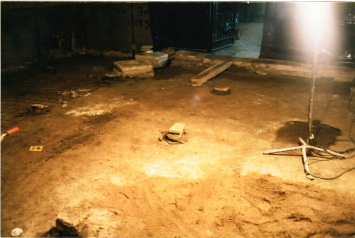
Foto 1: Part del sòl de la capella dels Dolors on podem apreciar, tot i que no massa clar, el nivell de terra que ha aparegut per sota del paviment i dues de les cinc peces arquitectòniques que hi ha a tocar la porta.