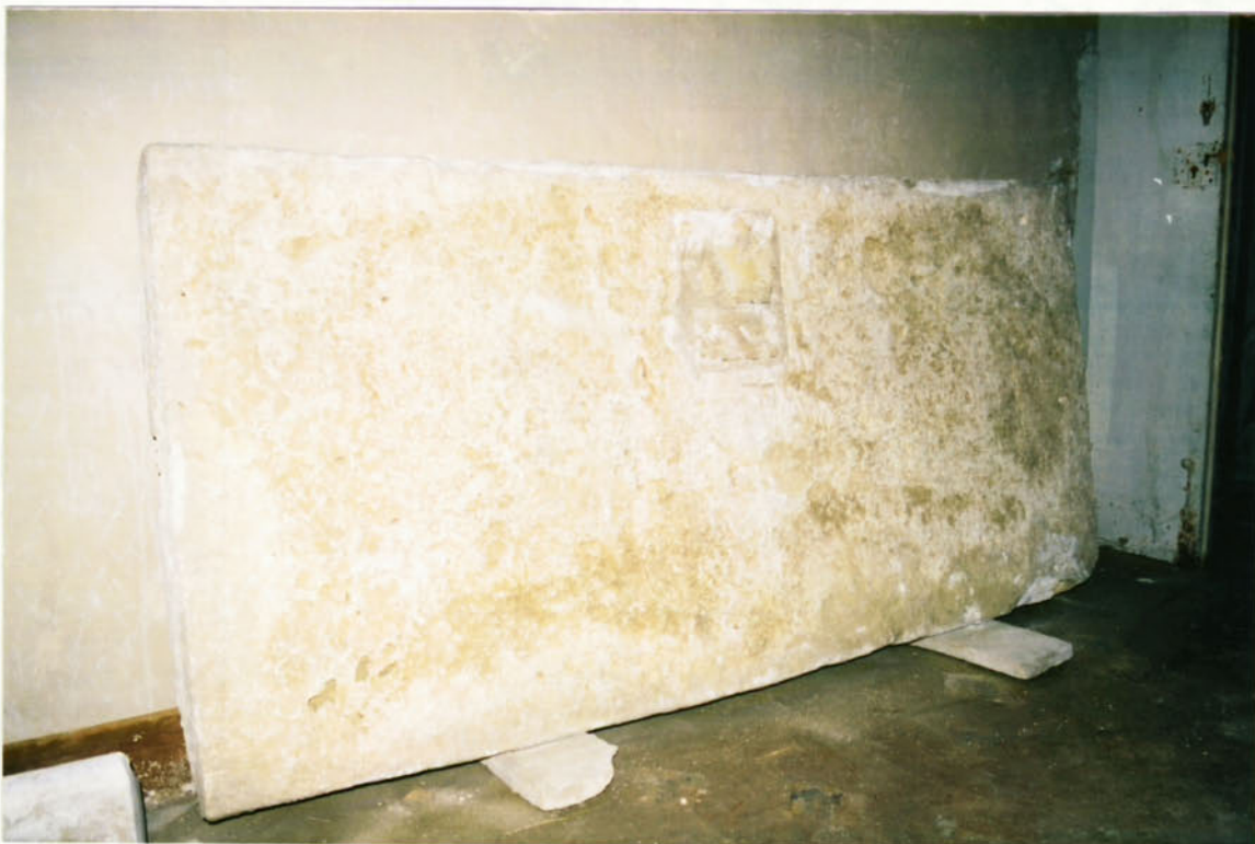
Foto 2: ara d'altar extreta del seu lloc original, per tornar-hi a ser col·locada una vegada estigui arreglat el paviment.