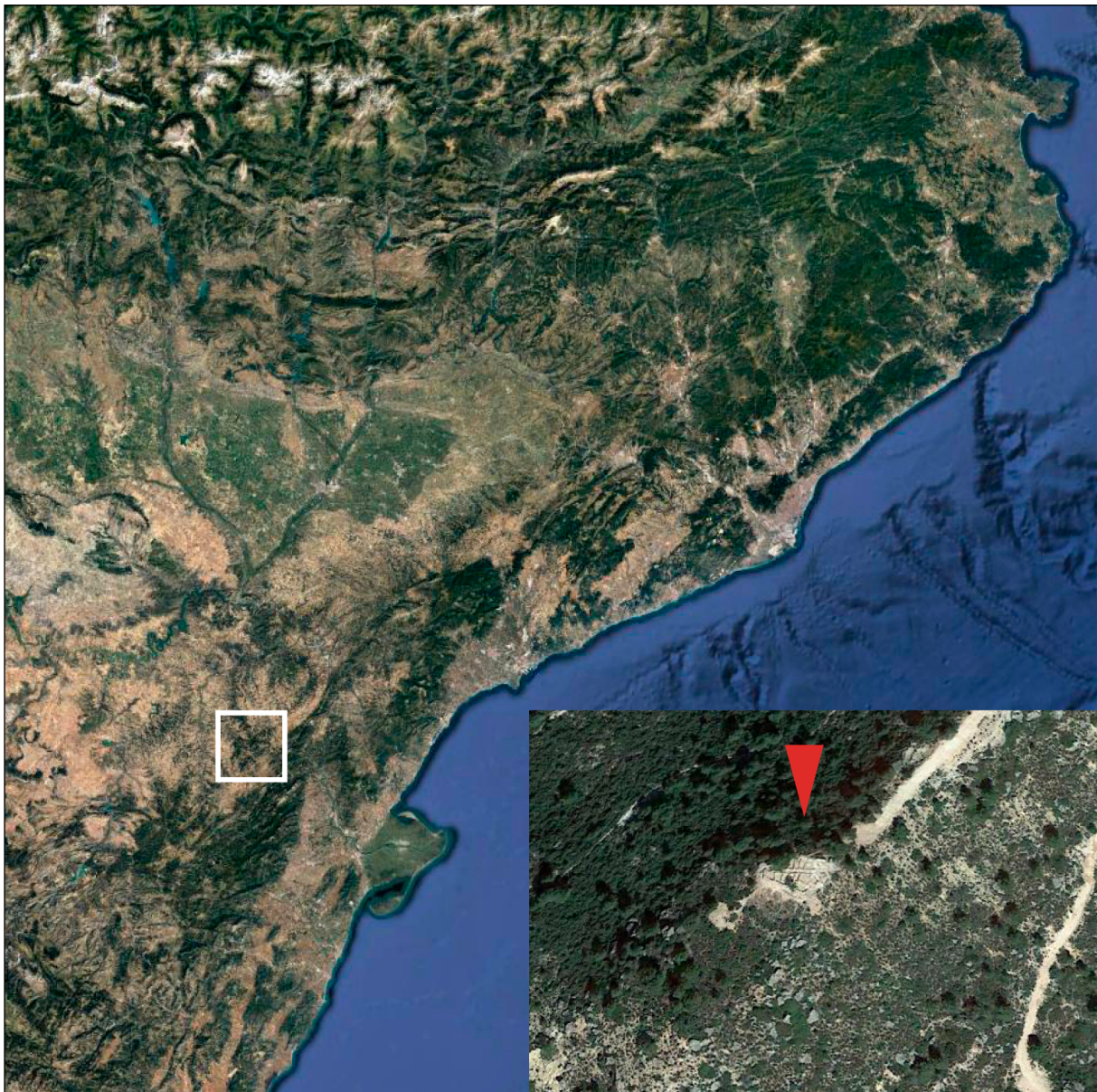
Figura 1. Situació de la Gessera de Caseres (Terra Alta)

diferents graus de resistència, amb cornises més o menys abruptes, amb capes de pedres calcàries sorrenques i gresos calcaris miocènics molt sòlids, mentre que les vessants tenen capes de margues menys compactes; en aquest sentit, a causa d'un procés continuat de fissuració i descomposició que provoca la separació i caiguda de grans blocs de pedra d'aquestes cornises, s'han generat també una sèrie de petites plataformes intermèdies, tan característiques d'aquesta regió. Aquest