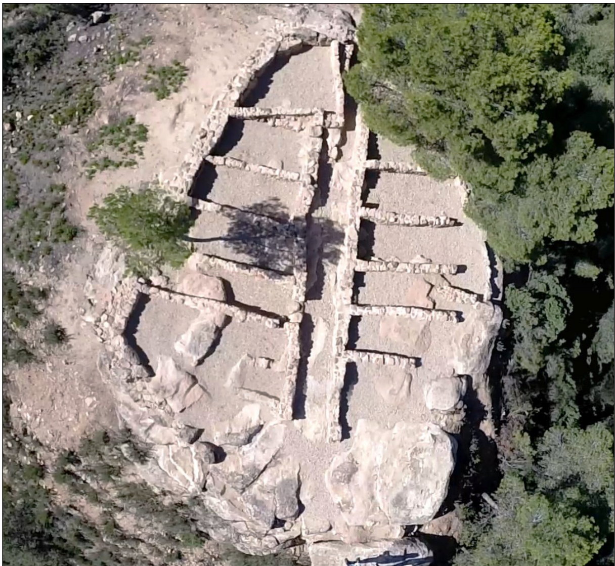
Figura 8. Vista aèria de la Gessera un cop finalitzats els treballs arqueològics i d'adequació

fet que no es tractés d'un poblat, com ja s'ha apuntat. En tercer lloc, cal destacar l'alta proporció de vernissos negres dipositats al MAC relatiu a les excavacions de 1914, en relació amb la quantitat total de material recuperada. En últim lloc, i com un complement dels treballs realitzats pel nostre equip al jaciment de la Gessera, es va elaborar un estudi arqueoastronòmic d'orientació que ens ha proporcionat uns resultats força interessants que, d'altra banda, acabarien de reforçar aquesta hipòtesi de la Gessera com a edifici de culte. Segons aquest estudi, els dies equinoccials, mentre l'edifici va funcionar, la llum solar penetrava per l'accés oriental del recinte, avançant per tot