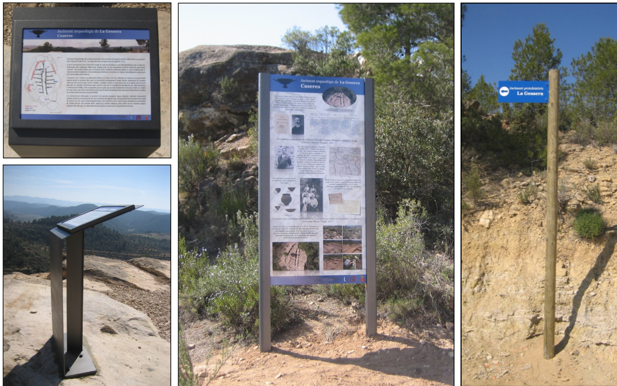
Figura 7. Cartells de la Gessera. A l'esquerra, faristol d'explicació del jaciment; al mig, plafó amb explicació de la història de les intervencions a la Gessera; a la dreta, cartell de senyalització del camí

bilitat d'algunes de les estructures i evitar-ne nous despreniments, es va construir una petita base de morter de calç, utilitzant la tècnica de l'encofrat amb taulons de fusta, intentant imitar la mateixa roca calcària i creant bases més estables i sòlides en aquells punts on es va considerar oportú.