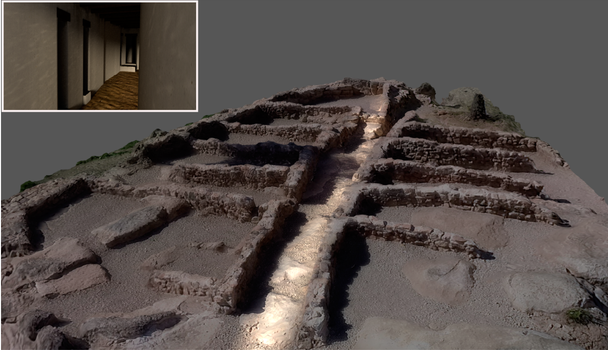
Figura 9. Simulació de l'entrada de llum a l'edifici de la Gessera, durant els equinoccis, fins arribar i il·luminar el recinte A11

el passadís central mentre el sol s'elevava, fins anar a morir al fons de l'habitació A11 (Pérez [et al.] 2015), just a la cantonada que ressalta en aquest àmbit perquè trenca l'ordre de circulació pel passadís central. Cal afegir que es tracta d'un recinte aparentment creat ad hoc, ja que no encaixa amb la resta de l'urbanisme ni pel que fa a dimensions ni a posicionament i que, si es tractava d'un espai cultural, podria haver tingut la funció de cel·la.