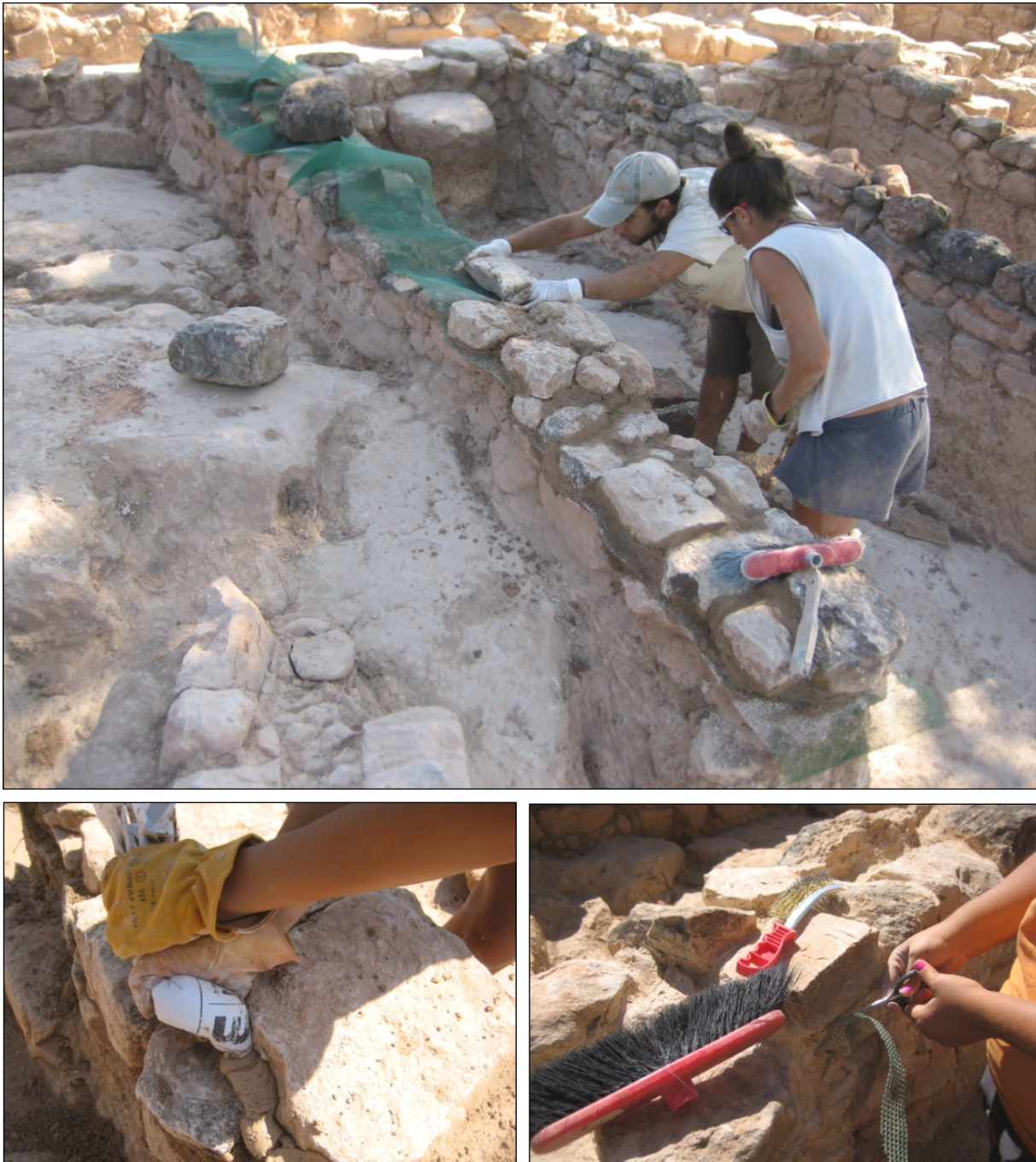
Figura 5. Detall dels treballs de consolidació de les estructures conservades

la seva intervenció i que estava dipositat al Museu Arqueològic de Catalunya. Es van identificar alguns d'aquests accessos, fet que en va possibilitar la restitució. En els casos en què el material fotogràfic antic i la planimetria no eren prou clars o generaven dubtes, es va optar per restituir el mur de manera contínua, però a una cota més baixa, per evitar possi-