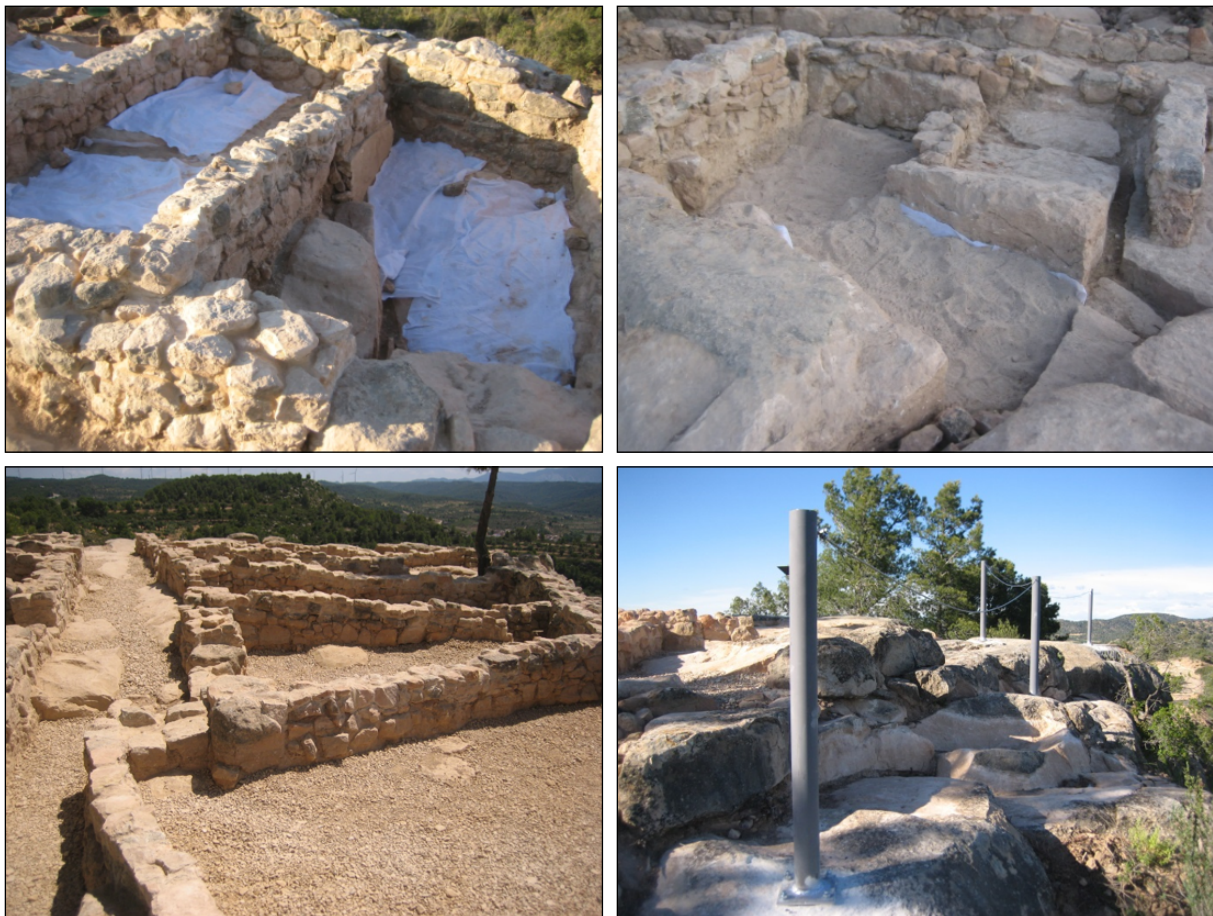
Figura 6. Vista del procés de museïtzació. Cobriment del terreny natural amb geotèxtil, després amb sorra i acabat amb grava. Detall de la protecció metàl·lica

aspecte molt semblant al que devia tenir originalment. També es va optar, tant en el tram sud com en el llenç oest de la muralla, per tal d'assegurar i garantir l'estabilitat de l'estructura i evitar futurs despreniments, per injectar morter de calç en tots aquells punts que presentaven esquerdes profundes. L'únic tram de parament que es va restituir de nou sense tenir evidències arqueològiques va ser un petit llenç de poc més de 2 m de longitud corresponent al flanc septentrional de la muralla; aquesta decisió va estar motivada per tal de facilitar les posteriors tasques de museïtzació d'aquest sector del jaciment, partint tant de l'orientació com de l'amplada de la mateixa muralla. Al sector est de l'assentament, la zona més malmesa i erosionada, es va decidir no restituir cap dels murs davant la total absència d'aquests. Fins i tot, en alguns casos, per garantir l'esta-