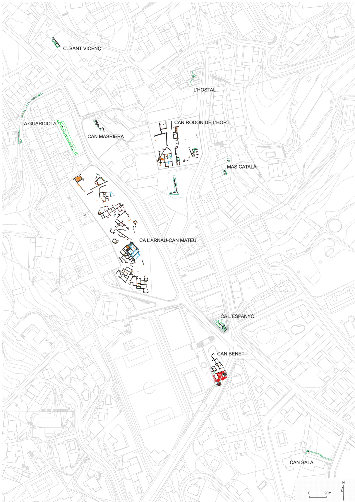
Figura 8. Localització de les restes arqueològiques d'Ilturo sobre la base topogràfica, de color gris