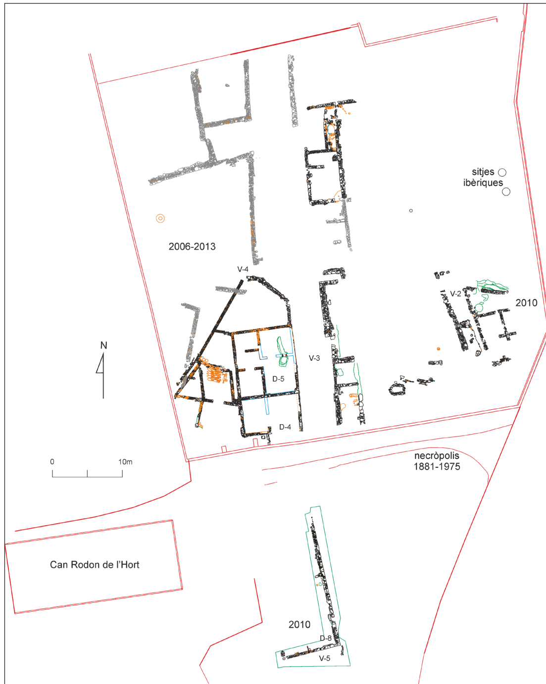
Figura 2. Can Rodon de l'Hort. Planta de les intervencions 2006-2013. Les construccions d'època altoimperial, dibuixades de color gris

blicana amb unes construccions de característiques similars a les documentades els anys 1997 i 1998 al sector de Ca l'Arnau i Can Mateu. Però, a més, en aquest cas, aquestes construccions estaven estructurades a partir d'un carrer (V-3) de cinc metres d'amplada, que anava en sentit nord-sud, situat aproximadament al centre del