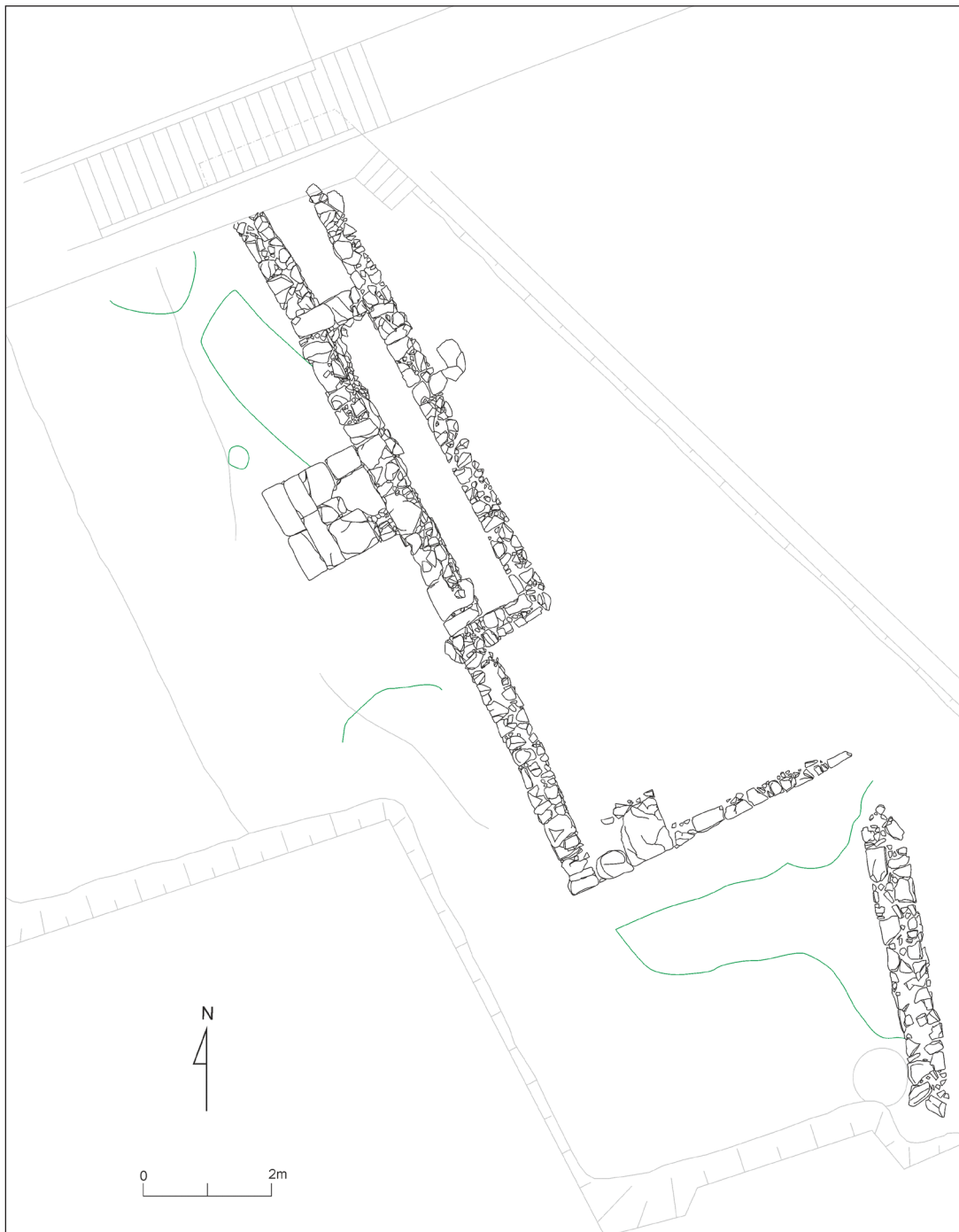
Figura 1. Planta general de la intervenció a Can Masriera, 2003

perfums de ceràmica de gran format. Aquest nivell d'enrunament presenta una datació de 100-80 aC (López Mullor, Martín Menéndez, 2010).