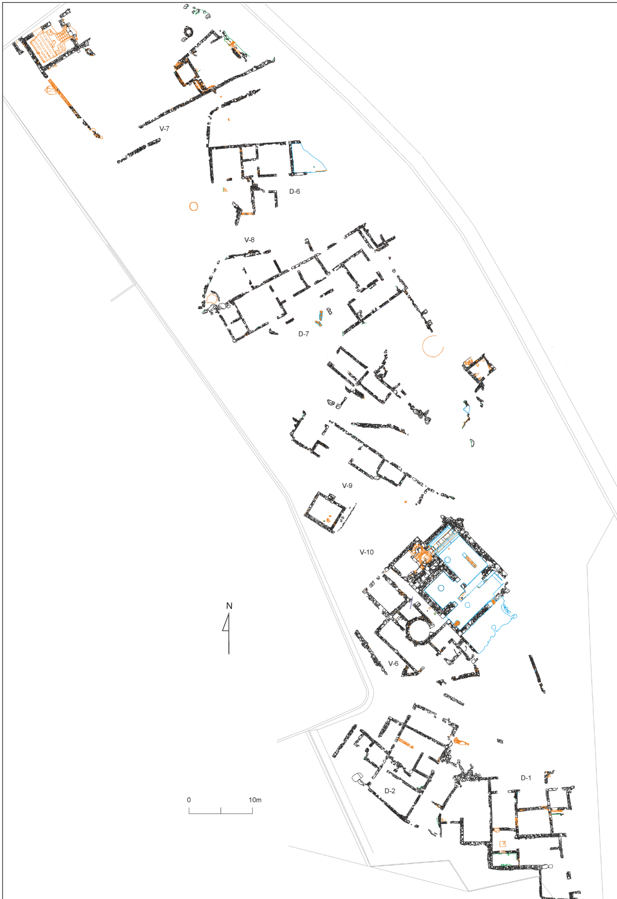
Figura 3. Ca l'Arnau - Can Mateu. Planta general de les intervencions 1997-2014