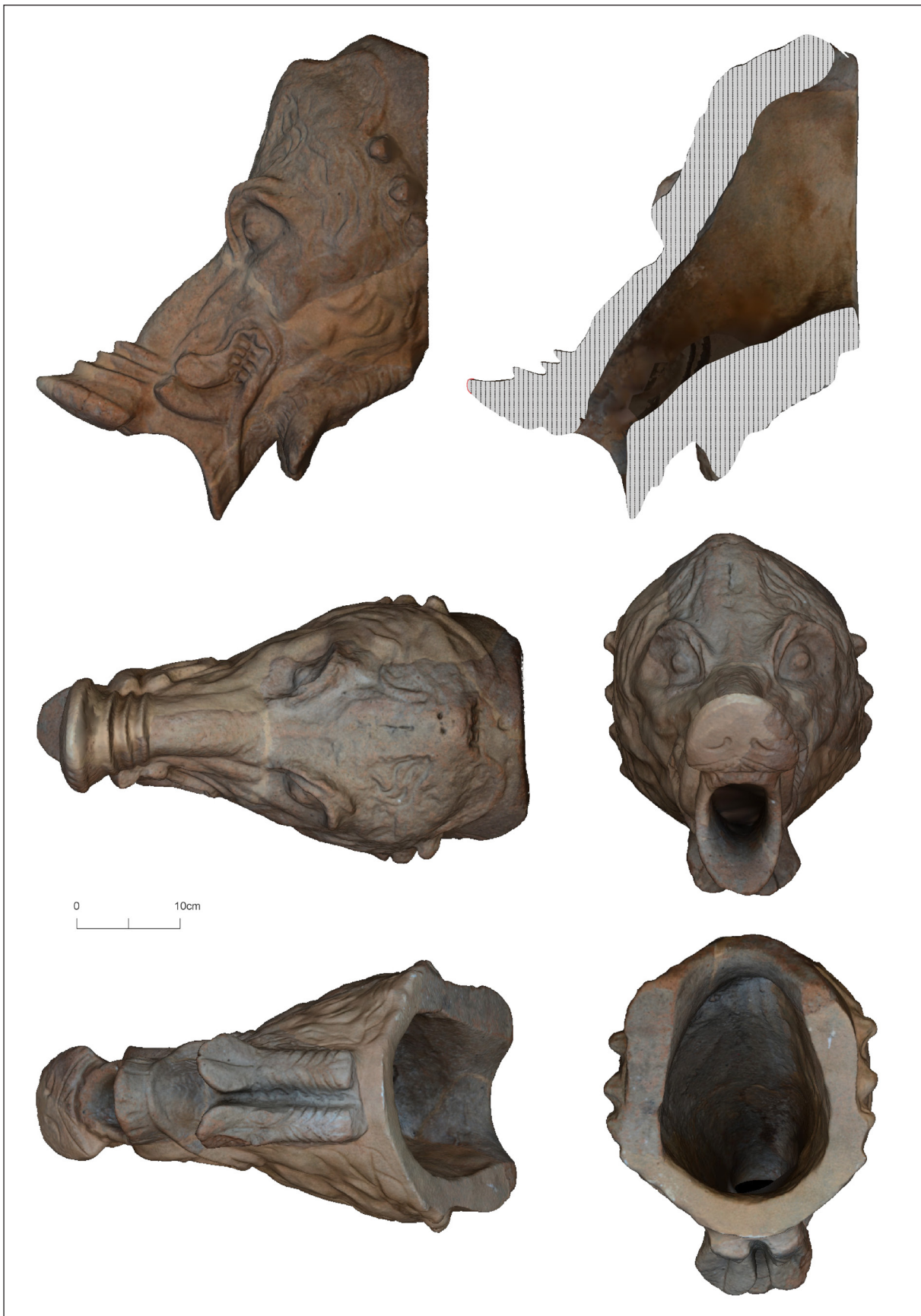
Figura 5. Ca l'Arnau - Can Mateu. Gàrgola itàlica en forma de porc senglar