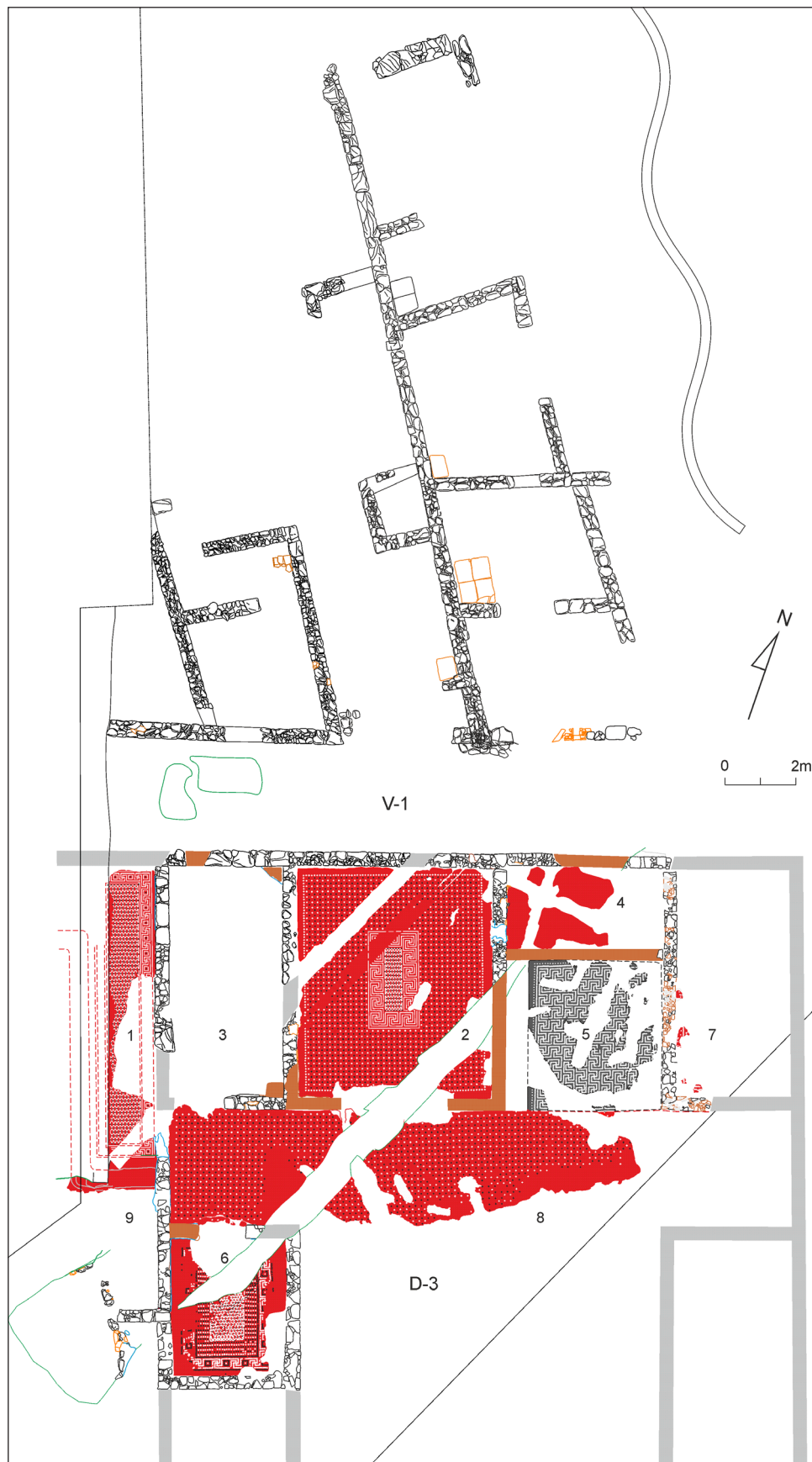
Figura 7. Can Benet. Planta general de les intervencions 1999-2013. Els murs de traçat hipotètic, dibuixats de color gris