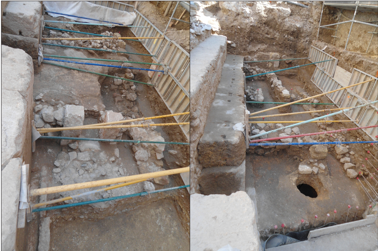
Figura 4. A l'esquerra, detall de la pastera documentada a la zona central del fossat, amb el receptacle inferior en primer terme (inferior). A la dreta, detall de les estructures d'època medieval documentades a l'extrem oriental del fossat, amb la sitja en primer terme

en època medieval. Es tracta de la sitja 26 documentada en aquest sector (fig. 4), que es trobaria formant part d'un seguit d'àmbits (V i VI) també adossats al podi del circ i definits per murs de maçoneria lligada amb fang, que a l'extrem oriental 27 reaprofitava el mur d'argamassa visigòtic. Aquests murs es conserven de manera molt