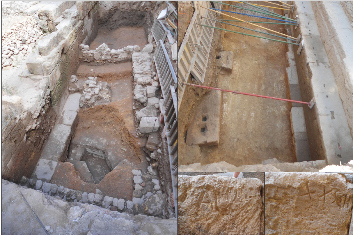
Figura 3. Detall dels nivells de l'arena del circ. A l'esquerra es poden veure la canalització que aprofita la porta del podi i la superposició de murs tardoantics (inferior) i medievals (superior i dreta). A la dreta són visibles els carreus relacionats amb la maquinària de construcció del circ. A la part inferior dreta, les inscripcions de la banqueta del podi

una capa d'uns 30 cm de potència que barreja terra argilosa amb restes de tapàs i de repicatge de carreus, pedres petites i nòduls de calç, de textura granulosa compacta. Finalment, aquest estrat es va rematar amb una capa de color vermell intens, formada per sorres amb textura argilosa molt neta, que tenia un gruix d'almenys 40 cm i s'estenia per sobre de la banqueta de fonamentació del podi fins a 32 cm al punt on es conserva millor. De fet, aquesta seqüència coincideix amb la documentada al tram d'arena i al podi de la plaça dels Sedassos 15 (Díaz, Macias, 1999), on els nivells de preparació de la pista, els mateixos que hem documentat ara, es rematen amb un nivell