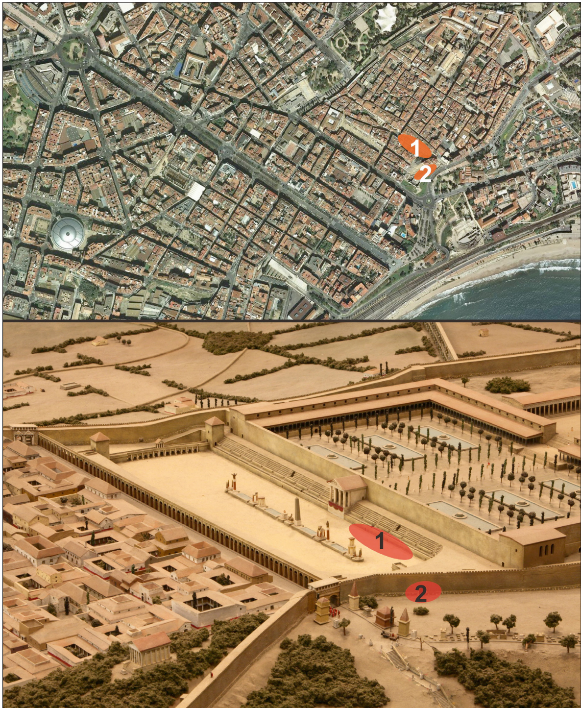
Figura 1. Situació de les excavacions en el context del circ romà de Tarragona. 1: C/ Trinquet Vell, 2: Porta Triumphalis

de mitjana, que ha permès reintegrar aquesta part del monument, ahora que dignificar-lo en el marc de l'arranjament del carrer.