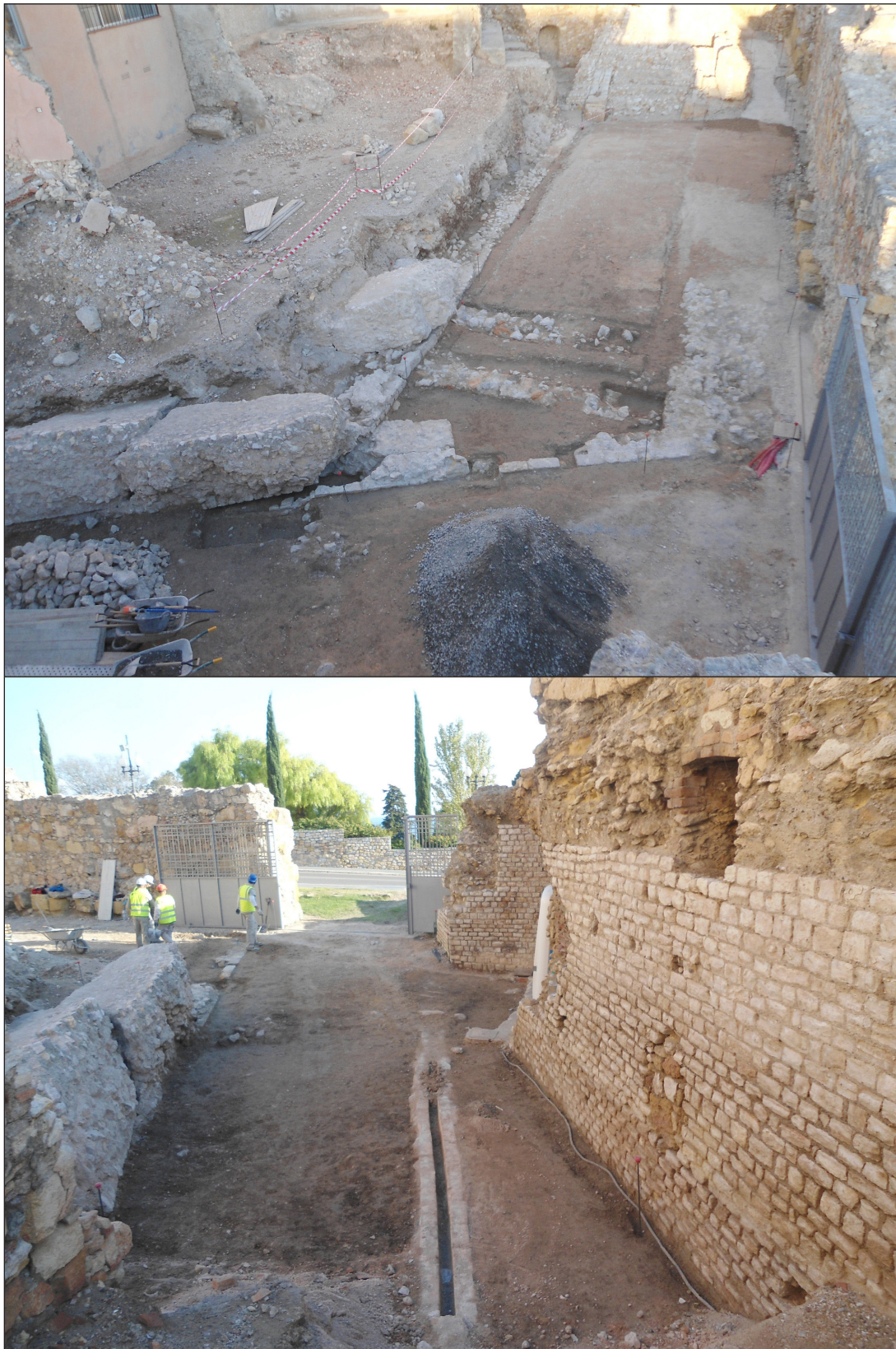
Figura 6. Superior: vista de les restes conservades de la volta al nord de la porta triumphalis, en què es pot observar la porta que connectava amb el passadís de la porta triumphalis. Més amunt es tracen els murs paral·lels amb portes en ziga-zaga d'època moderna. Inferior: vista de la porta triumphalis des de l'arena amb la muralla tardorepublicana al fons. A l'esquerra es pot veure el seu límit septentrional amb els efectes de la voladura del 1813