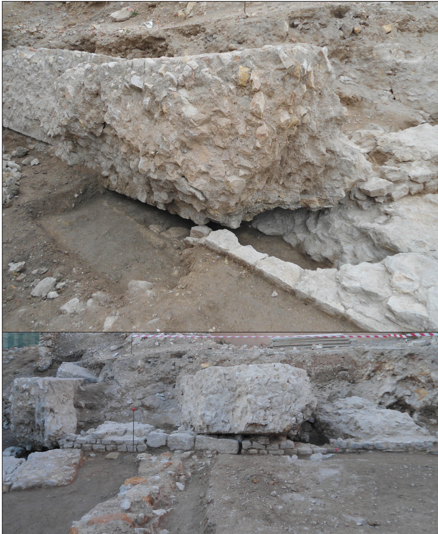
Figura 7. Superior: Detall del mur d'opus vittatum que delimitava la porta triumphalis pel costat septentrional, caigut pels efectes de la voladura del 1813 sobre la cara interna, que recolza en el fonament conservat in situ. Inferior: vista frontal de la volta radial localitzada al nord de la porta triumphalis, en què es pot observar la construcció en opus vittatum i la porta d'accés a l'interior (paredada en una fase posterior). Damunt de les restes hi descansa un gran bloc d'opus caementicium originari de la paret lateral de la volta, que es troba en posició secundària com a resultat de la voladura del 1813

A banda dels treballs romans en alçat per definir formalment el circ, s'han pogut constatar treballs de regularització de la roca natural per tal d'assolir una plataforma constructiva, formada per un farciment de terra compactada sobre el qual es creà un sòl de treball. 40 És en el paquet regularitzador on s'obriren les trinxeres constructives per a les fonamentacions i per a les primers filades d' opus vittatum descrites, i serà per sobre del sòl de treball esmentat, el qual es lliurava als trams inferiors de les estructures ja construïdes, que es disposà un for-