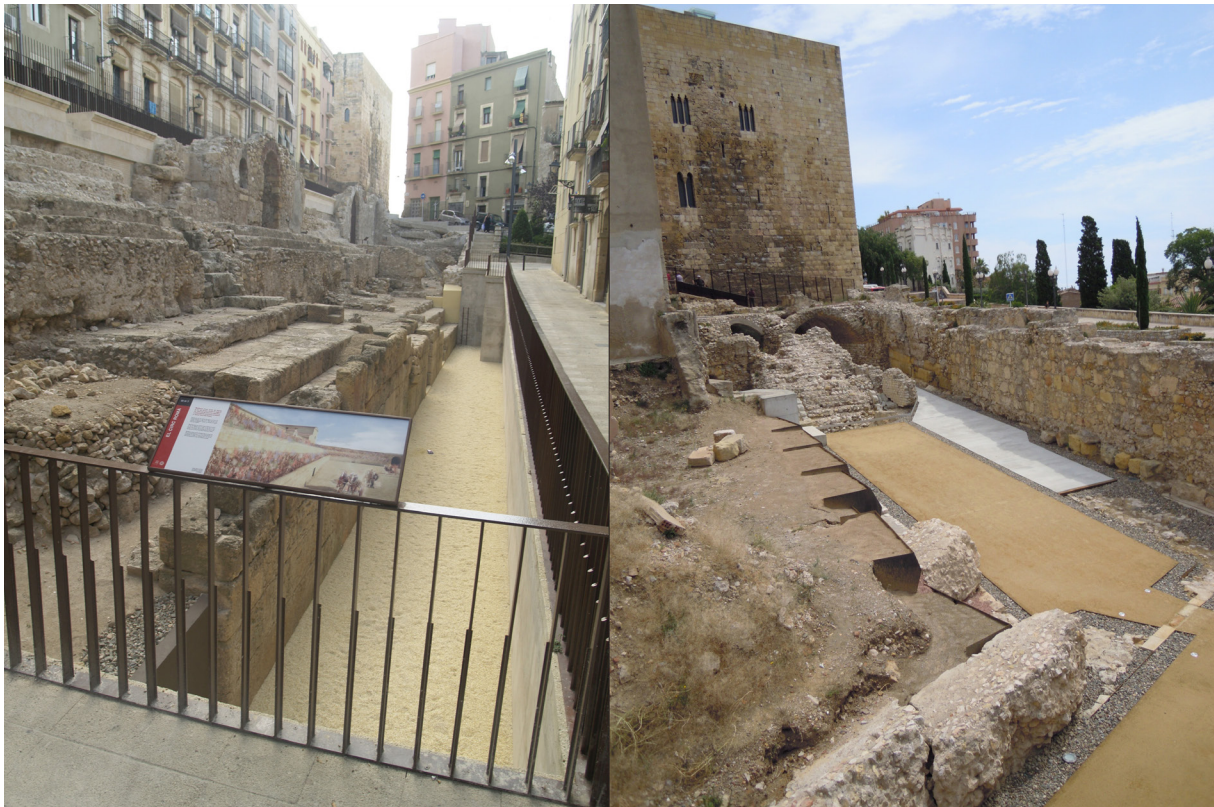
Figura 8. Detall del resultat final de les intervencions als sectors del circ del Trinquet Vell (esquerra) i de la Porta Triumphalis (dreta)