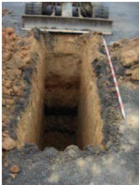
FOTO 3 .Tall estratigràfic del sondeig 5 (UE 01 02-03 -04-06-07).