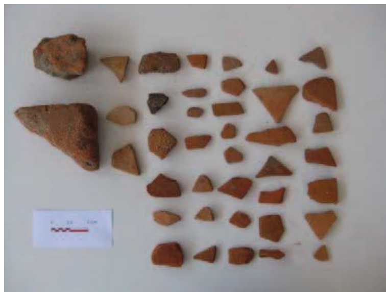
FOTO 6 .Fotografia de les restes localitzades en l'estrat UE 06.