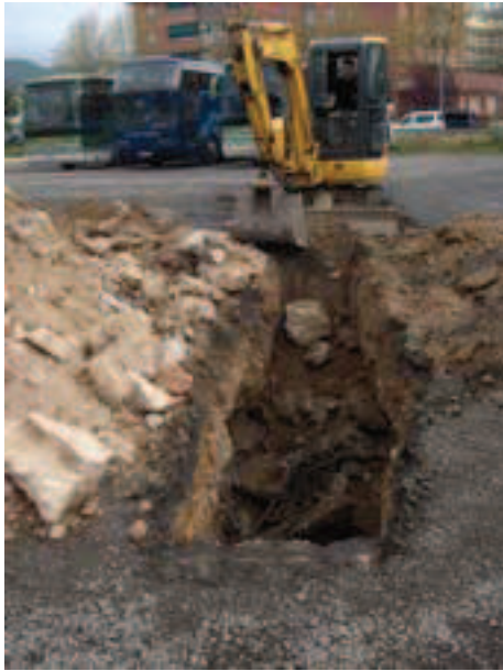
FOTO 1. Realització del sondeig 3.