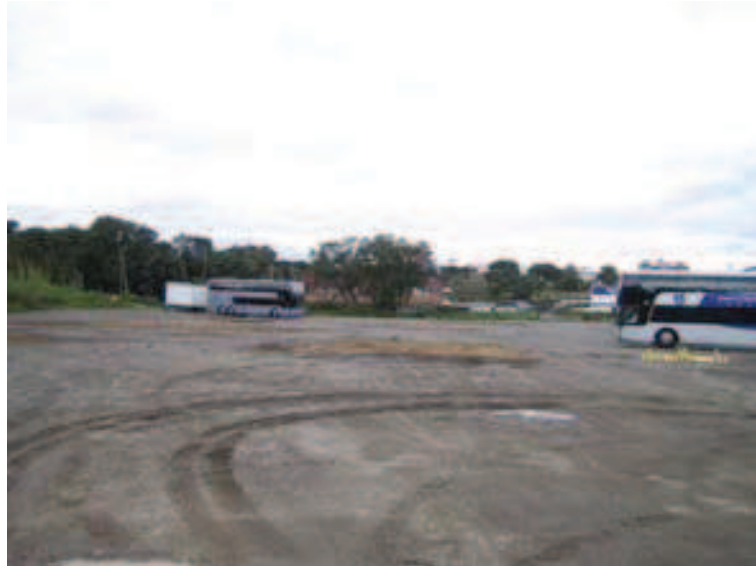
FOTO 5. Vista general un cop finalitzada la intervenció arqueològica.