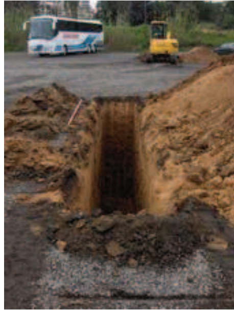
FOTO 2. Vista del sondeig 4.