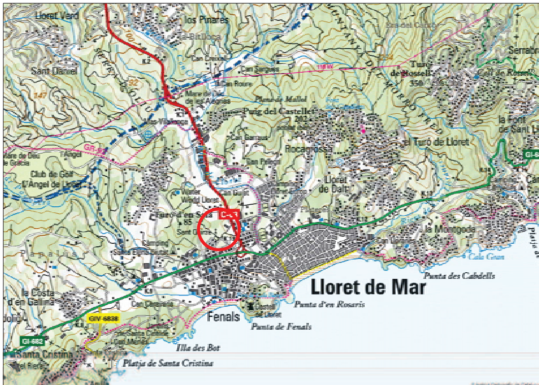
Mapa topogràfic Escala 1:50.000