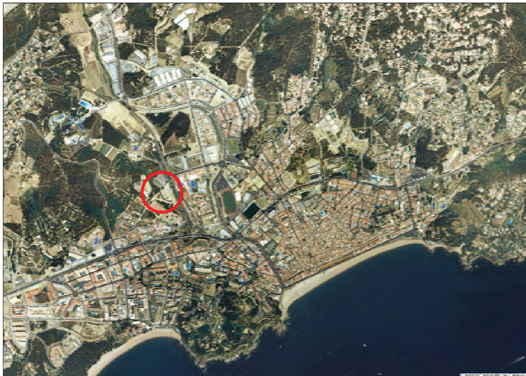
Ortofotomatge Escala 1:25.000