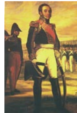
Imatge del mariscal francès Louis Gabriel Suchet.

A les primeries de setembre d'aquell any (1810), les posicions franceses estaven establertes de la següent manera: el quarter general francès a les ordres de Suchet a Móra d'Ebre; una divisió napolitana a Garcia; les tropes del general Habert a Tivissa i una força de reserva als Masos de Móra (Móra la Nova). Aleshores, el governador de Tortosa reconeixia que tots els pobles del corregiment -excepte el Perelló i la plaça forta de Tortosa- estaven ocupats o sota control francès.