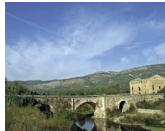
Pont de Goi: vista general del pont i de l'antic molí fariner.