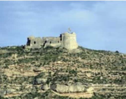
Castell de Flix.

La importància geoestratègica de Móra d'Ebre en els plans francesos de domini de tota l'àrea de l'Ebre es pot observar en el fet que allí es trobava el centre d'operacions del 3r. exèrcit francès els mesos previs a l'atac i ocupació de la cobejada plaça de Tortosa i era un nus bàsic en les comunicacions amb l'altra riba. Per tal de reforçar aquesta posició i, a la vegada, controlar tan la navegació com el pas del riu es van fer baixar, des de Mequinensa, dos ponts volants que van situar, l'un a Móra d'Ebre i l'altre a Xerta, facilitant així una ràpida comunicació amb l'esquerra de l'Ebre. El baró de Rogniac rebé l'ordre de defensar aquests passos amb la construcció d'un cap de pont a cadascuna.