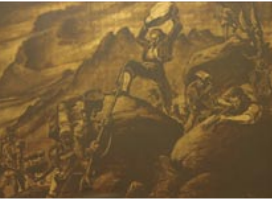
4. Batalla del Bruc , pintura de gran dimensions situada a l'escala de l'Ajuntament de Manresa de l'autor Pujol Vilajosana, l'any 1946

qual es conserva una placa commemorativa instal·lada arran del centenari dels fets. Dins de l'edifici, a les escales es pot veure la pintura de grans dimensions sobre les batalles del Bruc pintada per Pujol Vilajosana el 1946 i al vestíbul d'Alcaldia hi destaquen tres pintures més: una interpretació de la crema del paper segellat feta per Francesc Cuixart el 1897 i el retrat dels dos ciutadans il·lustres que van destacar en la contesa: el canonge Montanyà i Maurici Carrió.