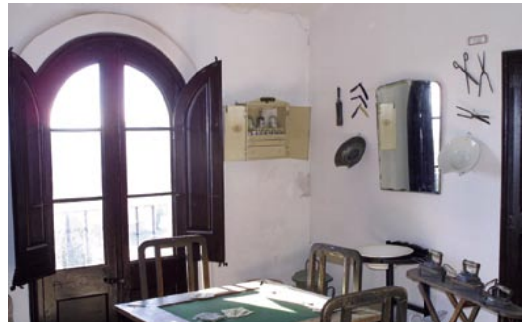
Museu local de Collbató, que conserva diversos elements provinents de les batalles del Bruc.

Visita guiada als elements de la Guerra del Francès conservats al museu local. Comentaris sobre l'armament trobat, els uniformes i l'activitat militar que se'n pot desprendre.