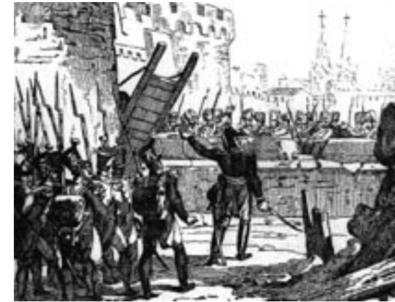
Capitulació de la guarnició de Tortosa. Gravet francès de Laguillermie i Rambo. Fons: Biblioteca Marcel·lí Domingo de Tortosa.

El darrer punt a visitar és el fort d'Orleans, bastit al segle XVIII i enclavament avançat de la defensa de la ciutat, i tota la zona adjacent, indret on majoritàriament es va instal·lar l'artilleria de setge francesa i on es va iniciar l'obertura de trinxeres –paral·leles en terminologia militar– d'aproximació a la plaça forta. Des d'aquí es pot observar la zona del Temple, sector per on els assetjadors havien decidit atacar i en el qual havien començat a minar i a obrir-hi bretxa amb el foc artiller i on tenien decidit fer l'assalt que finalment es van estalviar per la sobtada capitulació de la guarnició i de la ciutat.