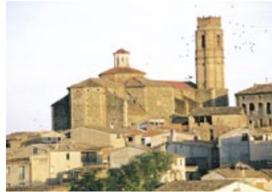
Gratallops. Imatge de l'església.

dels sometents de la comarca i de tropes regulars, el 29 d'agost els soldats francesos van ser expulsats de la localitat i tornaren a Móra.