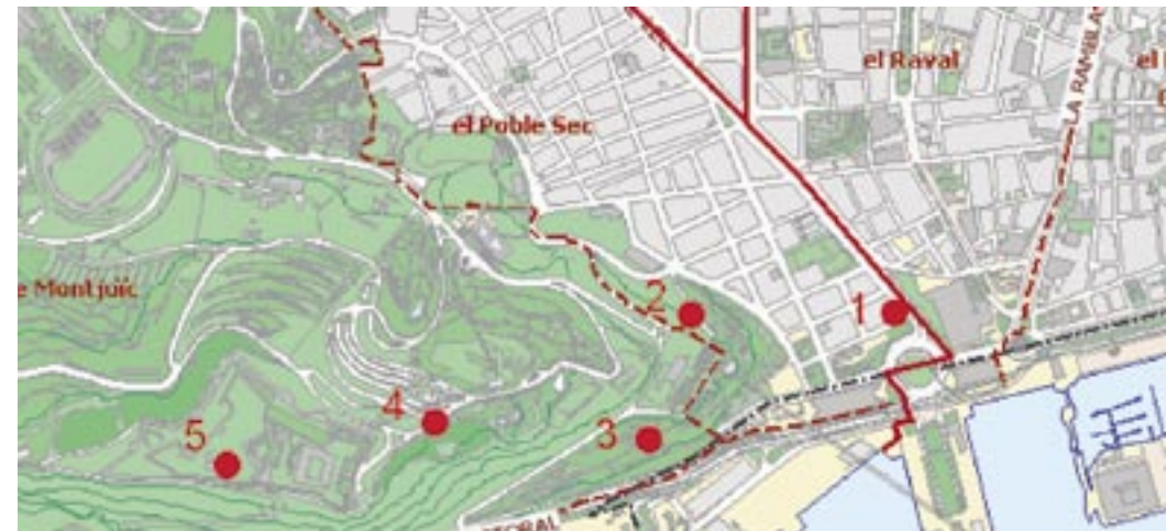
Situació dels llocs de l'itinerari