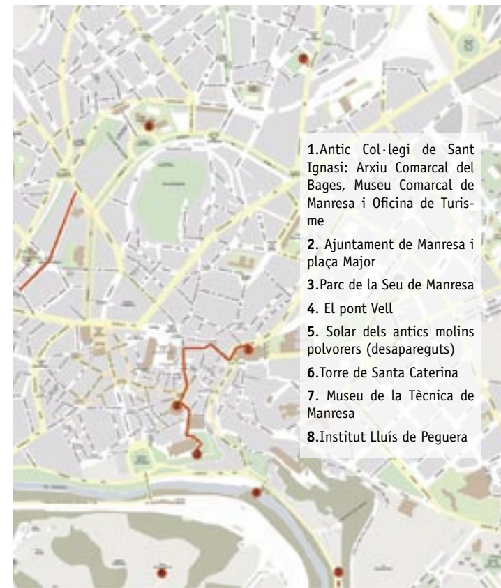
Plànol del recorregut

3. A la plaça Major, centre polític i econòmic de la ciutat i escenari de la crema del paper segellat el dia 2 de juny de 1808, es visita l'Ajuntament, a la paret exterior del