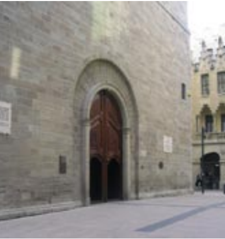
Vista de la façana de l'església de Santa Maria d'Igualada amb les dues plaques commemoratives de la Guerra del Francès.