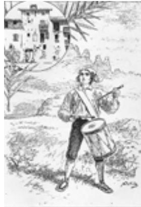
Dibuix d'Anton Utrillo: Font: La tradició catalana , núm 1 (1893). Lo Timbaler del Bruch

Una vegada deixades enrere les últimes cases de la vila, el camí s'endinsa en els boscos i el territori del Parc Natural de la Muntanya de Montserrat, on una rica flora i fauna envoltarà el caminant. D'altra banda, aquest territori està ple de llegendes relacionades amb les roques properes i amb fets històrics succeïts en els últims cinc-cents anys i més.