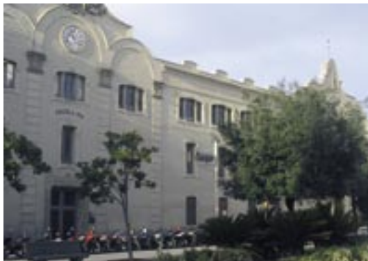
Edifici de l'Escola Pia. Plaça de Castells.

Aquest col·legi ocupa actualment l'antic convent dels agustins fundat l'any 1393, destruït durant la Guerra de Joan II i posteriorment reconstruït i ampliat el 1479. Es pot destacar el claustre reedificat el 1495. L'any 1820, a causa del Decret d'extinció de les ordes monàstiques, els agustins abandonaren el convent, al qual retornaren el 1823. A causa de la desamortització del 1835 es veieren obligats a marxar d'Igualada de nou i ja no hi retornarien. El 1858 el convent passà a mans dels escolapis, els quals van establir-hi un col·legi de segona ensenyança.