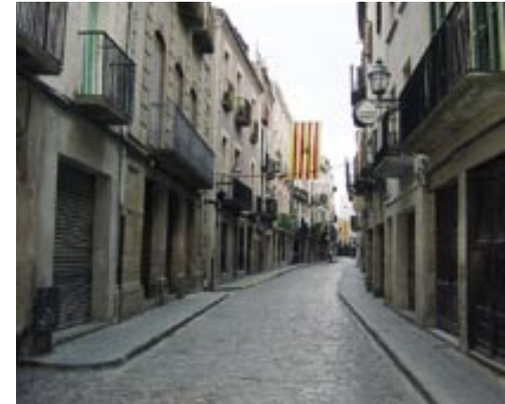
Carrer Major.

Tot i així podem dir que la Universitat va ser respectada en comparació a la resta de la ciutat.