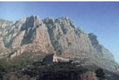
Muntanya de Montserrat: zona de la Salut i les coves del Salnitre, d'on el guerriller Mansuet va foragitar un escamot de soldats francesos.

ell sol va foragitar els soldats que el perseguien amb un truc similar al del Timbaler del Bruc. La figura del Mansuet, convertit en heroi popular, va alimentar durant el segle XIX moltes novel·les i fulletons que rememoraven la victòria del Bruc. Al segle XIX, els escriptors Ferran Patxot, Sebastià Puig-Bonet i J. Abril van escriure i estrenar sengles obres teatrals que recreaven la llegenda del bandoler - guerriller, cosa que reflecteix el grau de popularitat del personatge. Abans del centenari de les batalles, el Mansuet havia assolit una categoria d'heroi nacional català equiparable a la del Timbaler del Bruc. Després, per diverses circumstàncies polítiques, el Timbaler va desplaçar el Mansuet en la imatge de les batalles del Bruc i el personatge collbatoní va quedar arraconat.