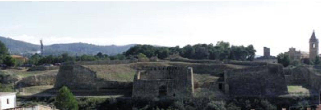
Vista de la fortificació moderna d'Orleans des del Turó del Sitjar.

Incidint en esta situació, i precisament quan ja no hi havia res a fer per Tortosa, encara sortia al Diario de Valencia un avís oficial, de data 8 de gener, que s'encapçalava amb un paràgraf que si no es tingués en compte el dramatisme inherent a la guerra semblaria, donades les circumstàncies del moment, fins i tot una ironia.