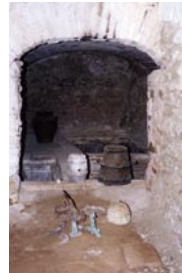
Bodega típica del Priorat. Es pot apreciar una bala de canó de la Guerra del Francès.

Pel què fa als combats, van passar a ser desfavorables als francesos a partir de mitjan 1812 i sobretot l'any 1813. Al Priorat l'última incursió de les seves tropes i, per tant, els últims saquejos, sembla que es produïren el juliol de 1813.