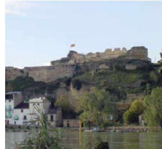
Castell de Móra d'Ebre.

Quan es parla de la importància de Móra d'Ebre a la Guerra del Francès sempre s'esmenta l'etapa de 1810, quan aquesta vila es convertí en quarter general de l'exèrcit francès, però Móra d'Ebre esdevingué protagonista en una altra etapa històrica d'aquella guerra. Aquesta començà a l'entorn del mes de juliol de 1813, tot just iniciada la retirada francesa dels pobles de l'Ebre -excepte de la plaça de Tortosa- i es perllongà al llarg de gairebé un any. Durant aquells darrers mesos de guerra, s'instal·laren als pobles ebrencs els primers ajuntaments constitucionals i va ser llavors -mentre Tortosa continuava sota el control de les tropes franceses- quan Móra d'Ebre es convertí en el centre administratiu i militar del territori lliure.