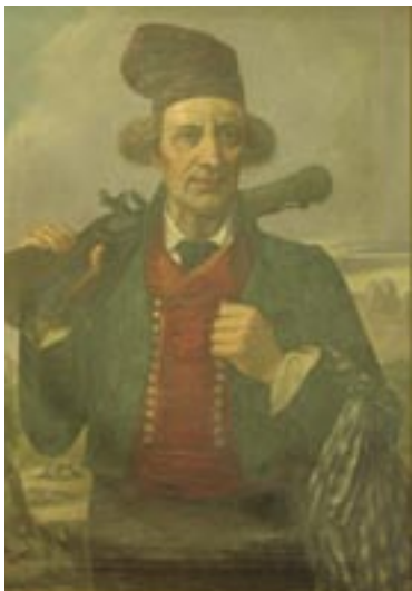
5. Retrat de Maurici Carrió i Serracanta de la Galeria de Manresans Il·lustres de l'Ajuntament de Manresa