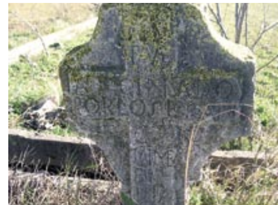
Creu del terme.

En general, Ulldecona com a poble no va causar grans problemes a les tropes napoleòniques, bàsicament perquè era d'un control relativament fàcil. Això no vol dir que a nivell individual i certs sectors del poble no portessen una política activa de resistència.