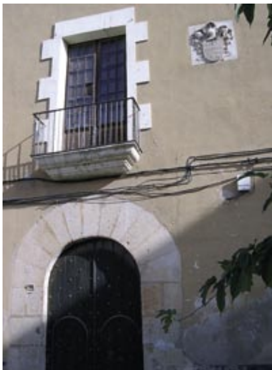
Casa Montagut, de Móra d'Ebre, que serví d'allotjament a l'oficialitat de l'exèrcit francès.

Un itinerari que pretengui explicar la irrupció francesa al territori i la lluita pel control del riu hauria d'estendre's des de Flix fins a Tortosa. Així doncs, tot i que l'activitat que drem a terme en el marc del Bicentenari de la Guerra del Francès, consistirà en una visita al nucli urbà de Móra d'Ebre (casa Montagut i Castell) i una posterior baixada en barca pel riu fins a Miravet, en aquest document us presentem els moments més rellevants del conflicte en forma de recorregut, el qual d'alguna manera reproduceix l'avanç de l'exèrcit napoleònic sobre Tortosa.