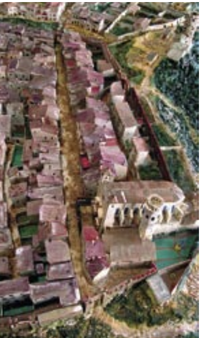
Maqueta de l'Arboç al segle XVIII

Es comença a prop de la Biblioteca Municipal, al final del carrer de l'Hospital, on s'acabava el nucli urbà de la vila i sortien els camins de Montblanc, de Saifores o de Valls, i del Priorat (Banyeres del Penedès) o de Llorenç. Tant si s'agafava l'un com l'altre es passava pel Coll de Santa Cristina per a arribar a l'Alt Camp.