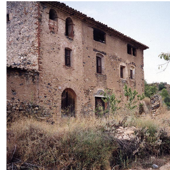
Mas rònc. Terme del Molar. Finals s. XVIII- principis s. XIX.

En aquest context s'inscriu la batalla de Gratallops, punt central de l'itinerari preparat pel Centre d'Estudis del Priorat i il·lustrativa de la duresa dels enfrontaments que es