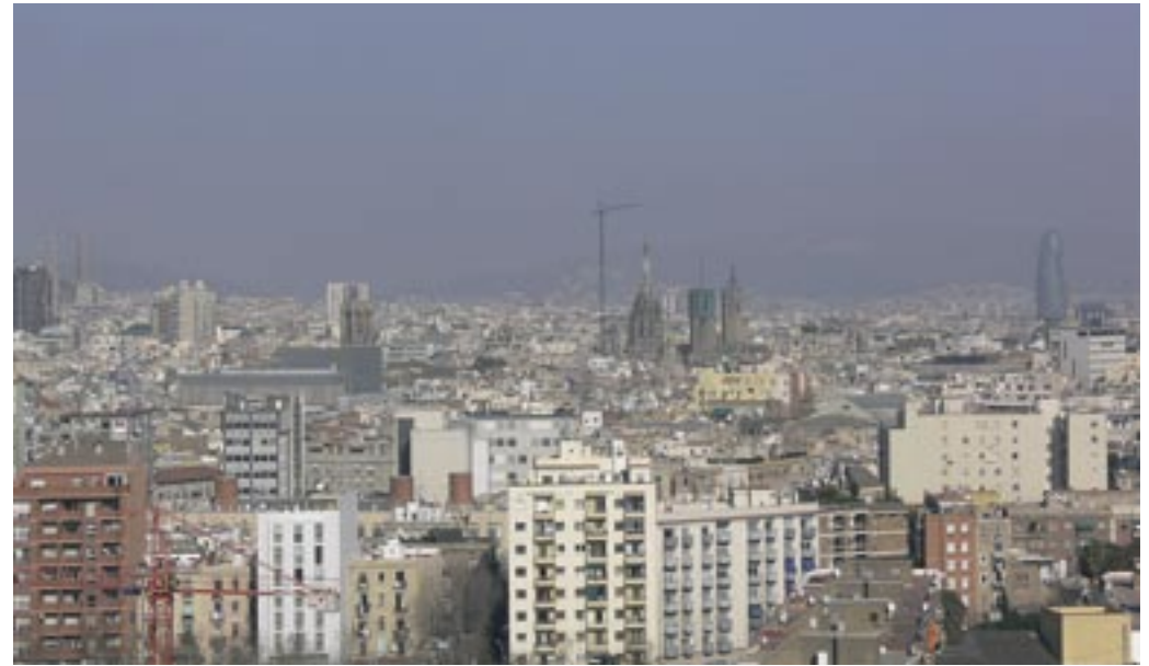
La ciutat des del Mirador del Poble Sec

En aquesta zona -avui un tranquil parc infantil- estaven instal·lades unes bateries conquerides als francesos en un aferrissat combat el dia 5 de desembre de 1808, una de les poques victòries contra els francesos que va assolir la ciutat de Barcelona. Josep Coroleu ens explica: "nos despertaron las detonaciones de las descargas y el cañoneo de las baterías colocadas en las faldas de Montjuich, las cuales, después de un recio combate, fueron tomadas e inutilizadas por los nuestros" . Els ciutadans més propers a les muralles sentien enmig del soroll dels trets i canonades els crits de: "Aquí minyons!! Endavant!! Ja son nostres!!!" .