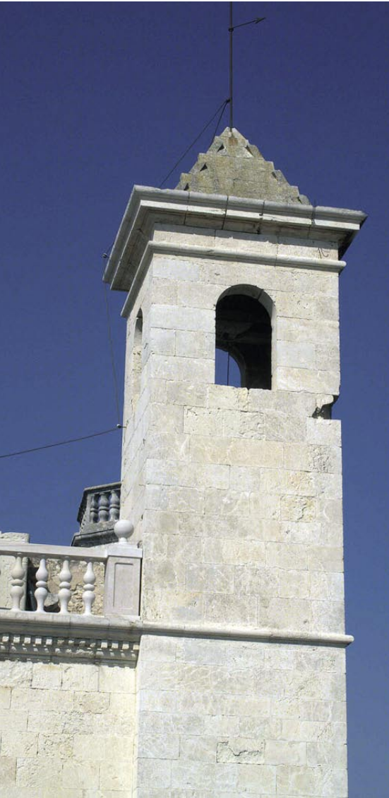
Església parroquial de Sant Julià: la senyal més visible en l'actualitat de l'acció francesa contra la vila el 9 de juny de 1808.

Per altra banda, les fonts franceses diuen que els arbocencs es feren forts a les seves cases i mantingueren una tenaç i inútil resistència, comptabilitzant sis soldats francesos morts i quinze de ferits.