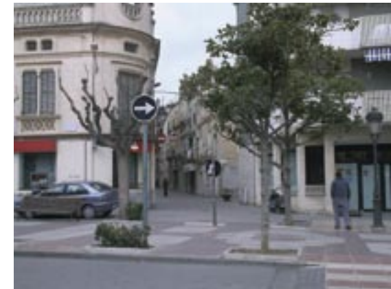
Rambla i carrer Major: lloc de l'enfrontament entre els sometents i les tropes imperials.

A la mateixa maqueta també es farà una petita explicació global de la vila, remarquant la ubicació de dos portals dels quals sortien els camins d'entrada i sortida cap a Tarragona, fins a unir-se en un de sol als afores de la població. Aquesta visió ens servirà per quan, en el transcurs de l'itinerari, s'expliquin els fets del 9 i la matinada del 10 de juny de 1808.