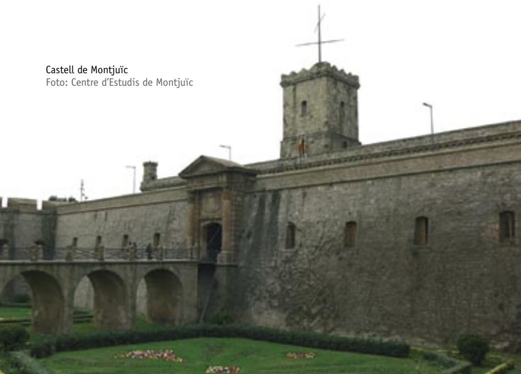
Castell de Montjuïc

Durant l'ocupació, les notícies i rumors del castell eren confuses: malalties, aigua contaminada... Un pacte entre Ezpeleta i Buroma va evitar el bombardeig des de Montjuïc, però el dia 15 d'agost de 1808 es van disparar cent canonades d'advertència als barcelonesos. Com a presó, el dia 9 d'abril de 1809 hi van ser portades les autoritats que es negaren a prestar jurament a Josep Bonaparte.