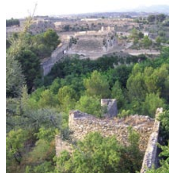
Vista de les fortificacions modernes del Fortí del Bonete en primer terme i al fons les fortificacions avançades de Sant Joan.

Ja des de l'inici, quan es veia a venir l'atac gal sobre Tortosa, no es va actuar amb la previsió adequada per dificultar la maniobra francesa. El mateix testimoni anterior, l'oficial polonès Brandt, va estranyar-se de la imprevisió que comportava deixar desguarnida Morella, precisament un dels eixos de l'avenç francès i capital d'un territori de fàcil defensa, com més endavant es comprovaria durant la Primera Guerra Carlista. Això sí, al cap de poc