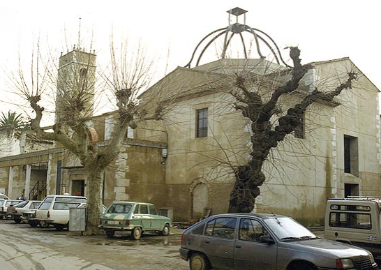
Casa de Cultura. Antiga església del Roser.

BICENTENARI la Guerra del Francès 1808-1814