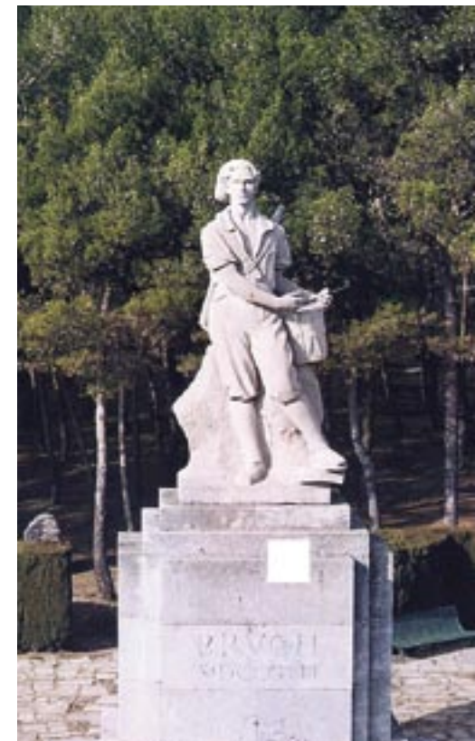
Vista frontal del Timbaler del Bruc

No hi va haver una tercera temptativa de creuar el pas de Can Maçana, almenys en aquella època. Quan, més endavant, els francesos van assolir Manresa i els seus molins de pólvora, ho van haver de fer a través del Vallès. Durant la resta de la guerra, la presència