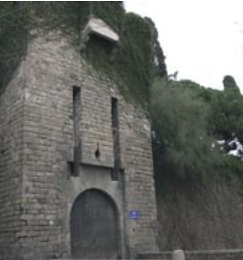
Portal de Santa Madrona i Drassanes

L'empitjorament de la situació militar a la Península produí l'abandó de Josep Bonaparte i el replegament de les tropes a Barcelona, on el 27 de juliol de 1813 arribà el mariscal Suchet des de València. Al mes de novembre nomenaren governador de la plaça el general Habert, que s'hi estigué fins al final de l'ocupació, tot i l'aïllament de la ciutat pel setge de les tropes hispano-angleses. El 28 de maig els francesos marxaren finalment de Barcelona i del castell.