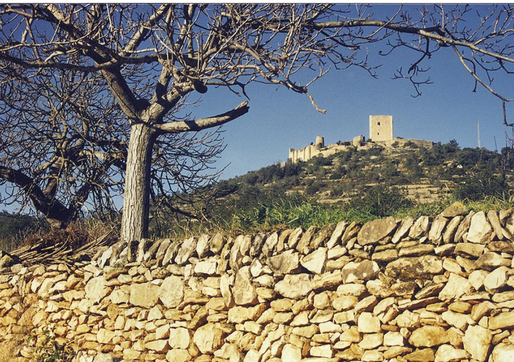
Castell d'Ulldecona.

Ulldecona no tornaria a ser escenari bèl·lic d'importància perquè al gener de 1811 els francesos van conquerir Tortosa i van controlar la situació, almenys fins a l'any 1813. Malgrat tot, s'hi va produir un petit incident digne de menció: l'11 d'abril de l'any 1811, la columna francesa que controlava Ulldecona va sortir en direcció a Vinaròs i Benicarló per confiscar-hi menjar, la qual cosa va ser aprofitada per un cos de cavalleria i infanteria espanyols, que van confiscar cent bagatges al poble. Malauradament, aquest cos va ser vist pels húsars i cuirassers gals i es va muntar una batalla ferotge en la qual els patriotes van perdre cinquanta homes prop d'Ulldecona.