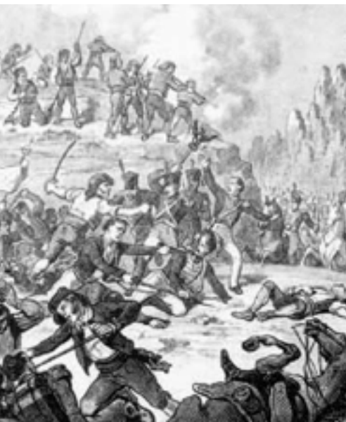
Litografia d'Eusebi Planas: Victoria del Bruch. La primera alcanzada en España sobre los ejércitos de Napoleón

El 1807 l'emperador dels francesos, Napoleó, s'havia apoderat ja de mitja Europa. A finals d'aquell any Espanya i França van signar el tractat de Fontainebleau, pel qual ambdós països es proposaven envair Portugal. Amb aquest motiu, tropes franceses van entrar a Espanya i s'establiren en terres de Castella i Portugal.