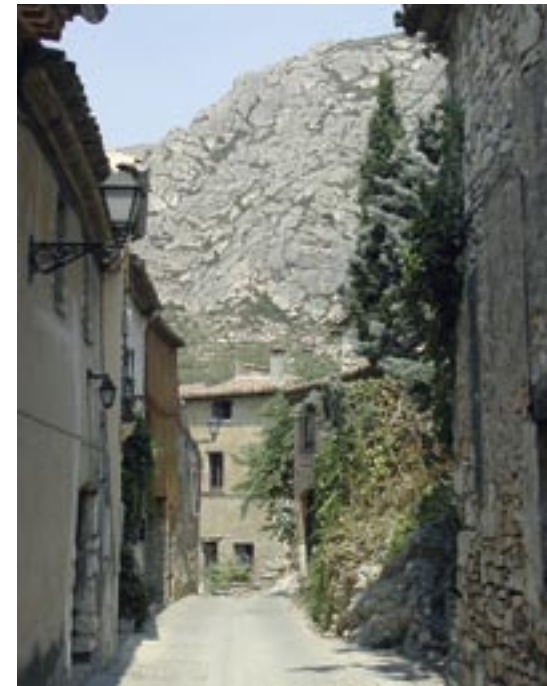
Carrer d'Amadeu Vives, al nucli històric de Collbató. Escenari de la repressió militar francesa contra la població que va donar suport als milicians catalans a les batalles del Bruc.

En la participació de Collbató a la guerra destaca per damunt de tot un personatge clau: en Mansuet Boxó, bandoler i eventualment guerriller que va lluitar contra l'ocupació francesa. A cavall entre la història i la llegenda, confós de vegades amb altres figures històriques, en Mansuet protagonitza un dels fets que han perdurat a la memòria local. La llegenda, escrita per primer cop el 1851, explica que va saber protegir les dones i els nens de Collbató de la repressió francesa amagant-los a les coves del Salnitre i que