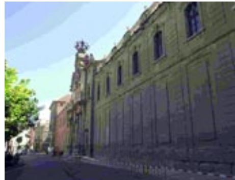
Universitat de Cervera.

en definitiva, una gran destrossa en totes les coses referents al culte i, fins i tot, es va arribar a pertorbar el repòs dels difunts en els seus sepulcres. Es va fer el mateix en la resta dels temples de la ciutat, que estaven exposats al furor dels soldats.