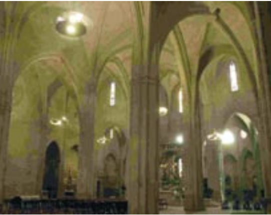
Església de Santa Maria.

No van passar ni cinc minuts quan els “vivas” i les aclamacions de goig es van transformar en plors, ja que uns sis-cents cavalls francesos van irrompre enmig de la ciutat per tal de recobrar els seus presoners i van sortir per tots els camins per a sorprendre la gent que anava fugint.