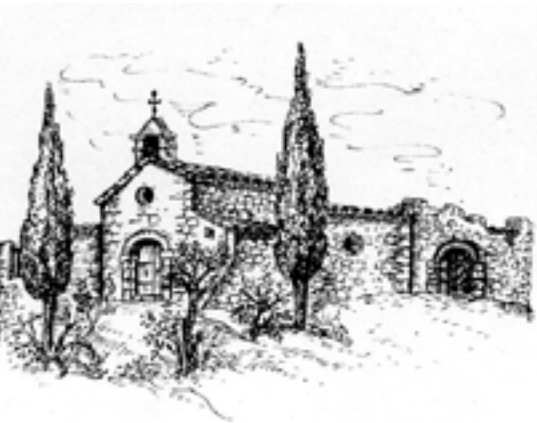
Ermita de la Consolació. Vista frontal.

La Guerra del Francès no es pot comprendre adequadament si sols tenim en compte els components patriòtic i religiós de la mobilització popular. El conflicte també va adquirir inicialment un caràcter social, massa perillós per als interessos d'unes autoritats tradicionals que van intentar organitzar i controlar la insurrecció. Per exemple, a Falset, davant la negativa general a continuar pagant drets i impostos, el batlle va alertar que "si no se pone remedio urgente, los propietarios no seremos dueños de los frutos de nuestras tierras, ni podremos contener a los que nos los arrebatan" .