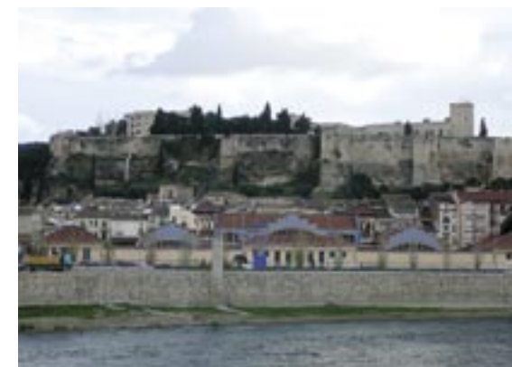
Vista de la ciutat amb la fortificació del castell de la Suda des de Ferreries.

conflicte i per la marxa de la guerra. Tot això al capdavant va significar que cada zona quedés a l'arbitri de les decisions de dirigents locals o regionals i d'alguns caps militars més o menys ben avinguts amb els rectors de les juntes. Si en un principi la multiplicitat de focus resistents va dificultar el control napoleònic del país, en no poder assestar un cop decisiu, després, una volta generalitzada la lluita, la manca de coordinació efectiva va suposar també un entrebanc a l'hora de resistir el procés de conquesta peninsular