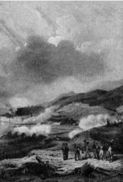
La rendició de Tortosa el 2 de gener de 1811. Gravet decimonònic francès dibuixat per Sandor i gravat per Chavaner.

La derrota va ser molt difícil de pair, especialment a Catalunya: ja només quedava Tarragona, que no tardaria gens a ser el pròxim objectiu de Suchet. Des del primer moment es va parlar de traïció, les grans expectatives posades en la resistència de Tortosa, que el llarg bloqueig feia suposar, es van esfumar de cop. L'ocupació francesa de la ciutat es perllongaria fins al 18 de maig de 1814.