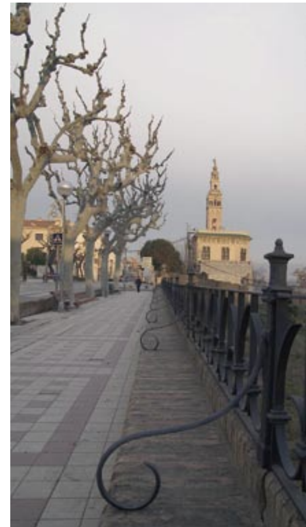
Balcó de la Badalota: visió de part del Penedès, fins a Montserrat.

Uns anys més tard l'autor farà una nova narració dels fets, una mica més literària, on especifica que els sometents eren del Vendrell i d'altres llocs, que els morts foren setanta-dos vilatans, trenta-nou sometents forasters i tres-cents francesos morts i cremats en una fassina, excepte tres. Explica també la sortida dels francesos el dia 10 entre les set o les vuit del matí i que, una vegada l'exèrcit va ser fora de la població, els sometents tornaren i robaren el que volgueren, ja que els veïns no havien amagat res. També fa una minuciosa relació de las destrosses fetes pels francesos a l'església, informant-nos que més de quaranta cases foren cremades i més de vuitanta, mig cremades.