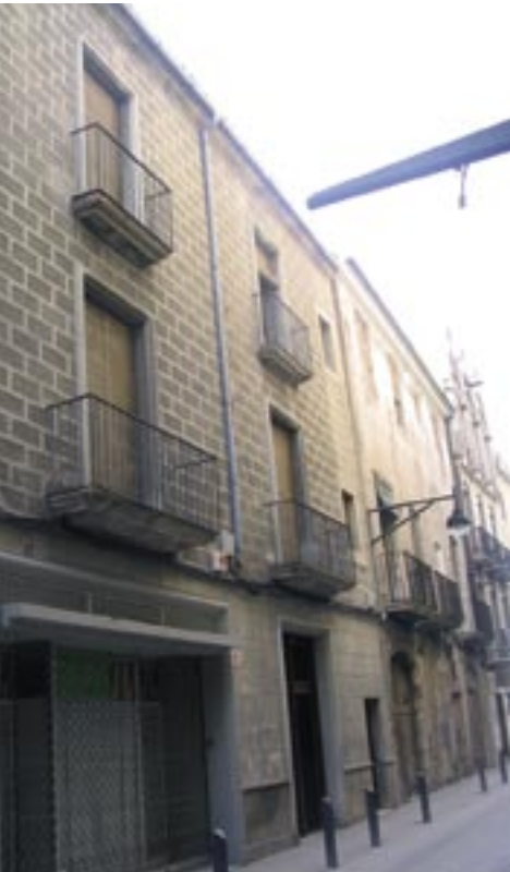
Casa Torelló. Carrer Nou.