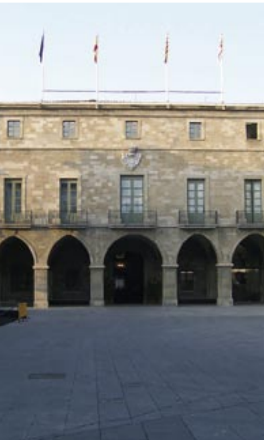
2. Ajuntament de Manresa i plaça Major Foto: Ajuntament de Manresa, 2007

Aquesta situació ja es va mantenir tota la guerra, agreujada per les cinc incursions de l'exèrcit imperial a Manresa entre 1810 i 1812. Entre el 16 de març i el 4 d'abril de 1810 es va estar a la ciutat un contingent de gairebé vuit mil soldats comandats per Schwartz. El 5 de novembre es va produir la primera operació de càstig, amb l'incendi d'unes cinquanta cases, el saqueig d'edificis i l'ajusticiament de tres persones al balcó de l'Ajuntament.