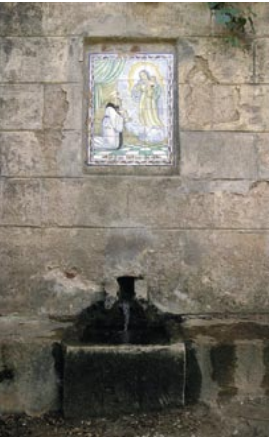
Font de Sant Bernat 1: les rajoles representen la imatge del Sant.

destacament avançat francès va obrir foc i tot seguit es retirà cap al gruix de la divisió Souham (amb menys de sis mil homes), que es desplegava en batalla a les alçades de les partides del Freixa, de la Granja i del Burgà, tenint Valls a la seva esquena.