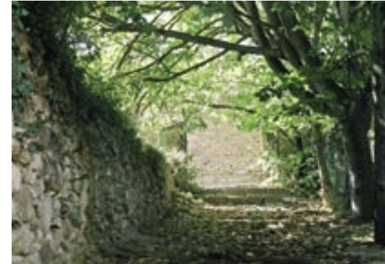
Font de Sant Bernat 2: en aquesta imatge és possible observar l'omeda.

A tocar de la granja de Doldellops, ha estat tradicionalment un lloc d'esbarjo quan la gent feia sortides "per anar de fonts". Es tracta d'un lloc arrecerat i bastant ben conservat, on l'aigua raja constantment.