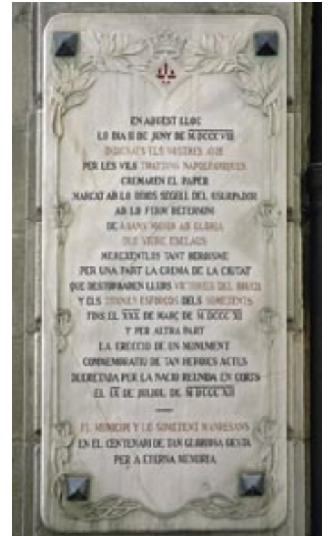
Placa commemorativa dels fets de 1808 instal·lada el 1908 a la façana de l'Edifici Consistorial de l'Ajuntament de Manresa, actualment a la façana lateral Foto: Ajuntament de Manresa, Genís Sáez, 2008.

A partir de llavors, els més rics van marxar de Manresa per evitar el pagament de les enormes contribucions extraordinàries i per evitar més assassinats. Les collites i els ramats perduts i el manteniment del col·lapse comercial provocaren una crisi econòmica de grans proporcions i la misèria de la majoria de la població.