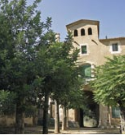
Doldellops: vista general de la granja de Doldellops.

La Granja de Doldellops és una antiga granja cistercenca que havia estat del monestir de Poblet. El territori el van donar l'arquebisbe de Tarragona i el comte Ramon Berenguer IV l'any 1155 perquè la comunitat hi bastís un molí a la riba del Francolí. En principi abastia la comunitat monàstica, però aviat els excedents es van comercialitzar i produïen bons beneficis. Al començament, les granges eren gestionades per conversos, es a dir, monjos menors, de famílies humils i que no havien fet tots els vots, per exemple el de clausura. Cap al segle XVI aquest tipus de monjos van anar desapareixent i les granges s'arrendaren a pagesos que pagaven unes rendes determinades al monestir a canvi d'exploitar la granja. La granja de Doldellops fou arrendada o adquirida (no se sap amb seguretat) per la família Sagarra de Valls l'any 1700. Durant la Guerra de Successió, la granja va hostatjar personatges importants propers a l'Arxiduc Carles d'Àustria i el general de l'exèrcit austracista Starhemberg hi va acampar les tropes. A la Guerra del Francès, el general francès Saint-Cyr va dirigir la batalla de Valls (coneguda com a batalla del Pont de Goi) des de la Granja.