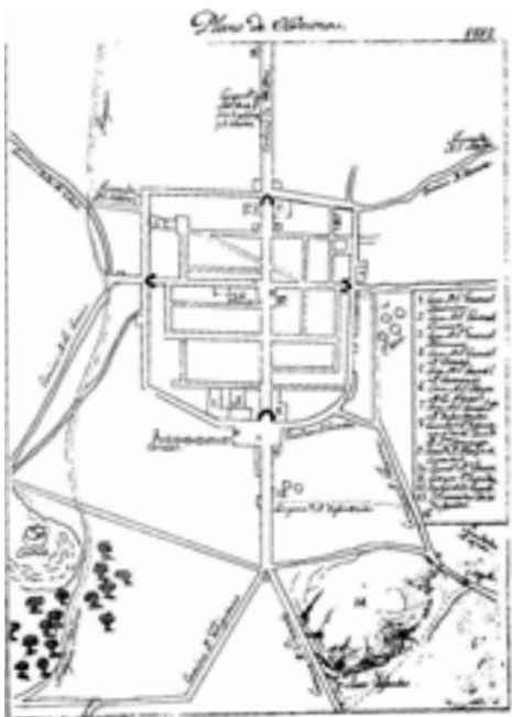
Plànol francès (1812)

Posteriorment ens dirigim a un altre important edifici emprat per les tropes i guerrilles per realitzar un control sobre la població i el pas dels Freginals, l'ermita d'Ulldecona. L'ermita té dos edificis principals. Un d'ells és l'església, del segle XIX, que conserva algunes estructures del romànic i gòtic i que acull i custodia la Mare de Déu de la Pietat, patrona de la vila. L'hostatgeria és l'altre dels edificis i se separa de l'església per un porxo central amb un arc de mig punt.