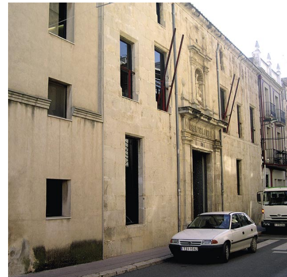
Casa de la Vila. Antic convent de Sant Domènec.

Malgrat tot, sembla que la retirada fins a Vinaròs va ser prou honrosa i ordenada. En aquella vila se'ls va ajuntar la columna de la dreta, que també es va retirar, però des d'allí fins a Peníscola el general francès Musnier els va anar dispersant i sembla que va fer més