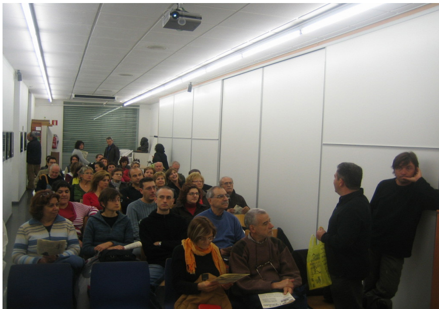
Una de les sessions del 3r Cicle de Cinema i Drets Humans que anualment organitza el Club d'Amics de la Unesco

informació, a la formació i al diàleg i reivindiquem allò que la pau no descansa sobre un conformisme satisfet.