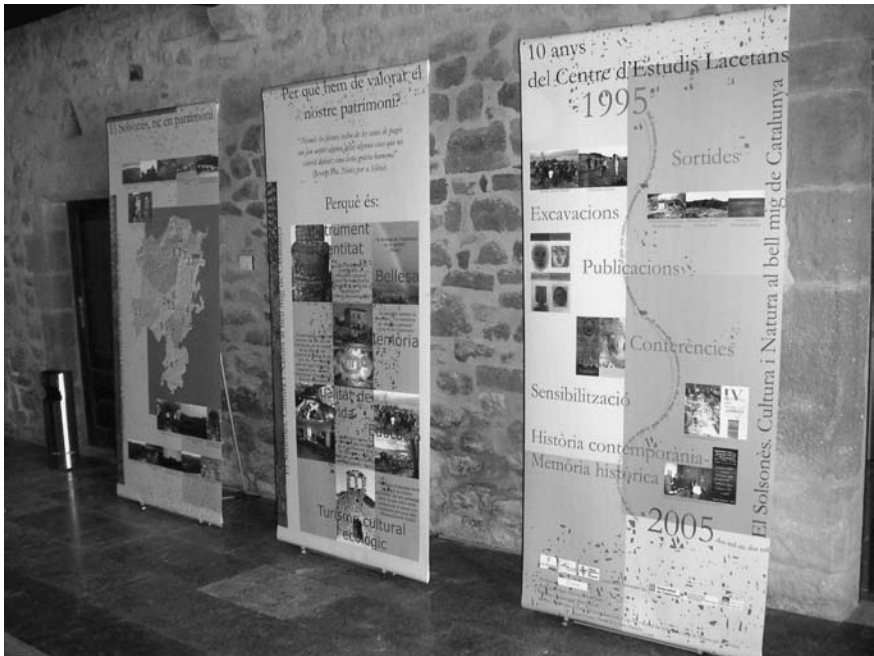
Plafons de l'exposició "Solsonès, cultura i natura al bell mig de Catalunya", realitzada en commemoració de 10è Aniversari del Centre d'estudis Lacetans, exposada a Pinós en el marc del Dia de Municipi de Pinós (juny de 2006)