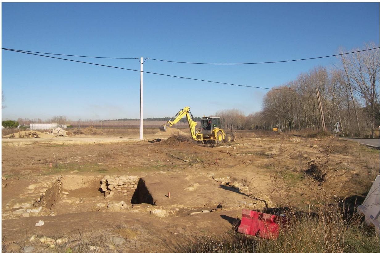
Imatge de les tasques de desbrossament i del seu resultat.