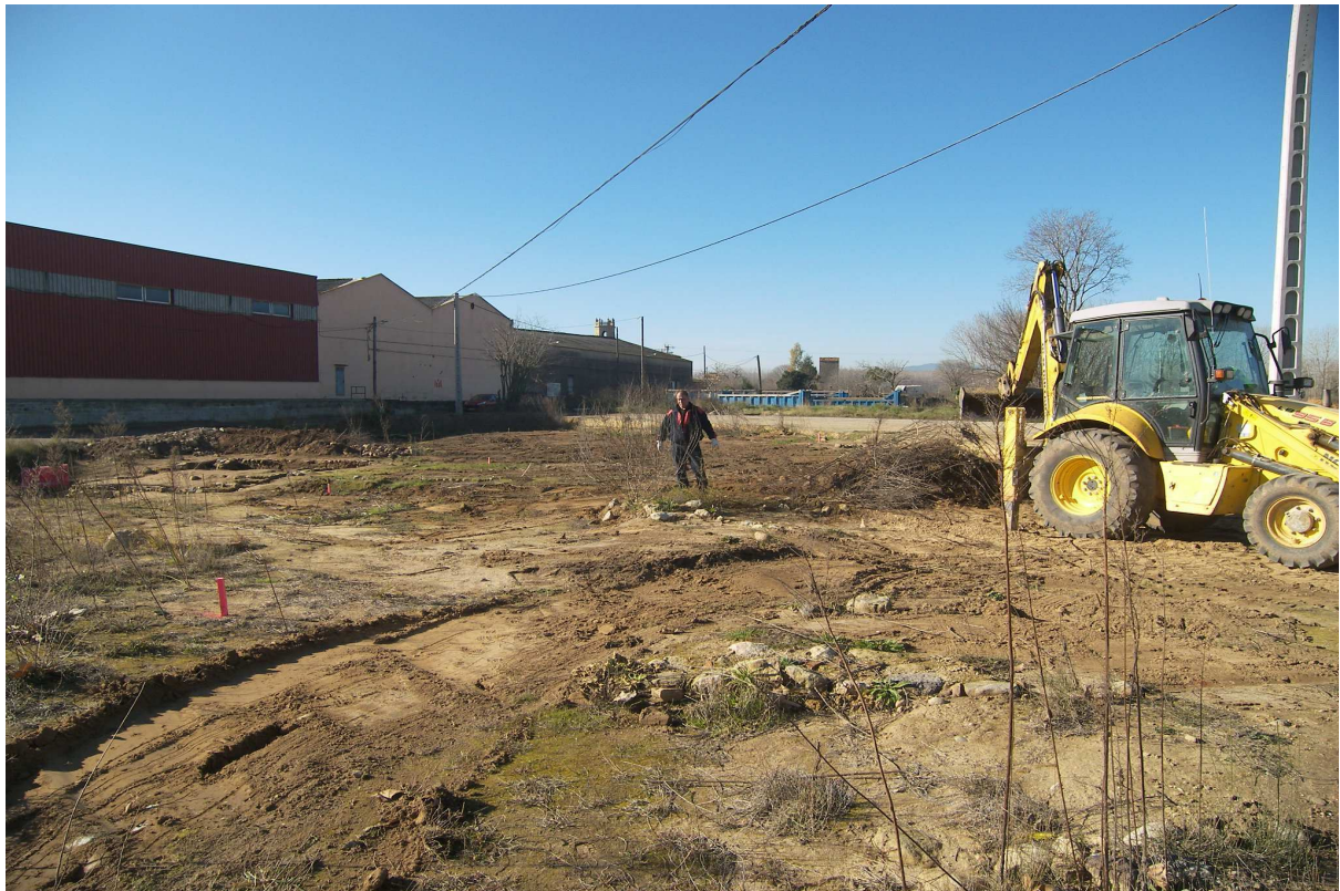
Imatge de les tasques de desbrossament que van combinar el treball manual amb el mecanitzat.