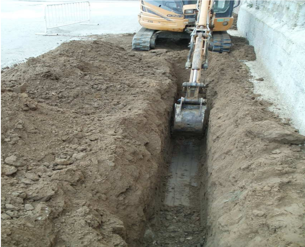
Imatge de l'excavació de la rasa de serveis.

Aquesta rasa, d'uns 40 centímetres d'amplada i aproximadament uns 40 centímetres de potència, s'ha excavat en una distància de 42 metres. La rasa s'ha iniciat en paral·lel i a tocar de la la façana nord de la fàbrica Aconda i travessa la carretera GIV-6424.