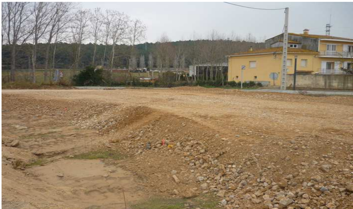
Aspecte de l'espai un cop fet el cobriment i un cop finalitzada l'aportació de terres fins a la cota projectada.