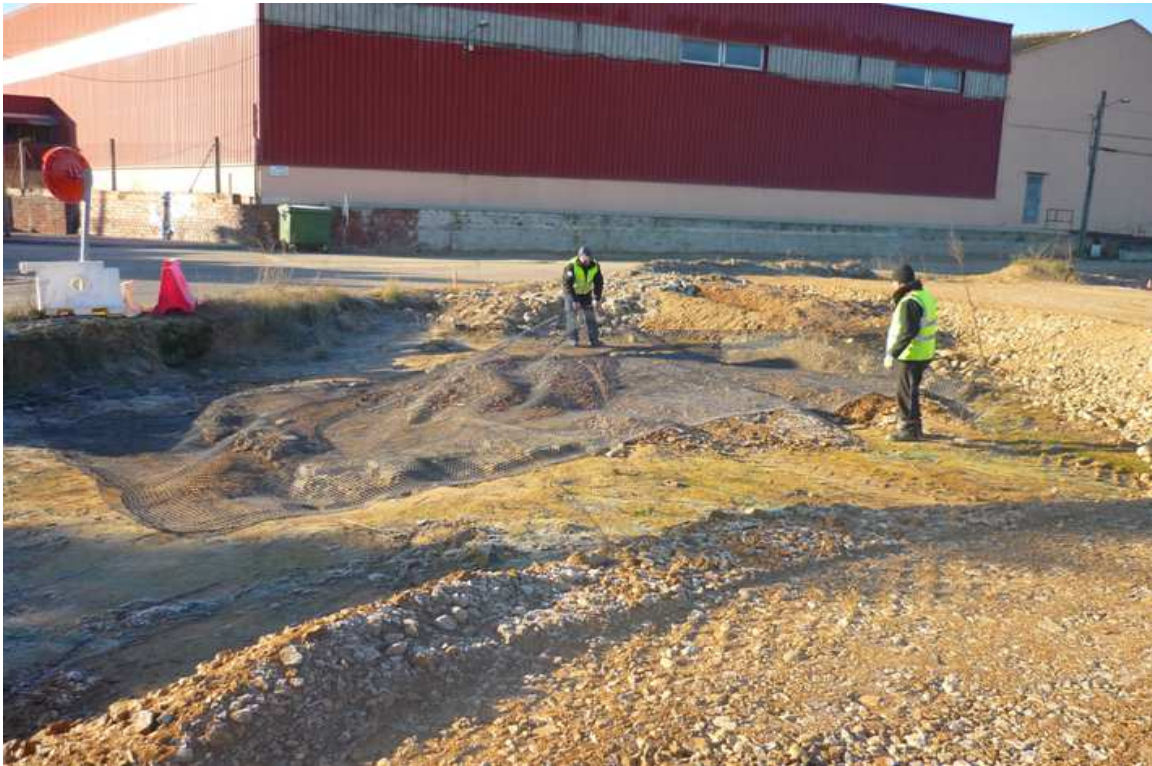
Imatge de la col·locació de la malla que aïlla el jaciment respecte als materials aportats.

Un cop dutes a terme les feines de neteja i desbrossament, es va procedir a estendre una malla sobre la part de jaciment que havia de ser coberta per la rotonda i el nou traçat de la GIV-6424. La col·locació d'aquesta malla té l'objectiu de fer de separació física entre el jaciment i les terres aportades per a la construcció de la rotonda.