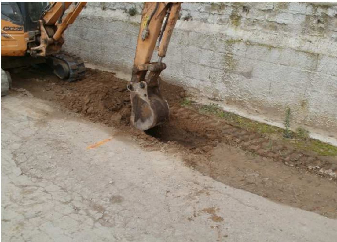
Imatge de l'excavació de la rasa de serveis.

Dins les mateixes tasques de control arqueològic s'ha dut a terme la vigilància dels treballs d'excavació d'una rasa per a desviar un servei de telefonia.