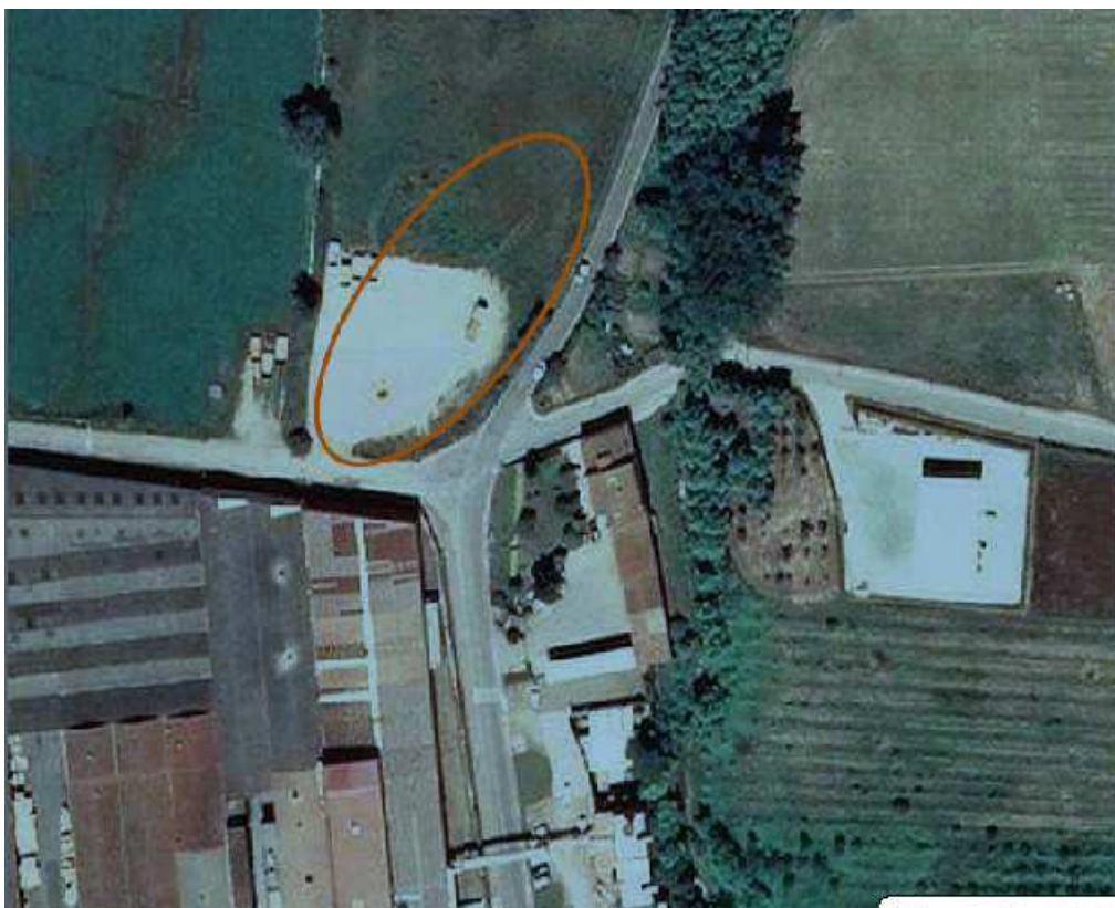
Plànols i ortofoto de la situació de la rotonda.