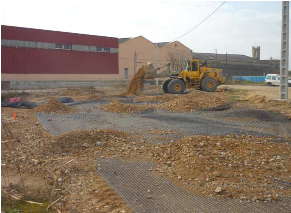
Imatge del cobriment del jaciment per sobre de la malla de protecció.