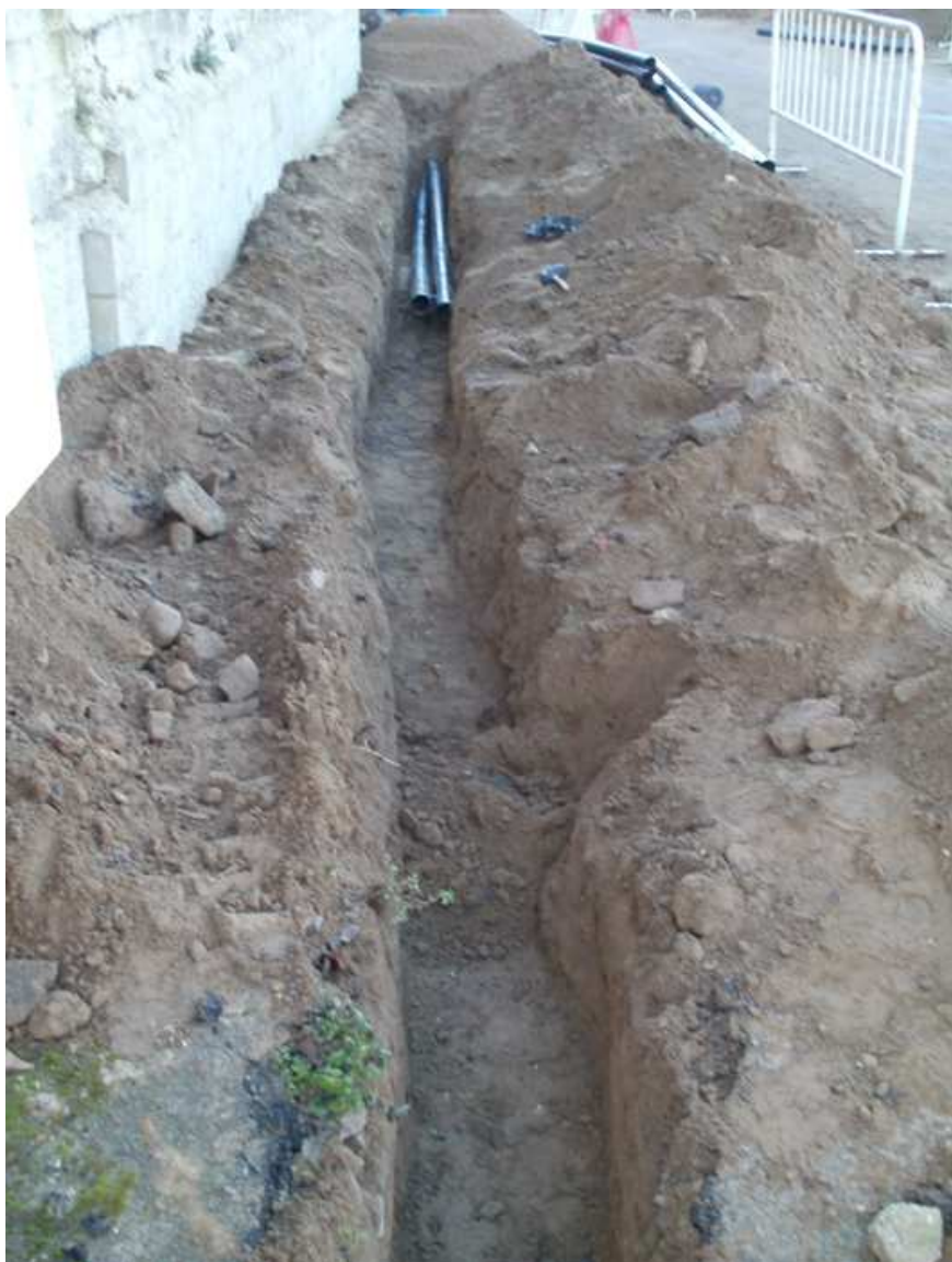
Imatge de l'excavació de la rasa de serveis.