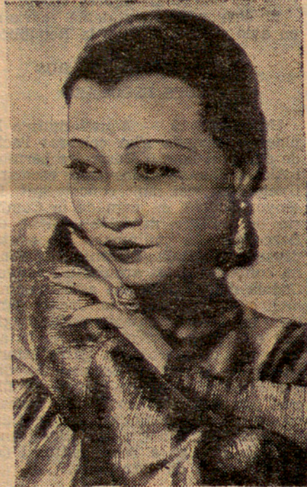
Anna May Wong