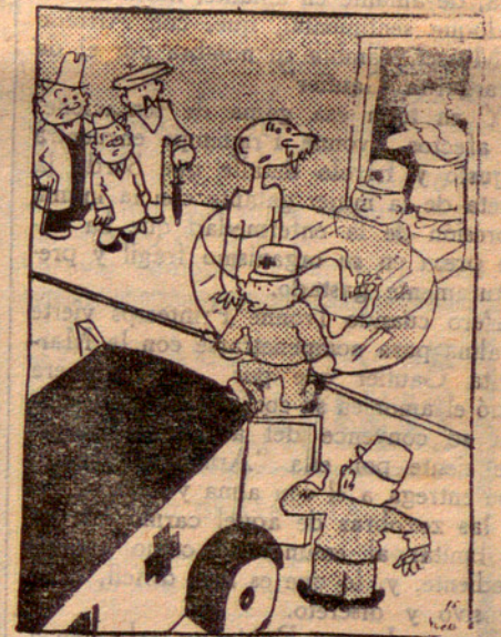
L'home que s'adormí dins la banyera deixant la finestra oberta tota una nit d'hivern.