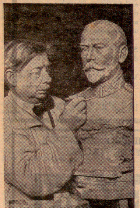
El jubileu del rei Jordi

Amb motiu del proper jubileu del rei Jordi d'Anglaterra, els escultors anglesos estan ara enfeïnadíssims per haver de complir copiosos encàrrecs de totes les parts de l'imperi. De tots els pobles arriben comandes de bustos del rei.