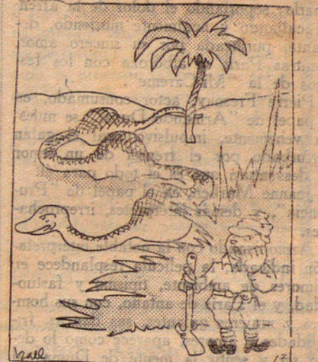
—La mare! Els meus tres gossos dins la panxa del reptil.