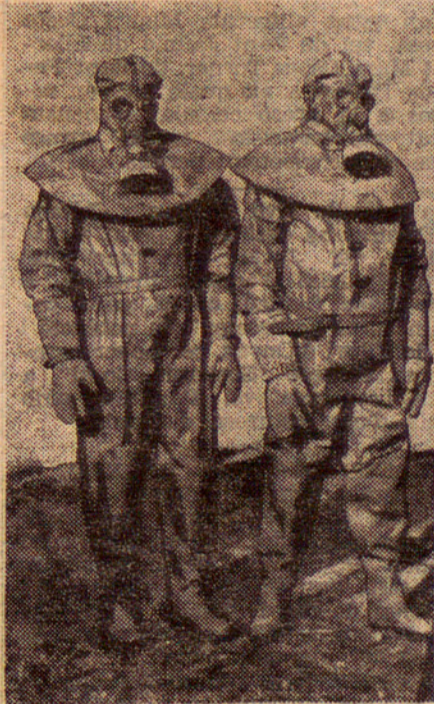
El vestit del futur

Heus aci el que un humorista n'acaba de dir "el vestit del futur"; equips per a protegir l'home contra l'acció dels gasos asfixiants.