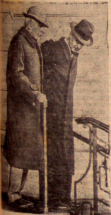
L'home místic d'Europa

Basil Zaharoff, el cèlebre banquer grec, és l'home místic d'Europa. Aquesta és la seva fotografia durant un temps. Basil Zaharoff ha enviat una força després de la seva malaltia. En la nostra fotografia se'l veu sentint d'un hotel de la Costa Blava, on ha anat a passar la convalescència. Basil Zaharoff va acompanyat del seu secretari.