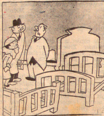
—Volem gastar sols 92 pessetes. —Ah!... —En tenim cent i les vuit que ens queden les gastarem per a celebrar la festa de noces.