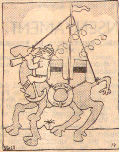
Com s'imagina en Peret la "nau del desert"; després de les explicacions de geografia.