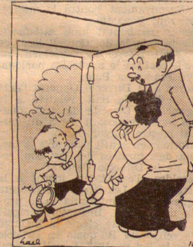
—Mamá, he fet tallar-me els cabells com el papà.