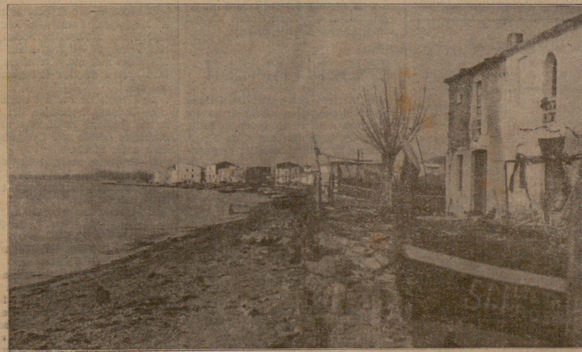
VISTA PARCIAL DE ROSES

Ha sortit de Barcelona, rumb a Roses, el creuer lleial "Cervantes".