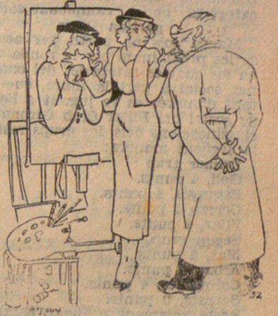
Ella. — El retrat no m'agrada; el nas és massa gros. No pot alterar-se? Ella. — Què li sembla amb una mica de massatge?