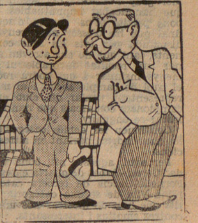
El metge. — Recordis: cap treball cerebral. El malalt. — Però, senyor doctor, i què amb la meua novel·la nova? El metge. — Ah!, aquesta continuem-la i prou.