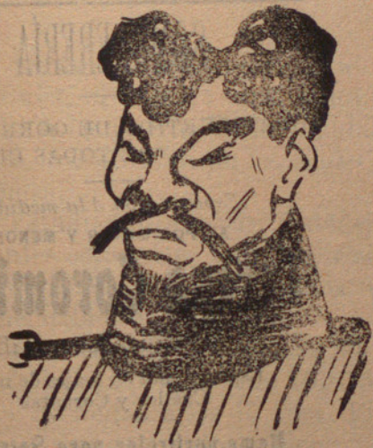
EMPERADOR DEL JAPÓN