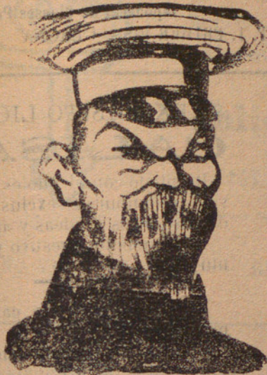
EMPERADOR DE RUSIA