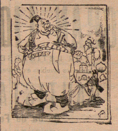
EL DICTADOR DE TURQUIA Kemal Pachá. — ¡Empezar hacer alguna cosa!

Un banquete gargantuesco ¡Vaya un montón de comestibles! Seiscientos kilos de salmones magníficos, mil kilos de filete de toro, 2.000 kilos de legumbres, 2.000 kilos de pan, 100 ensaladas, 300 litros de aceite, 100 litros de vinagre, 400 litros