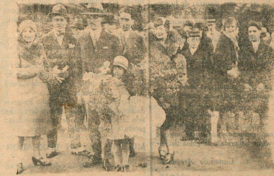
París.—El príncipe Sixto de Borbón a su regreso de Africa, a donde fué encabezado una importante misión científica de exploración del lago T Chad. En la fotografía el príncipe aparece acompañado de su esposa y de su hijo.

Atentos siempre al interés de nuestros lectores y abonados, publicamos en la edición de el "Autonomista" de hoy, un estado del nuevo servicio de trenes que empezará a regir desde el día 16 del corriente mes.