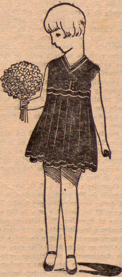
Vestido de crespón amarillo, festoneado con blanco.

Mal se portó el tiempo con las fiestas de la Santa Cruz. El domingo a pesar de mostrarse inseguro el tiempo no fué obstáculo para que en los trenes y autos llegaran unas diez mil personas. No se recuerda haberse visto ningún año tan gran número de franceses. Y es que el cartelito de los toros se las traía. Media hora antes de empezar la corrida cayó un fuerte aguacero que dejó imposible el redondeo. Al poco rato empezó a lucir el sol; una verdadera avalancha se dirigía a la plaza cuando se encontraron con