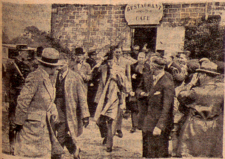
Francia. — El Príncipe de Gales, seguido de su hermano el príncipe Jorge, saliendo del restaurant del aerodromo de Mérignac, cerca de Burdeos.