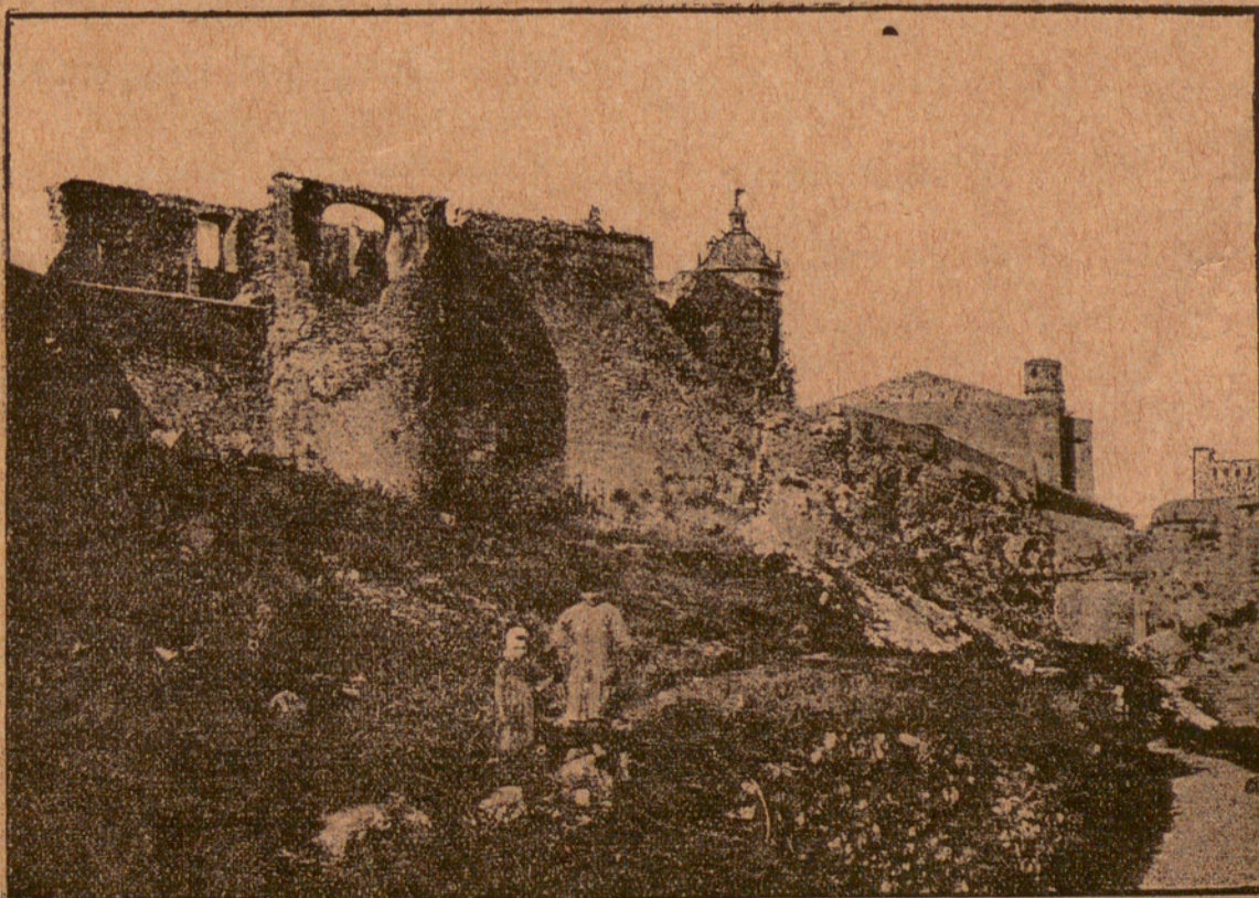
VIÑTAS DE GERONA