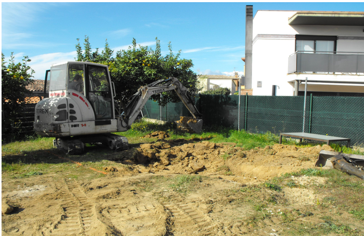
FOTOGRAFIA 4 → Imatge dels treballs inicials d'obertura del forat de la piscina, des de l'est.