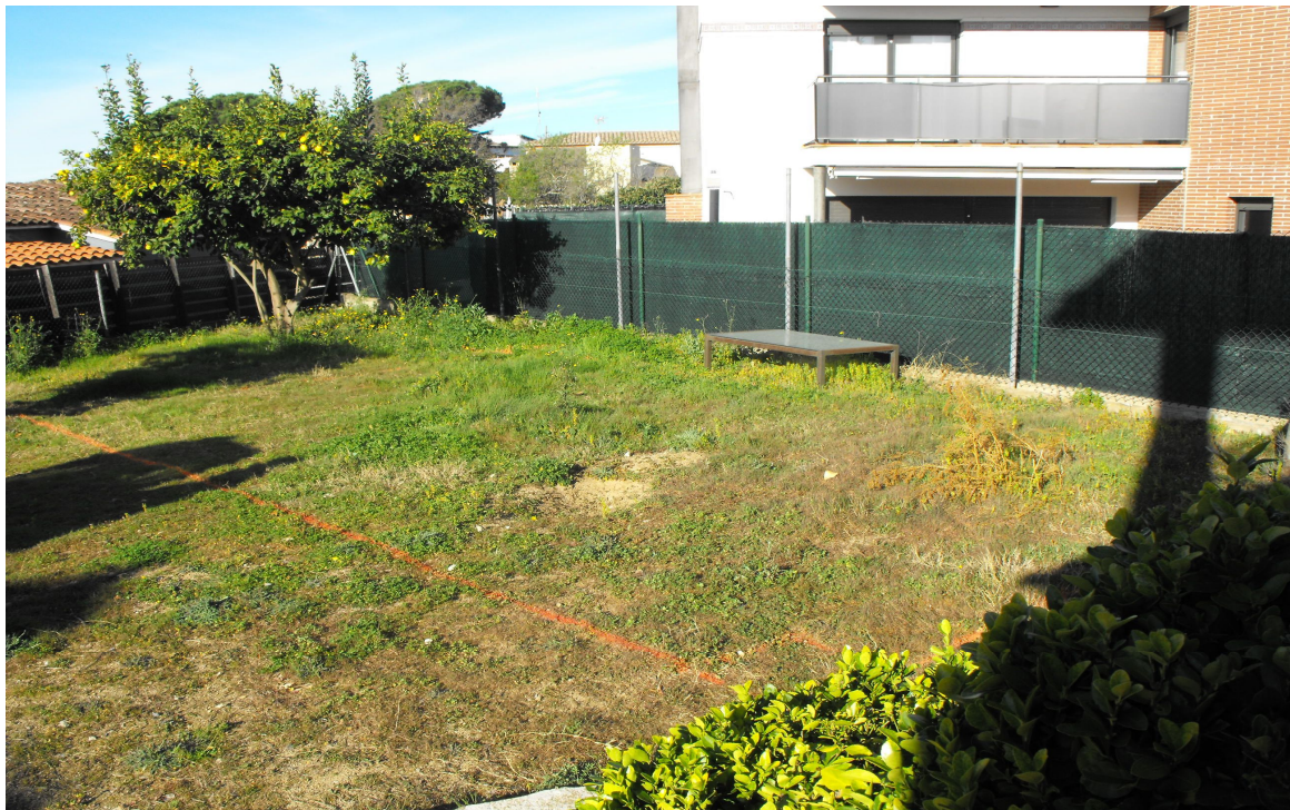
FOTOGRAFIA 2 → Panoràmica general de l'indret, amb el perímetre del forat de la piscina a excavar marcat, abans de començar la intervenció arqueològica, des del sud est.