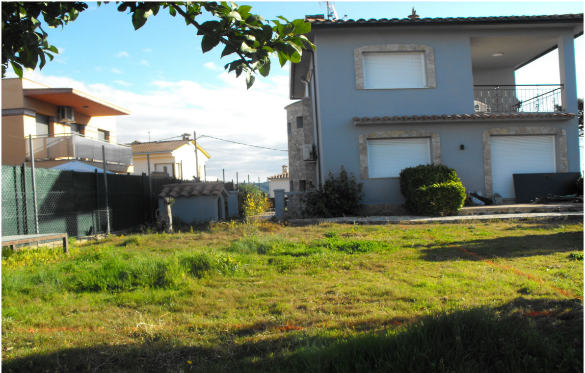
FOTOGRAFIA 3 → Vista de la zona abans de començar la intervenció, des del sud oest.