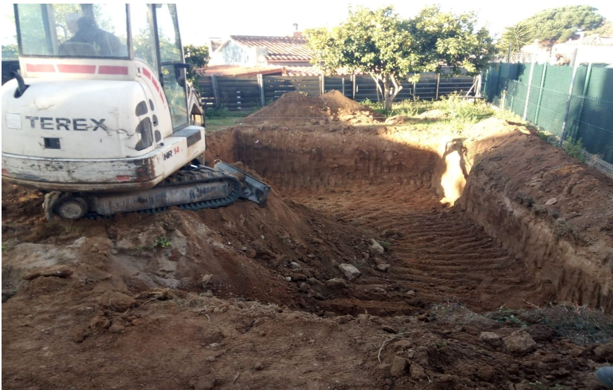
FOTOGRAFIA 8 → Panoràmica de les tasques d'obertura de la rasa, just a davant d'una parcel·la sense urbanitzar, al número 16 del carrer Canaletes, des de l'est.