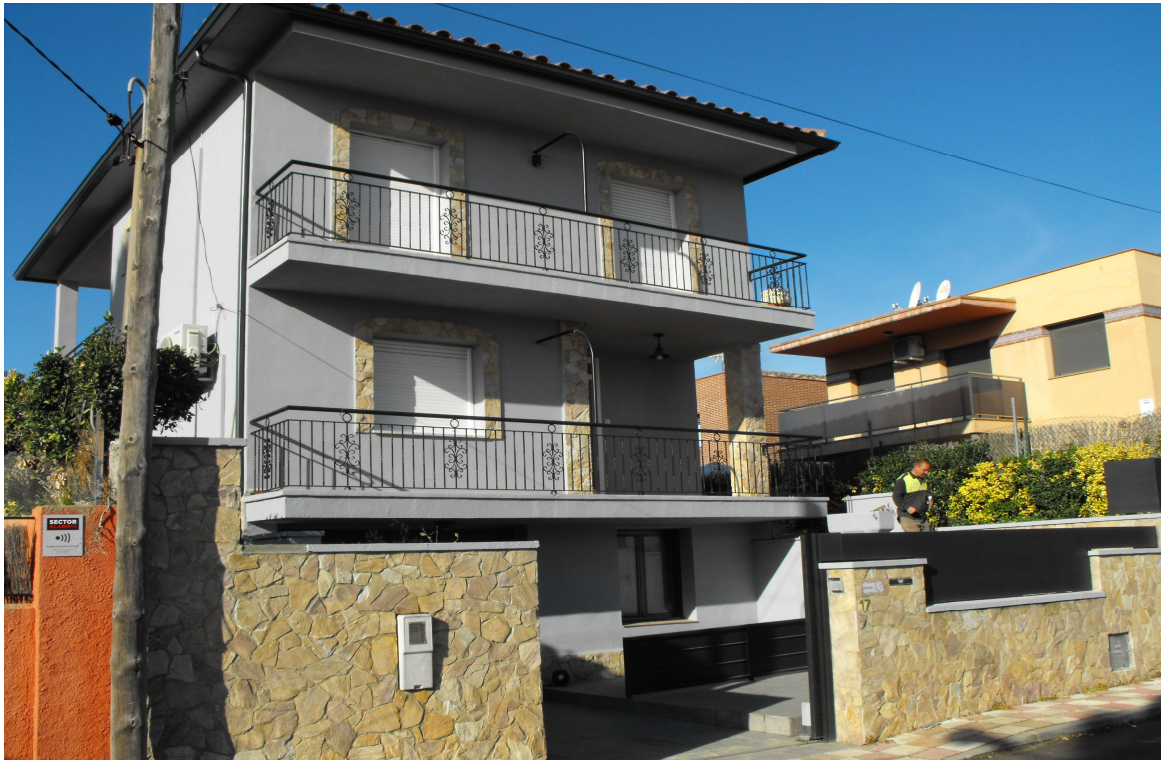
FOTOGRAFIA 1 → Imatge de la façana de la casa, del carrer del Bosc, 17, des de l'est.