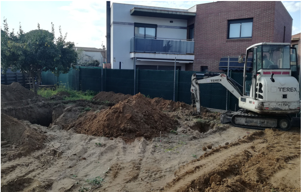
FOTOGRAFIA 7 → Una altra imatge de la màquina obrint el forat de la piscina, des del sud est.