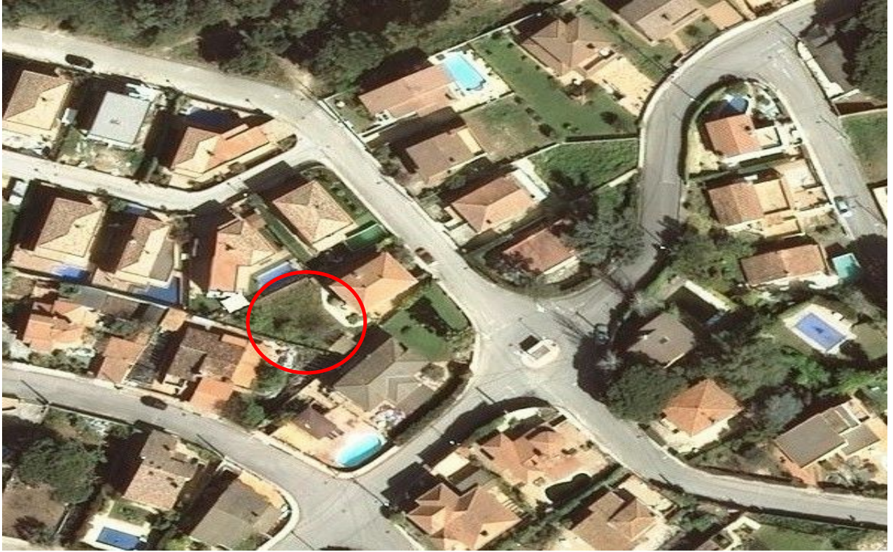
PLÀNOL 3 → Ortofotomapa amb la situació de la finca del carrer del Bosc, 17 a la urbanització de La Soleia (Lloret de Mar).