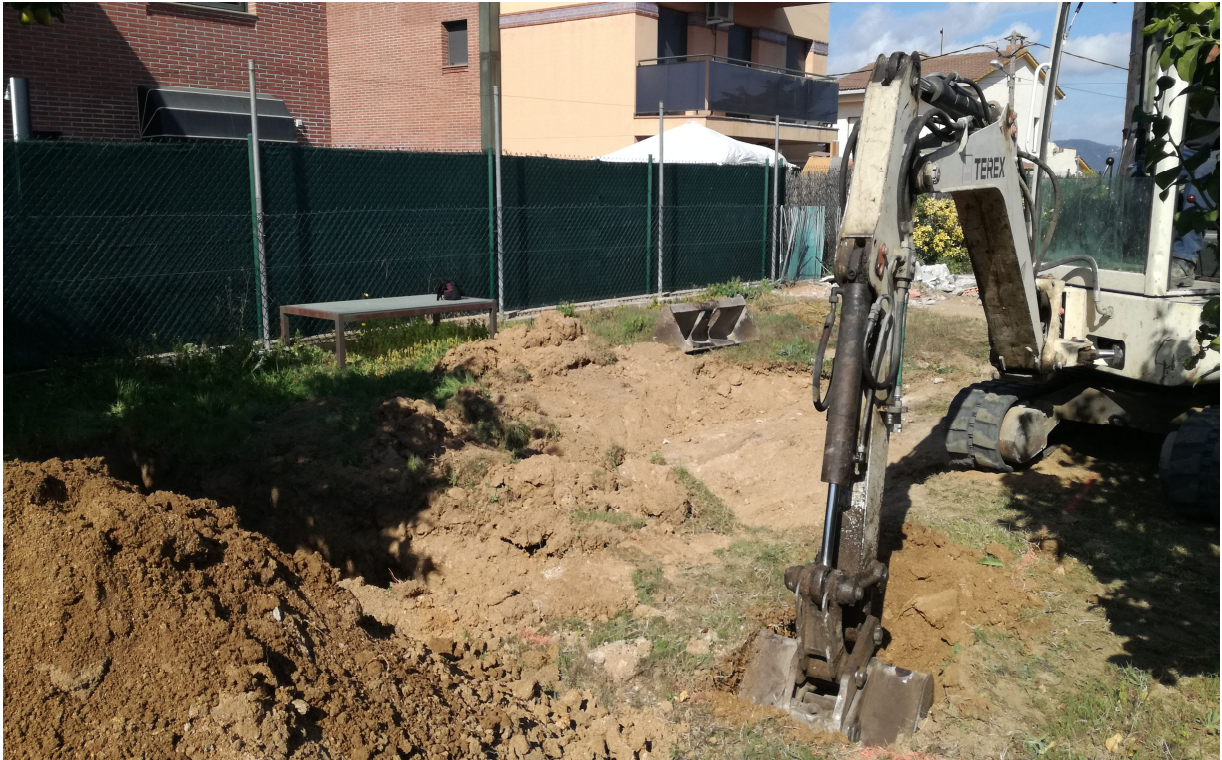
FOTOGRAFIA 5 → Una altra fotografia de la màquina efectuant l'obertura de la piscina, des del sud est.