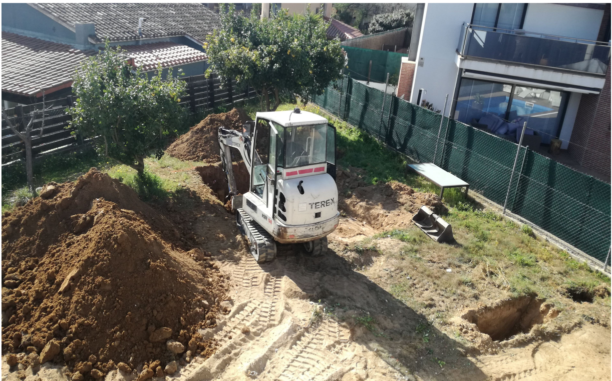
FOTOGRAFIA 6 → Vista aèria de la màquina excavant el forat de la piscina, des de l'est.