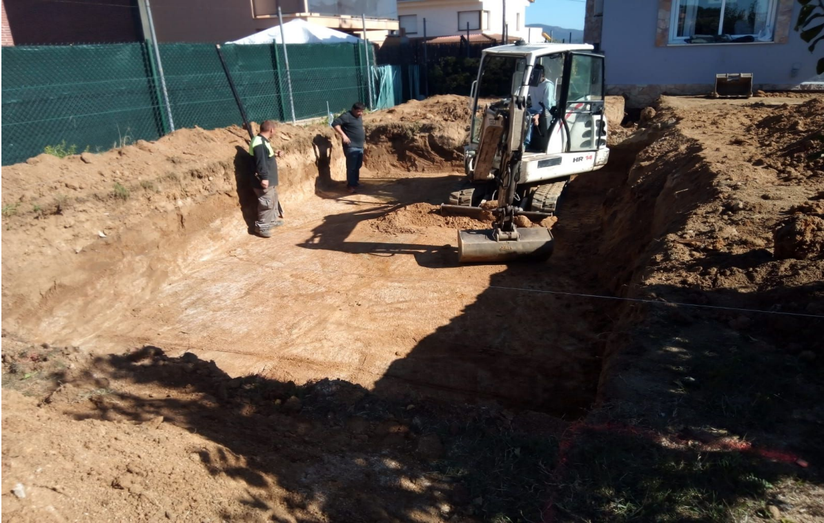
FOTOGRAFIA 9 → Vista final del forat de la piscina totalment excavat, des del sud oest.