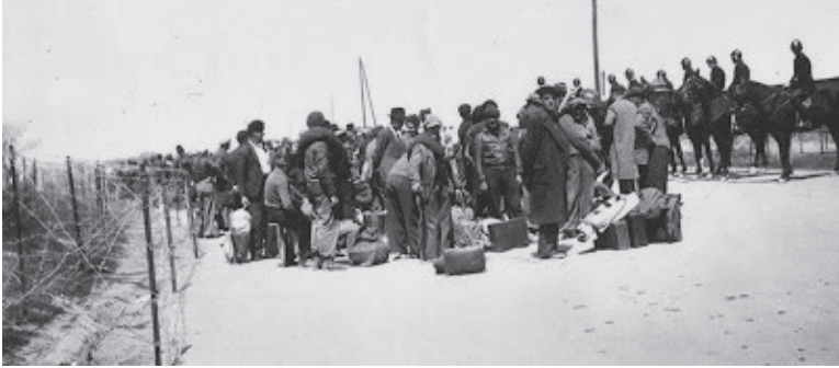
La guardia armada conduce a los refugiados al campo de concentración.