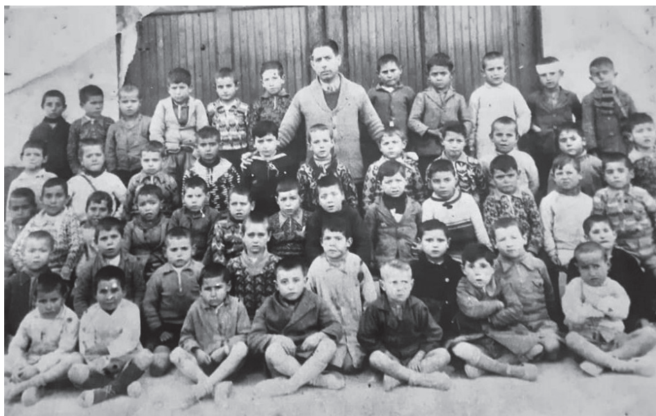
Grupo escolar en los años treinta.