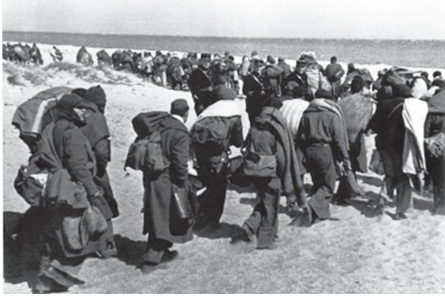
Refugiados republicanos llegando al campo de concentración de Argèles -sur-Mer.