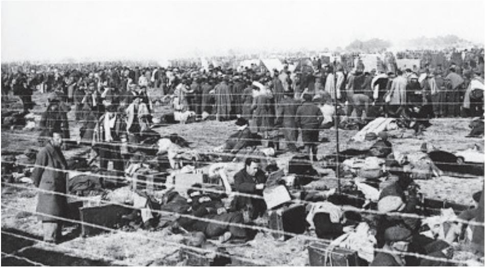
Campo de concentración de Argèles-sur-Mer.