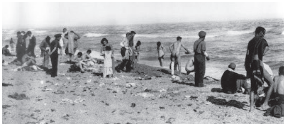
Los primeros días en el campo de concentración de Argèles.