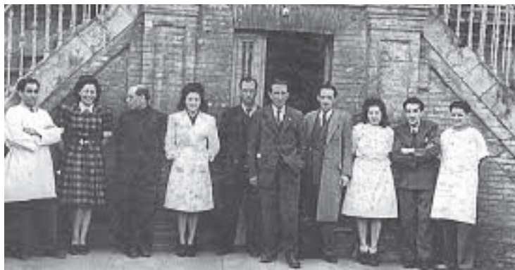
El hospital de Varsovia, símbolo del exilio republicano español en Toulouse, fue creado en el otoño de 1944 para atender a los heridos de las unidades guerrilleras y, posteriormente, a todos los refugiados españoles.

Desde Toulouse, el general José Riquelme López-Bago en calidad de presidente del comité nacional de la UNE, hizo una llamada a la ocupación del valle de Arán, a pesar de que no estaba de acuerdo con esta operación. El propio Gardó –en calidad del asistente– acompañó al general Riquelme a la frontera. Así, comenzó la infiltración en el valle de Arán (octubre de 1944), que no cumplió sus objetivos, pues los guerrilleros ni siquiera pudieron tomar su capital, Viella. La derrota de los guerrilleros fue hábilmente utilizada por la propaganda franquista. Desde entonces, se evidenció que el régimen franquista no iba a ser cuestionado por las potencias vencedoras y que el regreso a España de los exiliados, por tanto, era imposible. En este contexto, la correlación de fuerzas políticas habría de replantearse, como lo evidenció la disolución de la UNE y la integración del PCE en Alianza Nacional de Fuerzas Democráticas (ANFD). También la correlación de los diversos sectores en el interior de los partidos, como ocurrió en el PSOE (expulsión de los negrinistas ) y en el PCE (defenestración de Jesús Monzón).