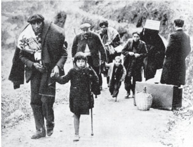
La Retirada.