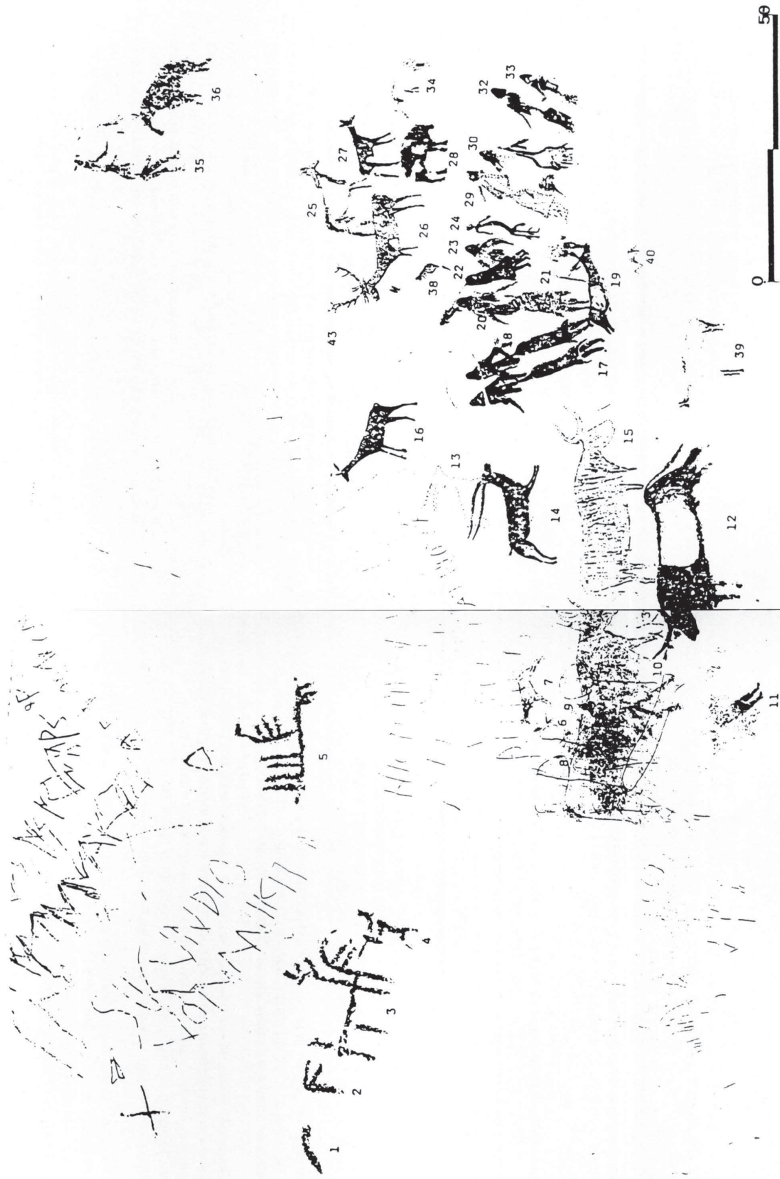
Fig. 2. — Composició general del fris de la Roca dels Moros de Cogul, segons els autors (documentació per la Generalitat de Catalunya).