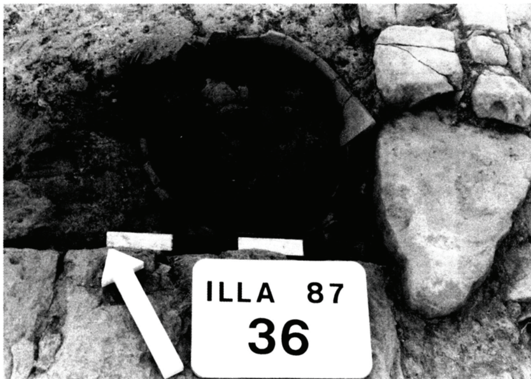
Fig. 2. – Enterrament perinatal delimitat amb fragments ceràmics

palesen, però, uns condicionaments més simples que els observats a l' oppidum d'Ullastret.