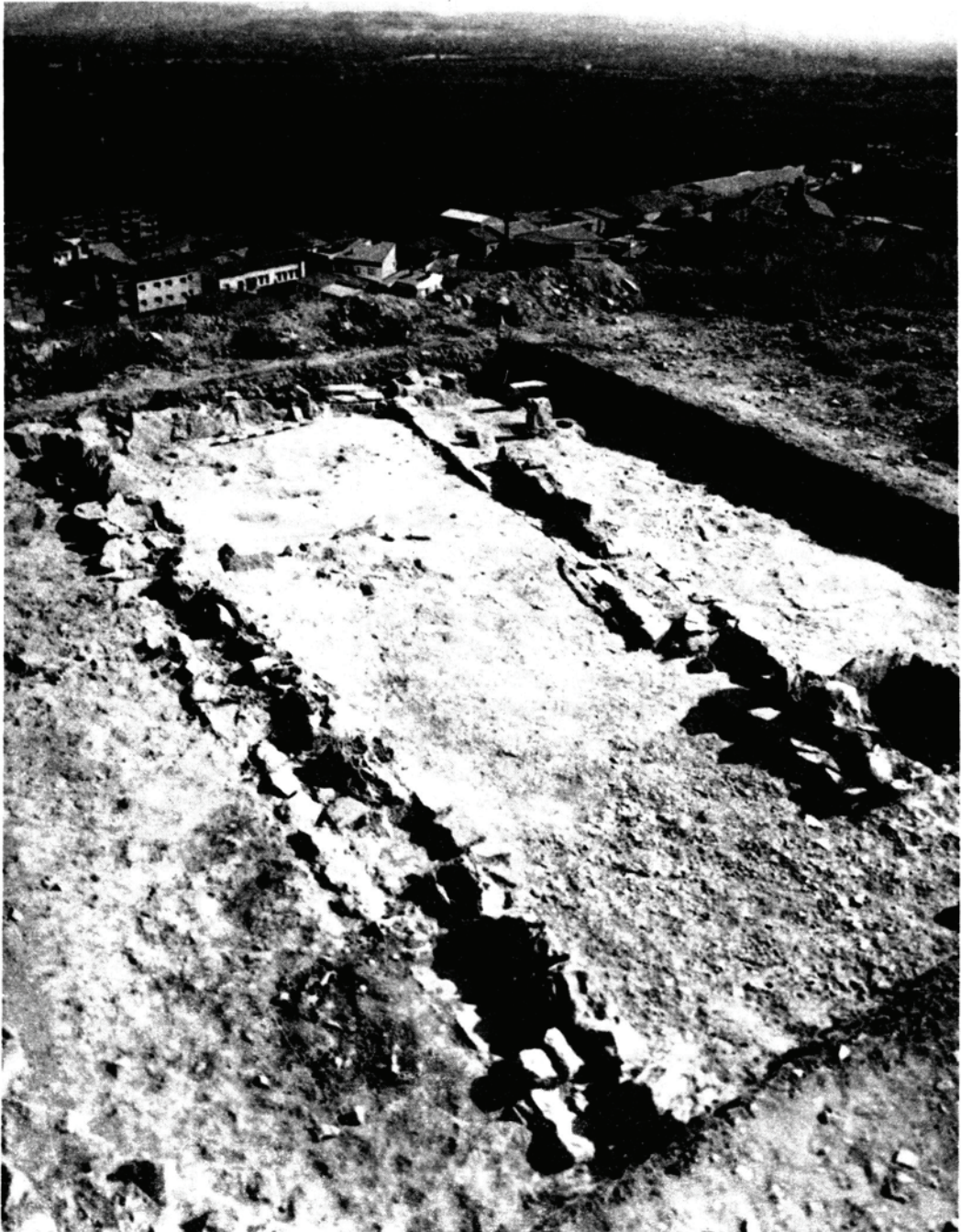
Fig. 2. Habitació n.º 1 de la Serra del Calvari.