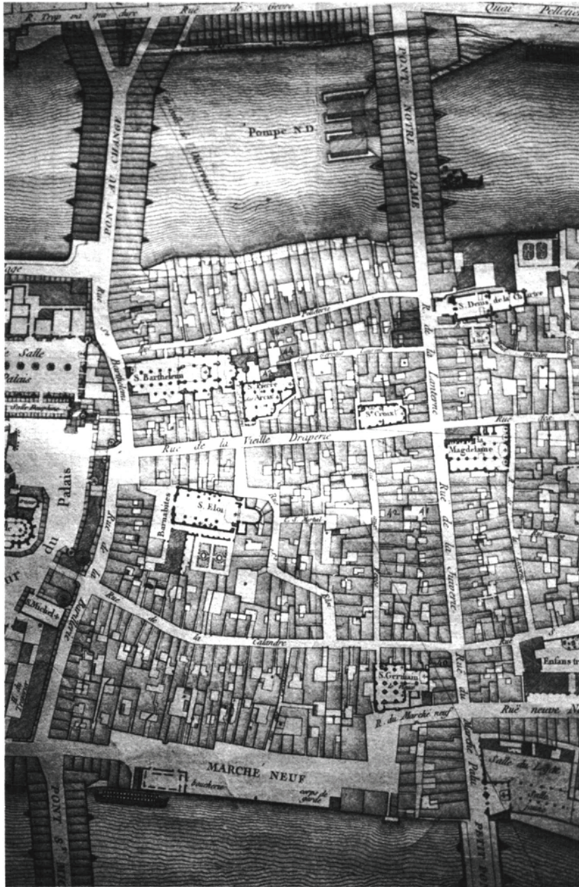
Fig. 2. – Plan de Delagrive. 1754. Arch. Nat. N. II.