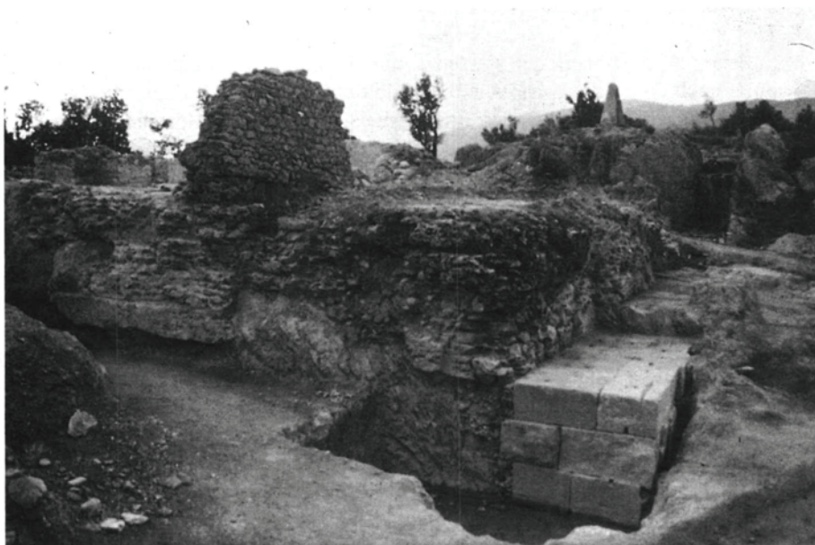
Fig. 3. Vista del monument romà. A primer terme, carreus in situ de la plataforma E.