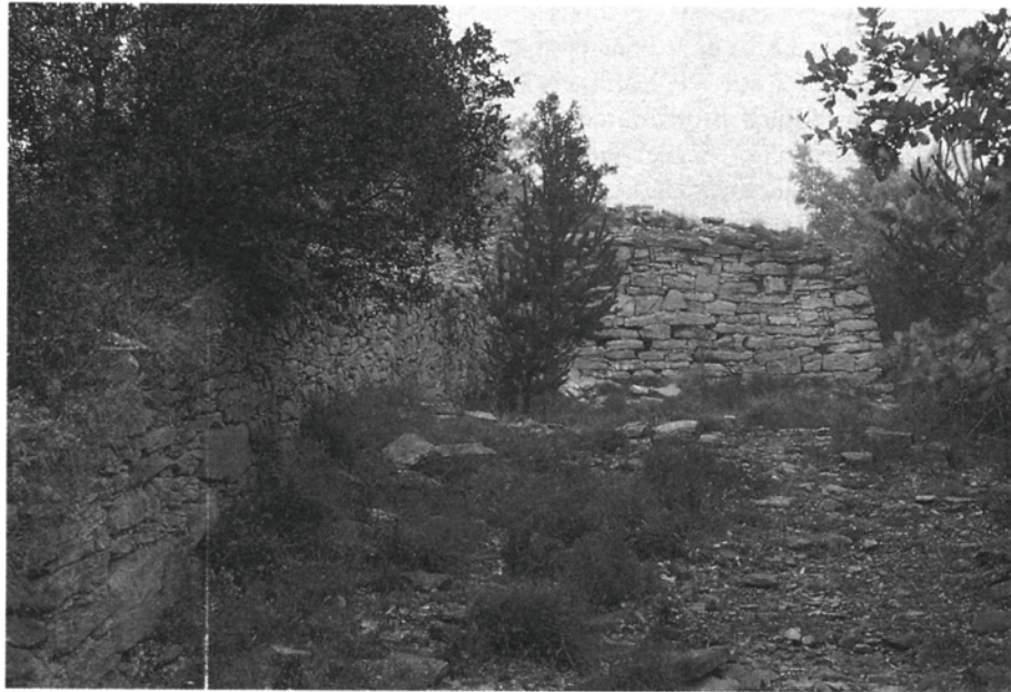
Fig. 3. Àmbits 2 i 2'.