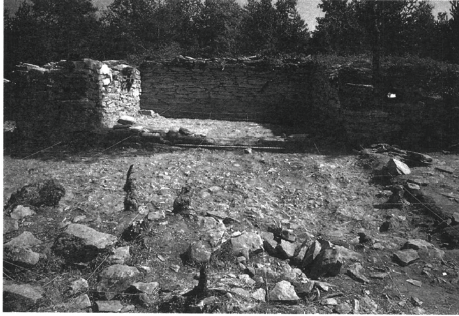
Fig. 2. Muralla i torre central