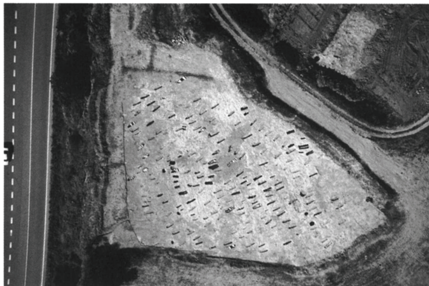
Fig. 2. Vista aèria del jaciment.

Malgrat tot, a partir de l'observació de la zona podem pensar en la idoneïtat de la part alta del turó on es troba el cementiri com a lloc probable de la seva ubicació, que concideix amb la tendència generalitzada a partir dels segles V i VI de cercar punts enlairats fàcilment defensables. Aquest turó reuneix totes aquestes condicions amb escreix, a la vegada que compta amb una visibilitat immillorable per a un control de les vies de comunicació properes i, també, que devia disposar d'aigua i de zones de conreu abundants en el seu entorn immediat. Dissortadament, les intervencions que ha sofert aquest turó a causa de la construcció de l'autopista A-7, primer, i del nou peatge de connexió amb la N-II, actualment, fan aquestes que suposicions no passin de ser només això, tot esperant que noves troballes puguin portar més informació.