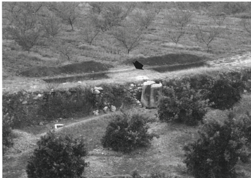
Fig. 1. Vista general del contrapès i el seu entorn.

formes Pascual I, la més abundant, i els contenidors Dressell 7-11 i Oberaden 74, que poden pertànyer a la producció d'un possible forn situat a la mateixa vil·la. Un paral·lel proper geogràficament, el trobem en el jaciment de l'Aumedina (Tivissa, Ribera d'Ebre), d'on es coneixen restes d'una indústria d'elaboració de vi, amb una premsa per a tal fi i un contrapès paral·lelepípedic (PALLARÈS/GRÀCIA/MUNILLA 1985) i, d'altra banda un forn d'àmfores que produeix els envasos Pascual 1, Dressel 2-4, Oberaden 74 i Dressel 7-11 (NOLLA/PADRÓ/SANMARTÍ 1979). Un altre cas el constitueix la notícia referent a les restes d'una altra premsa a la localitat de Sant Miquel de Vinebre, sense especificar-ne el tipus ni el context temporal però possiblement de caire vitícola (GENERA 1985).