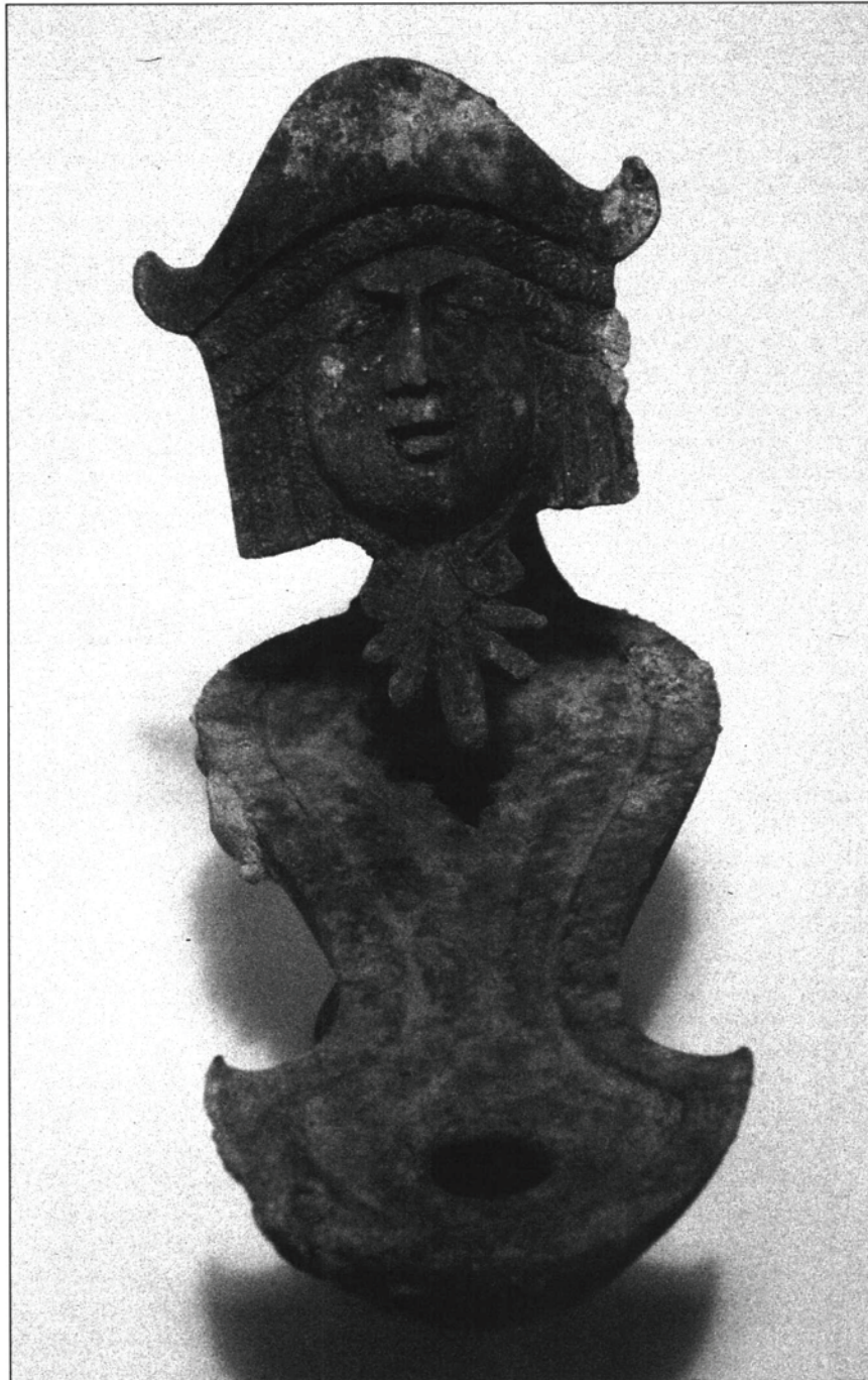
Fig. 2. Detall de la llàntia recuperada a l'abocador.