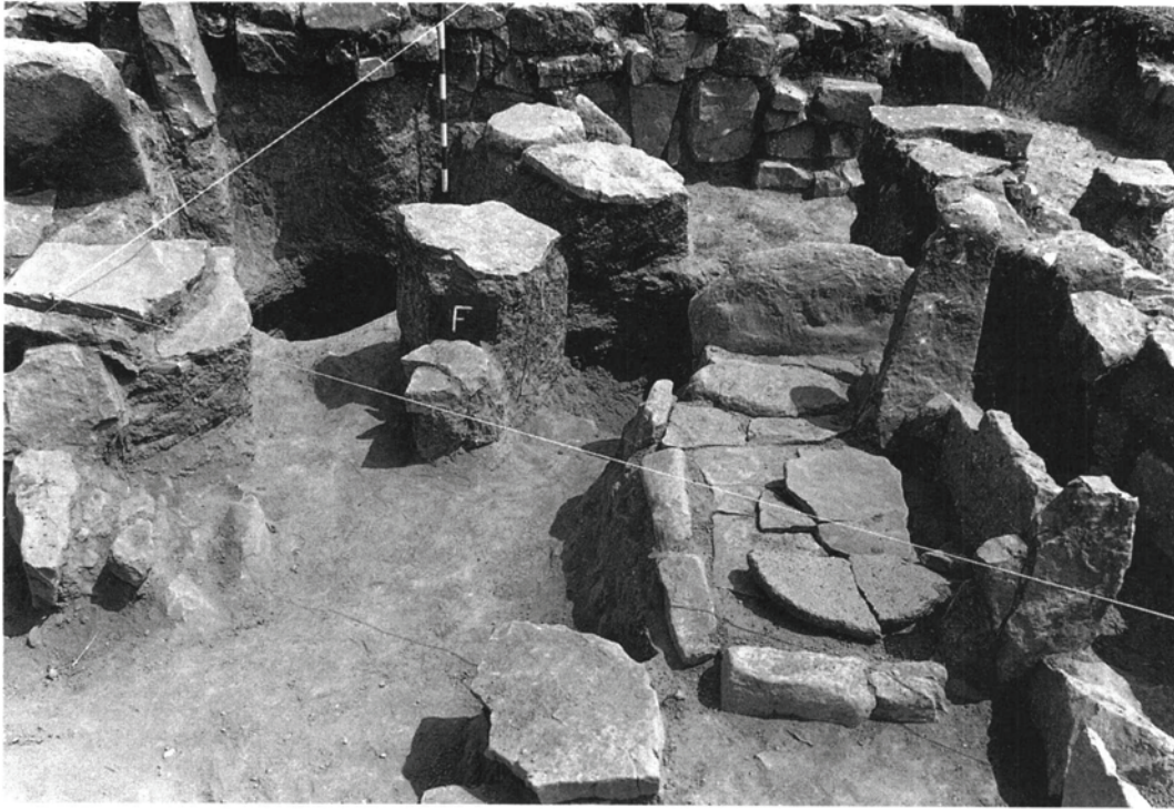
Fig. 1. Detall de la singular llar de foc de Vilaclara.

en un moment determinat, per l'àmbit 7. A l'àmbit 4, va sortir una llar de foc molt singular, un banc de pedra adossat al mur, dues sitges i una estructura rectangular de pedra; l'altra habitació (àmbit 5) presenta una sitja. Aquestes dues habitacions restaven comunicades per una porta. En un moment determinat aquestes dues habitacions estaven comunicades fins i tot amb l'àmbit 7. L'àrea de ponent presenta l'àmbit número 1, amb clars indicis d'haver-s'hi efectuat foc en el seu interior, i en els àmbits 2 i 3, al pati, va aparèixer un forn de coure pa de notables dimensions. A l'àrea de sol ixent tindríem també una estança clarament d'habitació (àmbit 10) amb una llar de foc de les mateixes característiques que l'apareguda en l'àmbit 4; una altra habitació (àmbit 11), destruïda en bona part; les dues habitacions devien comunicar amb l'àmbit 9, on es van trobar diverses estructures com un dipòsit, perforacions circulars, una canalització, etc., clarament destinades a la transformació dels productes del camp.