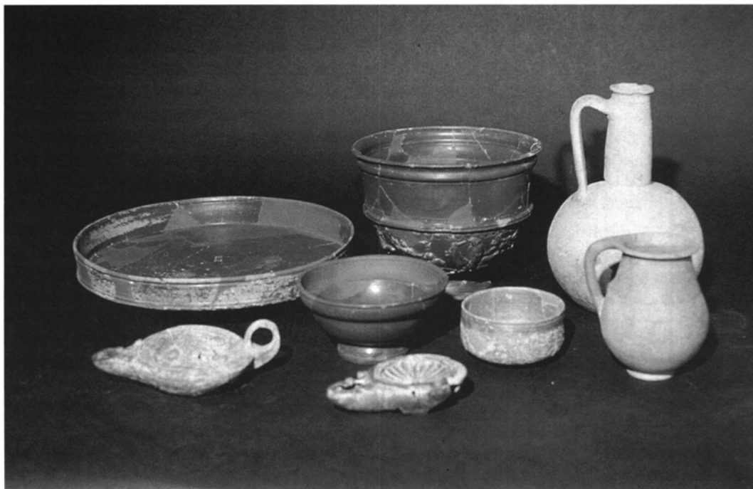
Fig. 3. La gran activitat constructiva de la primera meitat del segle I dC va acompanyada d'una gran riquesa pel que fa als conjunts ceràmics recuperats.

clarament que, tot i que les estructures ja havien estat abandonades, encara es conservaven visibles els murs que determinen les orientacions dels sepulcres.