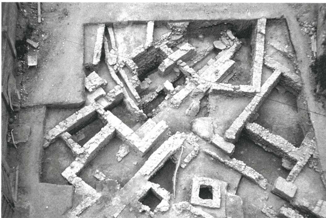
Fig. 1. Vista general de la segona fase de la primera part abans de la construcció de l'edifici. L'excavació es va finalitzar un cop construït.

aspectes decisius a l'hora d'establir un assentament al segle v aC. La seva existència havia estat suposada des d'antic, basant-se fonamentalment en les cites d'autors clàssics, així com en la relativa abundància de monedes amb la llegenda ibèrica KESE a la ciutat de Tarragona. Això no obstant, es considerava que es tractava d'un petit oppidum , emplaçat al turó més elevat, on posteriorment se situarà el praesidium romà. Aquesta fou la tesi acceptada durant molt de temps, fins que als anys setanta, i arran d'una intervenció portada a terme per M. Berges al carrer dels Caputxins, es posà de manifest l'existència de l'assentament ibèric a la part baixa. Les dades d'aquesta intervenció foren confirmades per actuacions posteriors en la mateixa zona a càrrec de M.T. Miró (Miró, 1987; Miró, 1988). Atès el traçat de la posterior línia defensiva republicana, es considerà que es devia tractar d'un nucli de petites dimensions, que devia ser englobat dins del perímetre urbà de Tàrraco (Aquilué, Dupré, 1986; Miró, 1988).