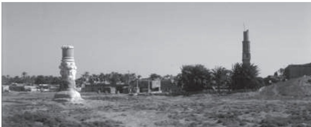
Figura 2. Aquesta columna és una de les restes arquitectòniques urbanes encara visibles al jaciment. Al fons, el minaret assenyala la posició de la porta monumental.