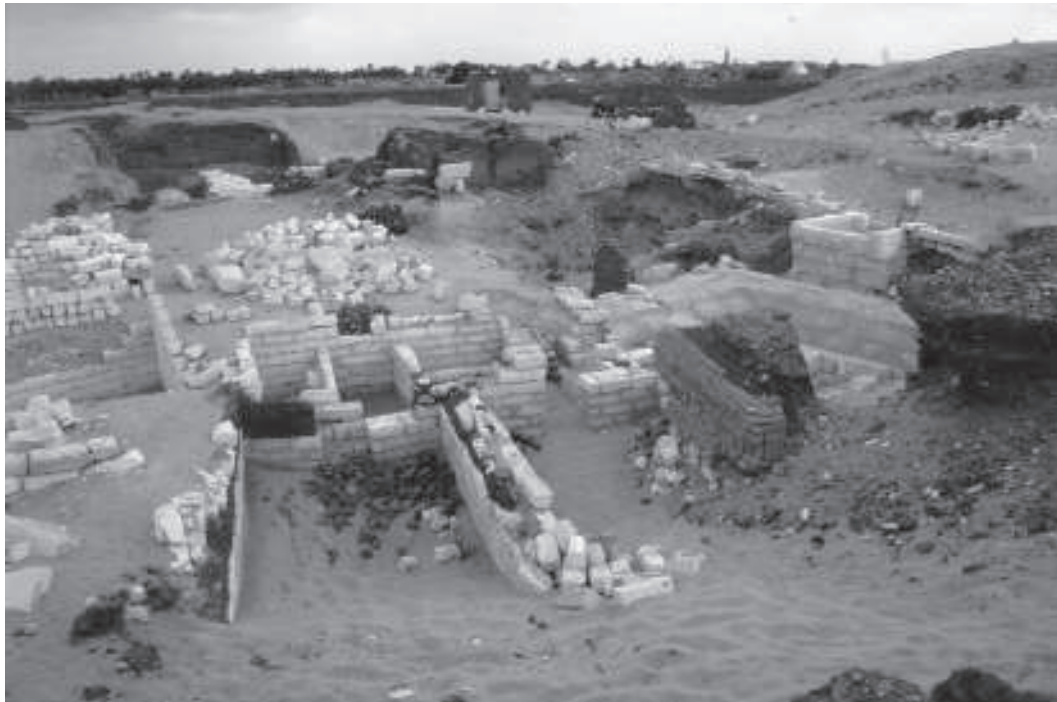
Figura 3. Vista general de l'àrea de necròpolis (sectors 1 i 2).

dues amb el cap vers el nord i tres vers el sud, i estaven cobertes amb cartronatges il·lustrats amb elements i textos de caràcter funerari. Algunes devien portar garlandes de flors al voltant del coll. En aquests moments s'estan estudiant les llavors per poder conèixer els tipus de flors emprats en els collarets. Un cop realitzada la documentació del contingut, vam tornar a cobrir amb sorra el retall perquè es conservés millor.