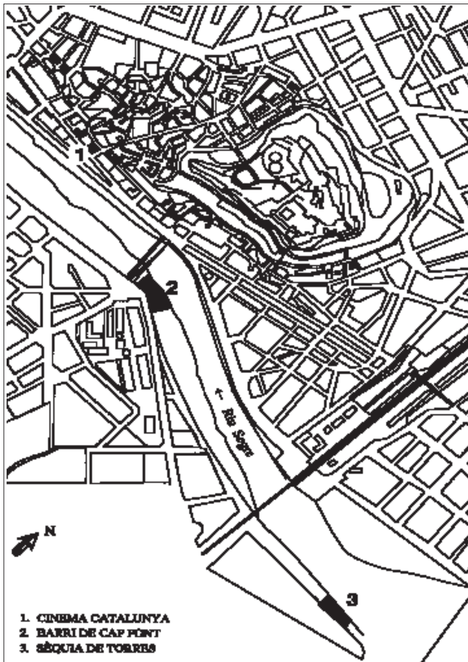
Figura 1. Plànol de situació de les intervencions