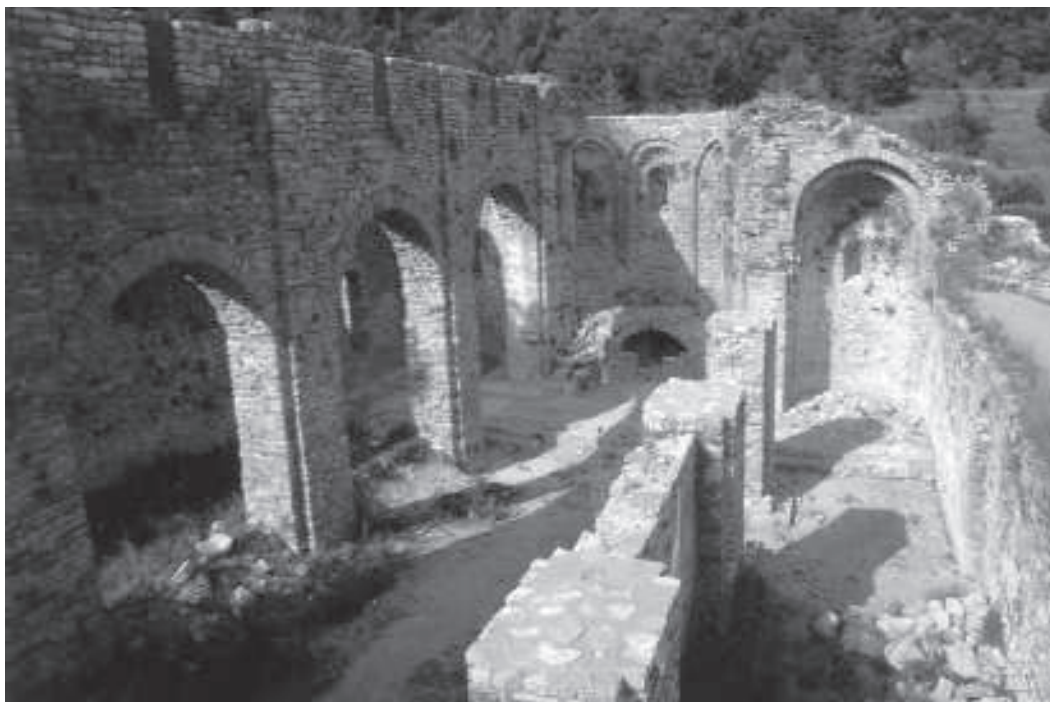
Figura 2. Vista General de l'església romànica del monestir.

actualment. Aquest àmbit va ser objecte de diverses compartimentacions de les quals en molts casos només ens n'han arribat restes molt fragmentàries, donada la reutilització posterior del sector com a cementiri i la remoció continuada del sediment que aquest tipus d'ocupació comporta.