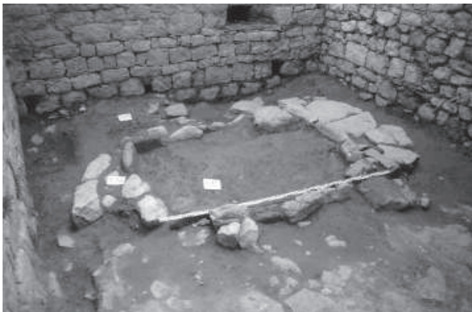
Figura 3. Llar de foc corresponent a la cuina del monestir.

limitar a rehabilitar els espais imprescindibles per al funcionament. En aquest sentit, les visites pastorals posteriors a 1430 situen l'altar major de manera provisional al claustre, és de suposar que a l'espera que es poguessin realitzar les obres de reconducció de l'església per reiniciar el culte. Aquestes obres van consistir en la reconstrucció de la nau sud del temple per poder fer front a les funcions litúrgiques del monestir i la parròquia. Al mateix temps es devien arranjar les dependències imprescindibles per allotjar els pocs monjos que encara hi residien.