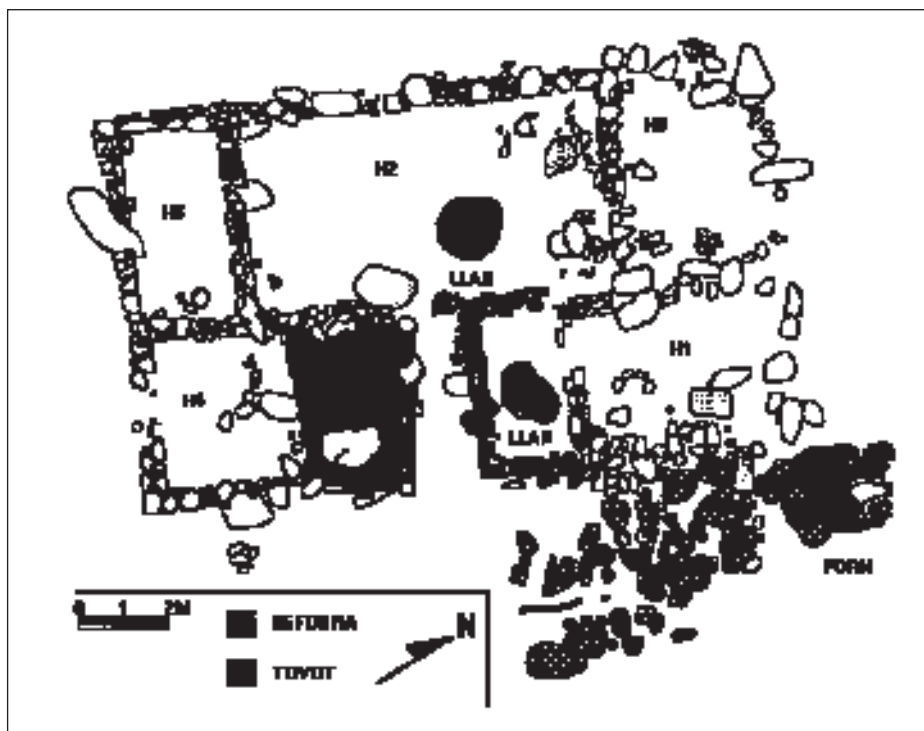
Figura 2. Sector I. Planta del mas ibèric