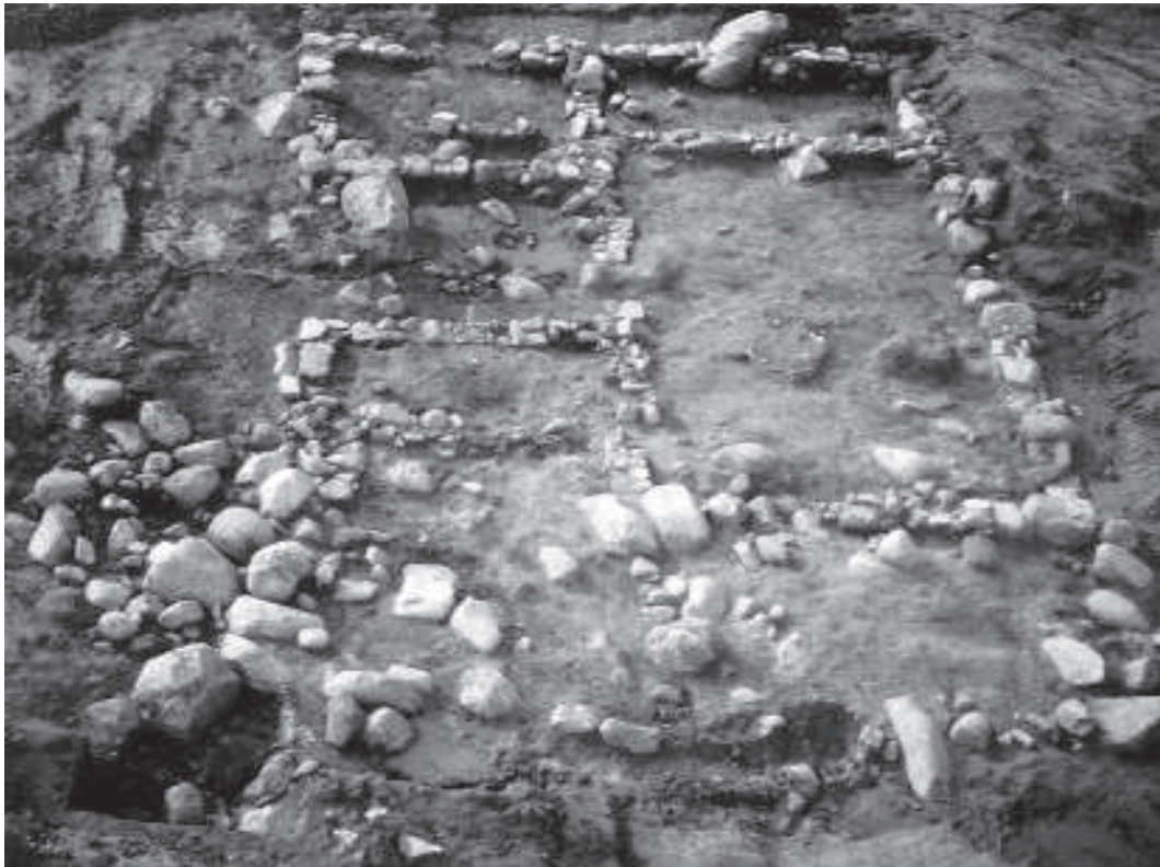
Figura 1. Vista del jaciment